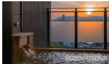
花樹海の客室温泉