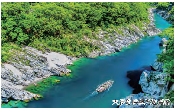
大歩危峡観光遊覧船