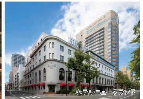
ホテルニューグランド