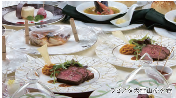
ラピスタ大雪山の夕食