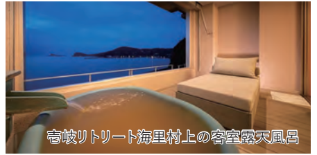
壱岐リトリート海里村上の客室露天風呂