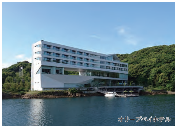
オリーブベイホテル