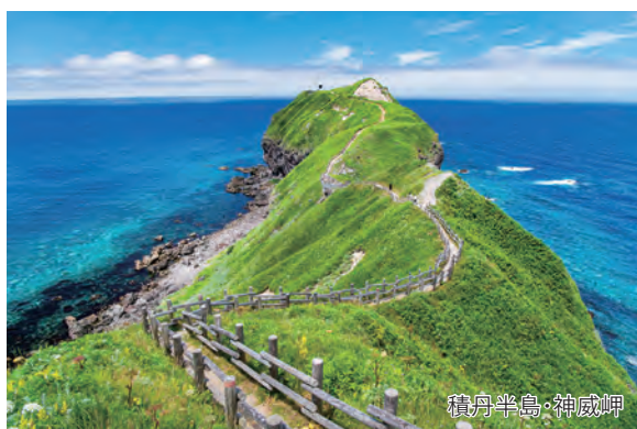
積丹半島・神威岬