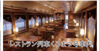
レストラン列車くろまつ号車内