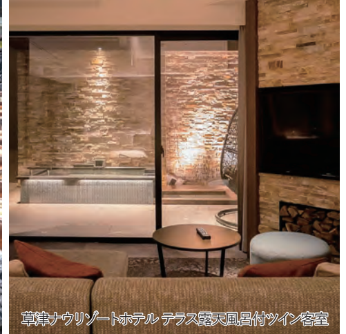
草津ナウリゾートホテル テラス露天風呂付ツイン客室