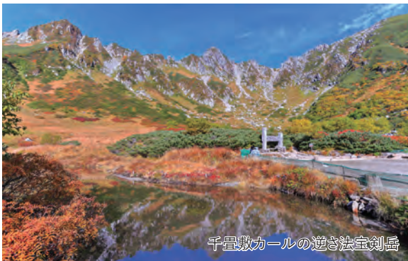
千畳敷カールの逆さ法室剣岳