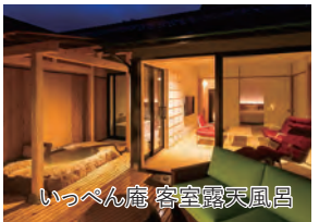
いっぺん庵 客室露天風呂