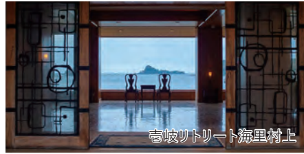
壱岐リトリート海里村上