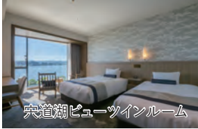
宍道湖ビューツインルーム