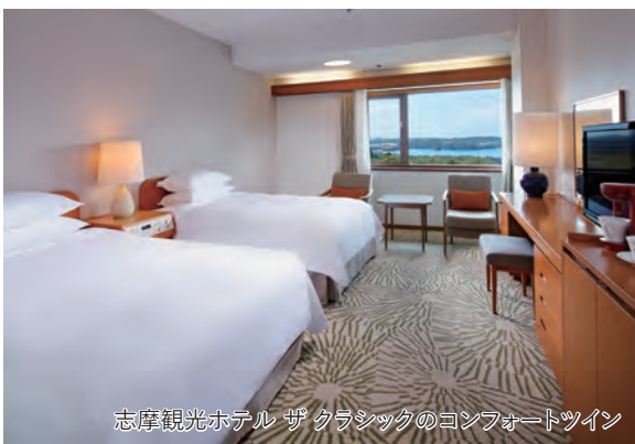
志摩観光ホテル ザ クラシックのコンフォートツイン