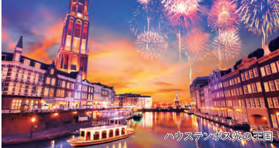
ハウステンボス光の王国