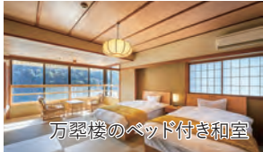
万翠楼のベッド付き和室