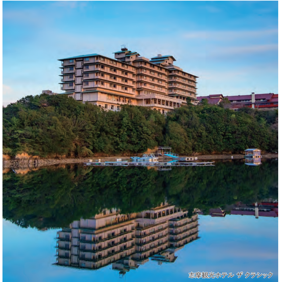
志摩観光ホテル ザ クラシック