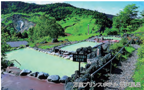
万座プリンスホテル 露天風呂