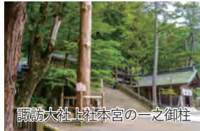
諏訪大社上社本宮の一之御柱