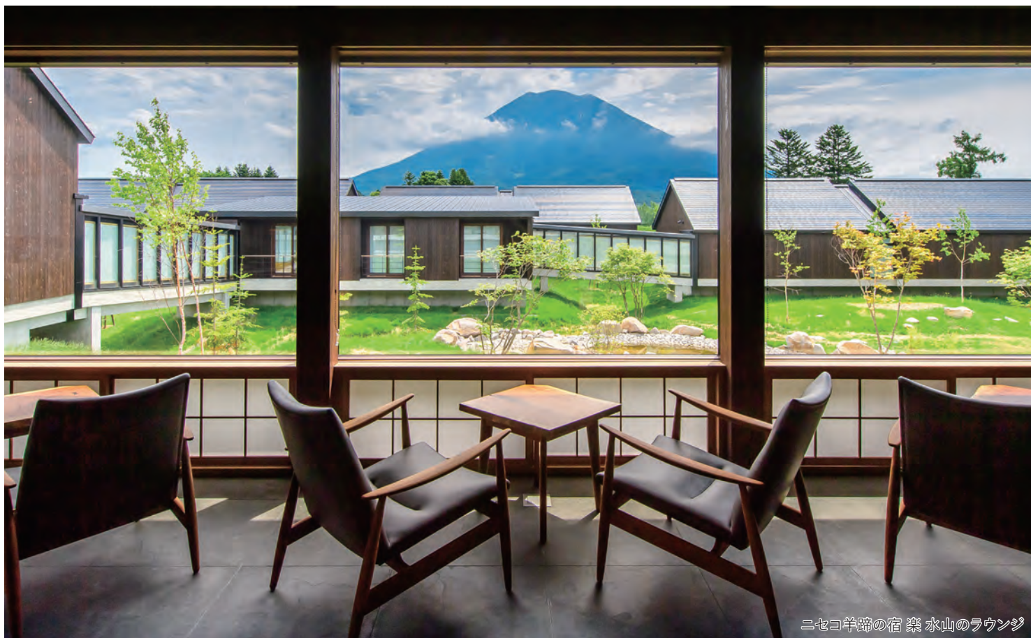
ニセコ羊蹄の宿 楽 水山のラウンジ