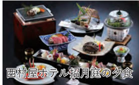
西村屋ホテル招月庭の夕食