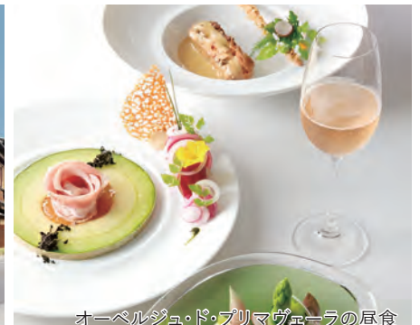
オーベルジュ・ド・プリマヴェーラの朝食