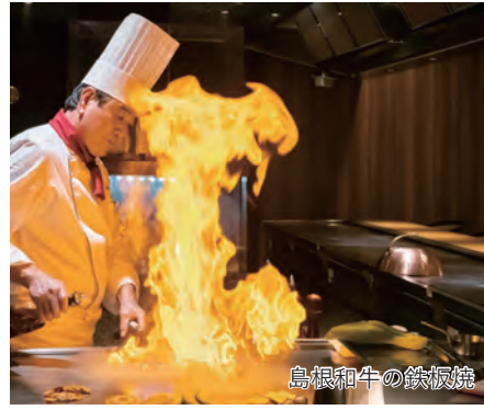
島根和牛の鉄板焼