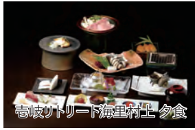
壱岐リトリート海里村上 夕食