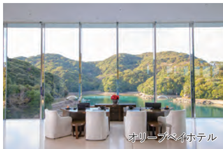
オリーブベイホテル