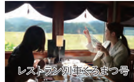
レストラン列車くろまつ号