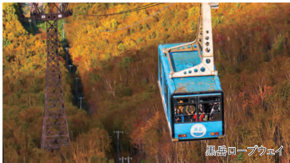
黒岳ロープウェイ