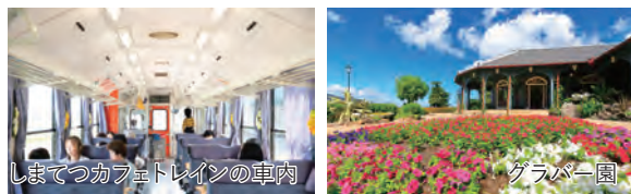
しまてつカフェトレインの車内

※天候状況や車両故障等により観光列車が運休となる場合は、観光バスでの移動となります。 ※1日目のご夕食は、当日の仕入れ状況により、食材が変更となる場合がございます。 ※当ツアーは、アレルギー食材・苦手食材の変更・除去対応を行っておりません。 ※列車のお座席は、横並び確約ではございません。予めご了承ください。