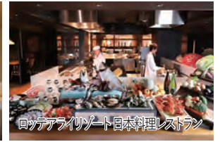
ロッテアライリゾート日本料理レストラン