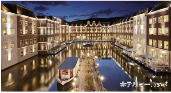
ホテルヨーロップ