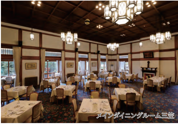
メインダイニングルーム三笠