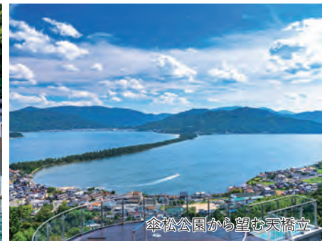
傘松公園から望む天橋立