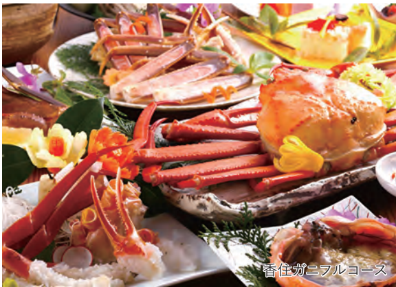
香住ガニフルコース