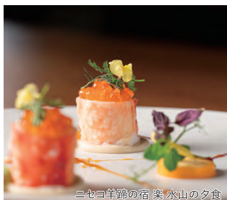
ニセコ羊蹄の宿 楽 水山の夕食