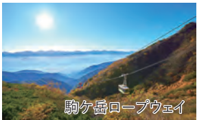
駒ヶ岳ロープウェイ