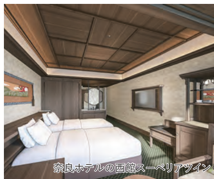
奈良ホテルの西館スーペリアツイン