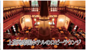
上高地帝国ホテルのロビーラウンジ