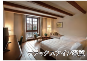
デラックスツイン客室