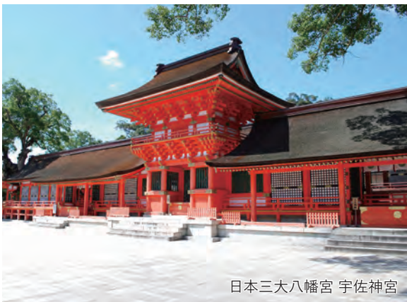
日本三大八幡宮 宇佐神宮