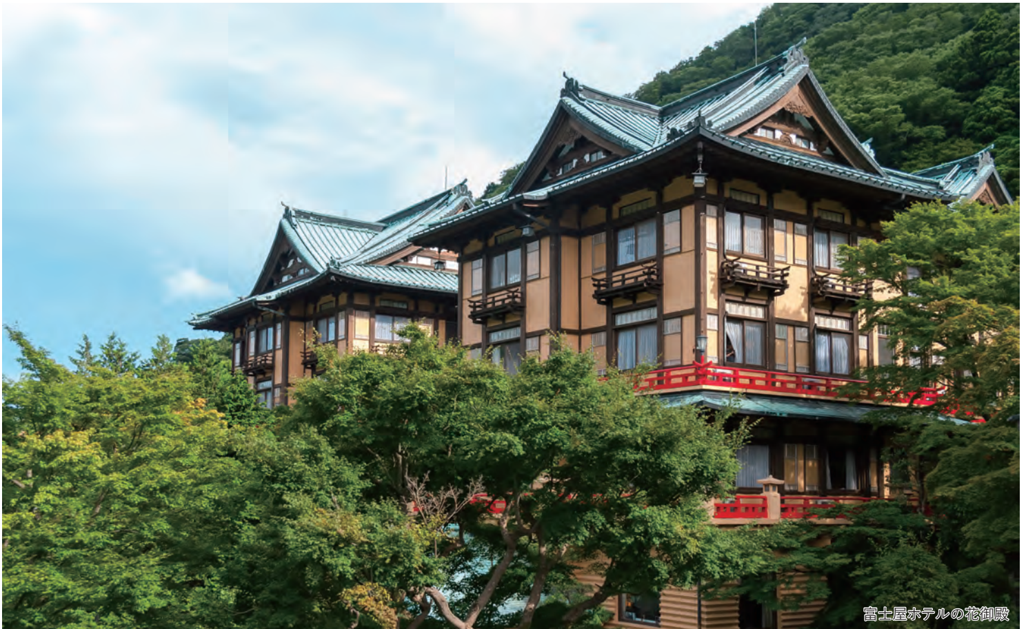
富士屋ホテルの花御殿