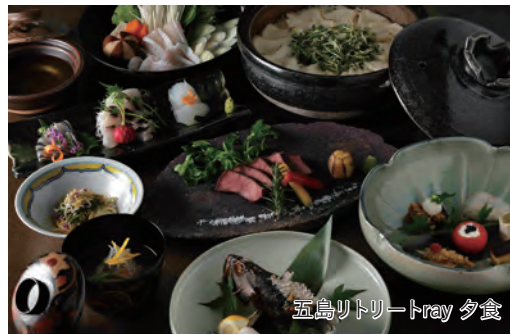
五島リトリートray 夕食