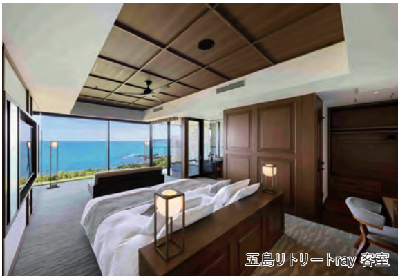
五島リトリートray 客室