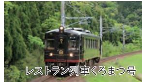
レストラン列車くろまつ号