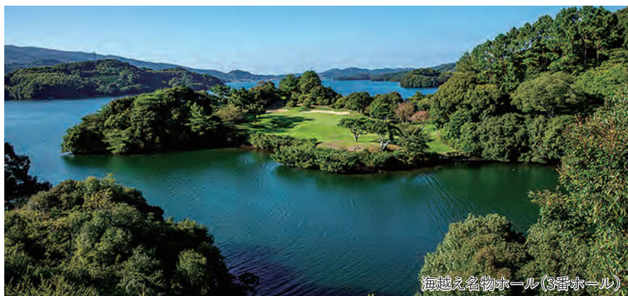
海越え名物ホール(3番ホール)