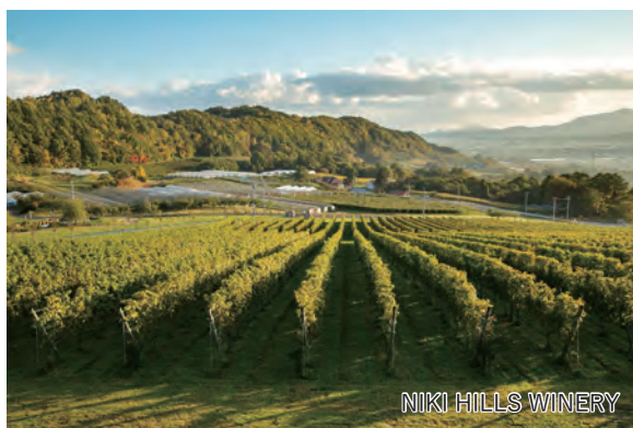
NIKI HILLS WINERY

旅行期間 2026年9月20日(日)～22日(火・祝) 旅行代金 お一人様 368,000円(2名1室/伊丹空港発着) ※その他発着地をご希望の場合は、お問い合わせください。 募集人数 12名(最少催行人数10名) 添乗員 新千歳空港から同行いたします 交通機関 航空機 現地貸切バス(運行バス会社:ドリーム観光バス) 食事条件 朝2回・昼2回・夕2回 宿泊場所 小樽/オーセントホテル小樽(オーセントスイート洋室) ニセコ樺山温泉/ニセコ羊蹄の宿 楽 水山(客室温泉付スイート洋室)