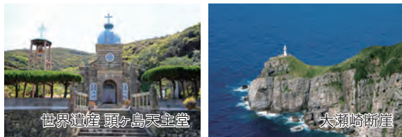
世界遺産 頭ヶ島天主堂

※1日目新幹線は山陽・九州新幹線「みずほ」普通車指定席(2×2列シート)でのお手配となります。 ※列車および航空機のお座席は、横並び確約ではございません。予めご了承ください。