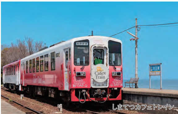
しまてつカフェトレイン