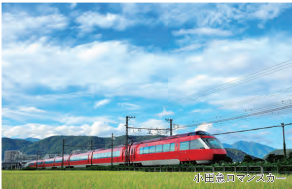
小田急ロマンスカー