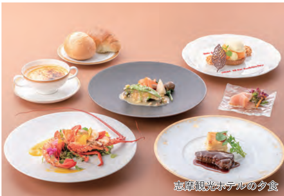
志摩観光ホテルの夕食