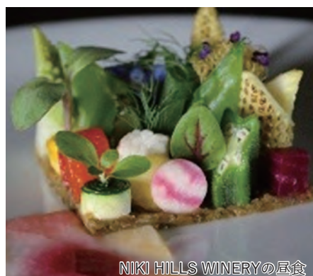
NIKI HILLS WINERYの朝食