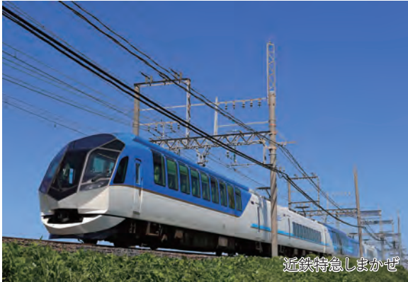
近鉄特急しまかぜ