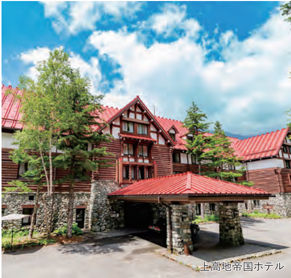
上高地帝国ホテル