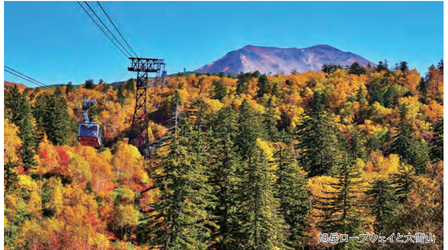
旭岳ロープウェイと大雪山