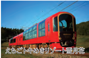
えちごトキめきリゾート雪月花