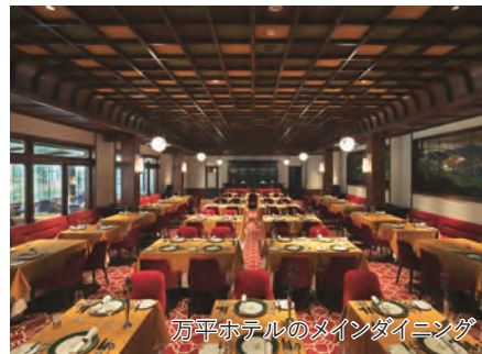
万平ホテルのメインダイニング