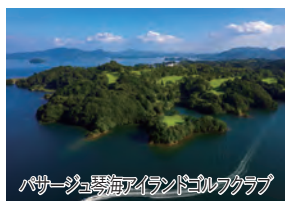
パサージュ琴海アイランドゴルフクラブ