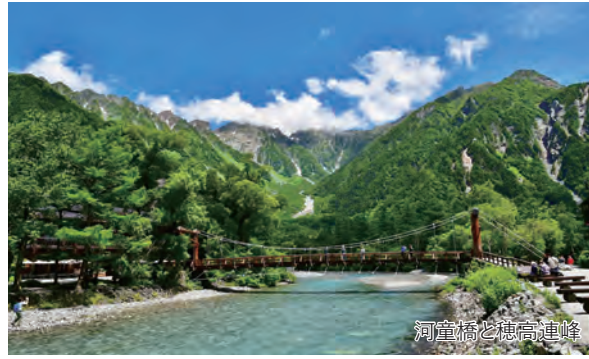
河童橋と穂高連峰