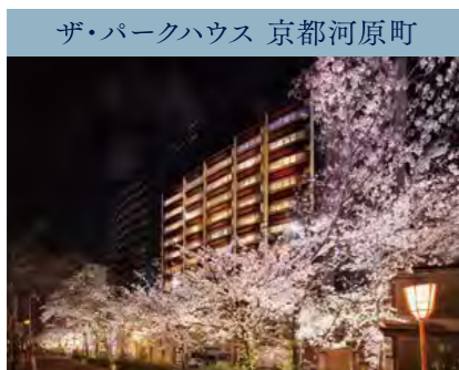
ザ・パークハウス 京都河原町