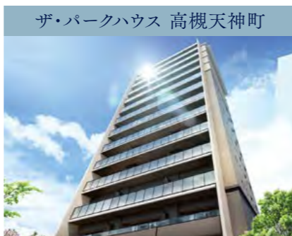
ザ・パークハウス 高槻天神町

新快速停車駅 JR「高槻」駅徒歩8分 全邸南向き、見晴らしの14階建レジデンス。