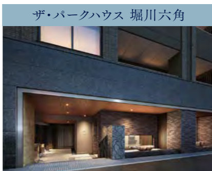
ザ・パークハウス 堀川六角