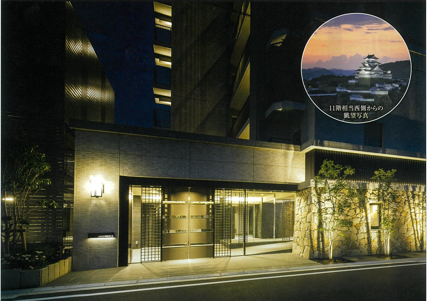
※掲載の写真は2021年6月撮影したものです。