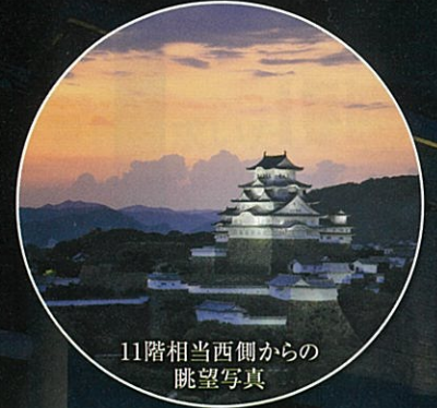
11階相当西側からの眺望写真