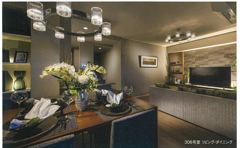
306号室 リビング・ダイニング