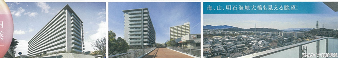
※掲載のイラストは、本プロジェクトの生活イメージを表現したイメージビジュアルです。イラストには、省略されている建物・道路等があり、各施設的位置・形状・スケール・色調は実際と異なります。 ※本件建物の外観・内装・仕上げ・植栽等は計画中の図面に基き描き起こしたもので、施工上の都合または行政官庁の指導等により、変更となる場合があります。※掲載の写真は、2021年2月に現地にて撮影したものです。