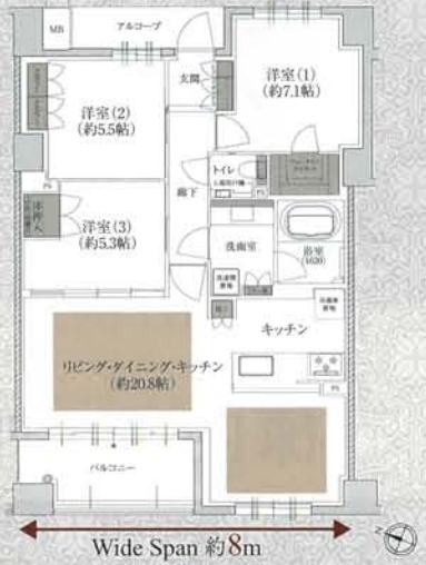
Wide Span 約8m

■収納 ■床暖房 ■掃き出し窓 ■通風 ■採光 ※WIC=ワークインクローゼット