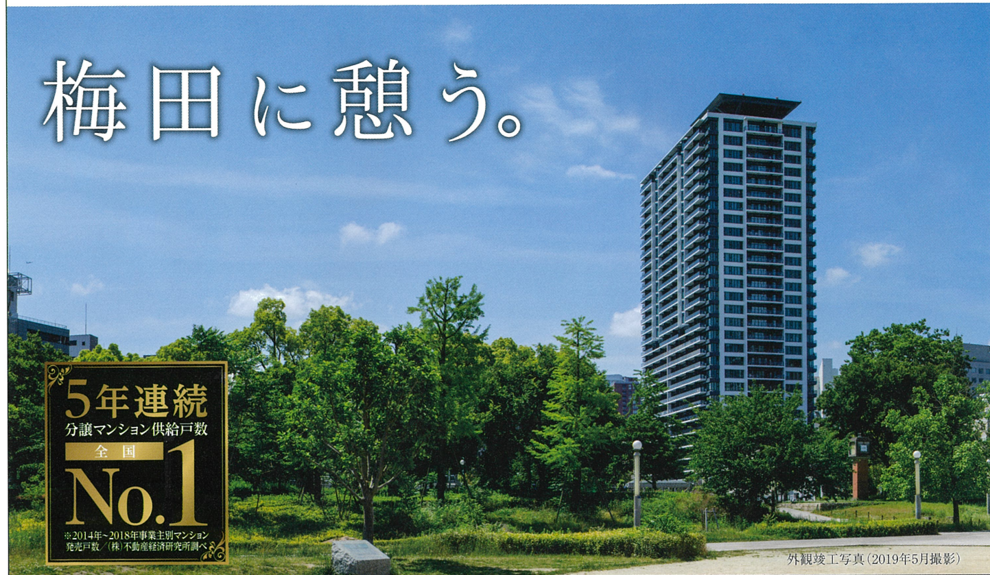
外観竣工写真（2019年5月撮影）

5年連続 分譲マンション供給戸数 全国 No.1 ※2014年～2018年事業主別マンション 発売戸数（株）不動産経済研究所調べ