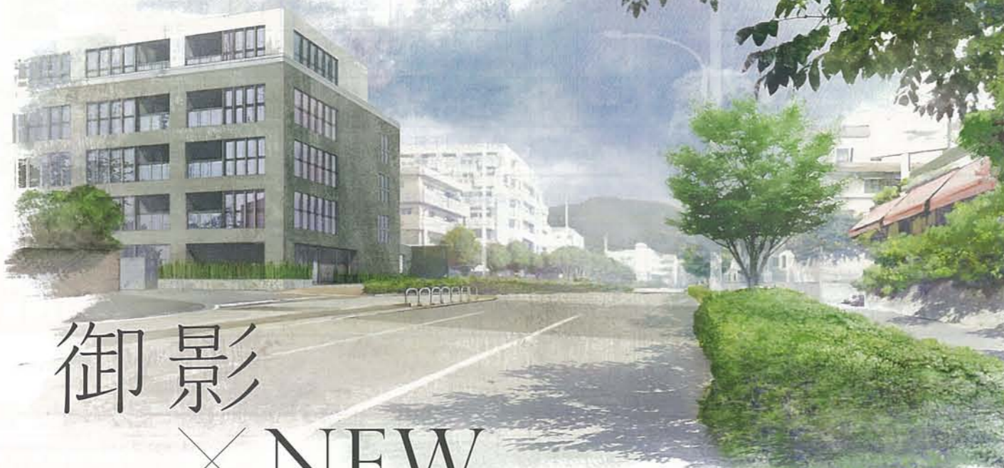
外観完成イラスト