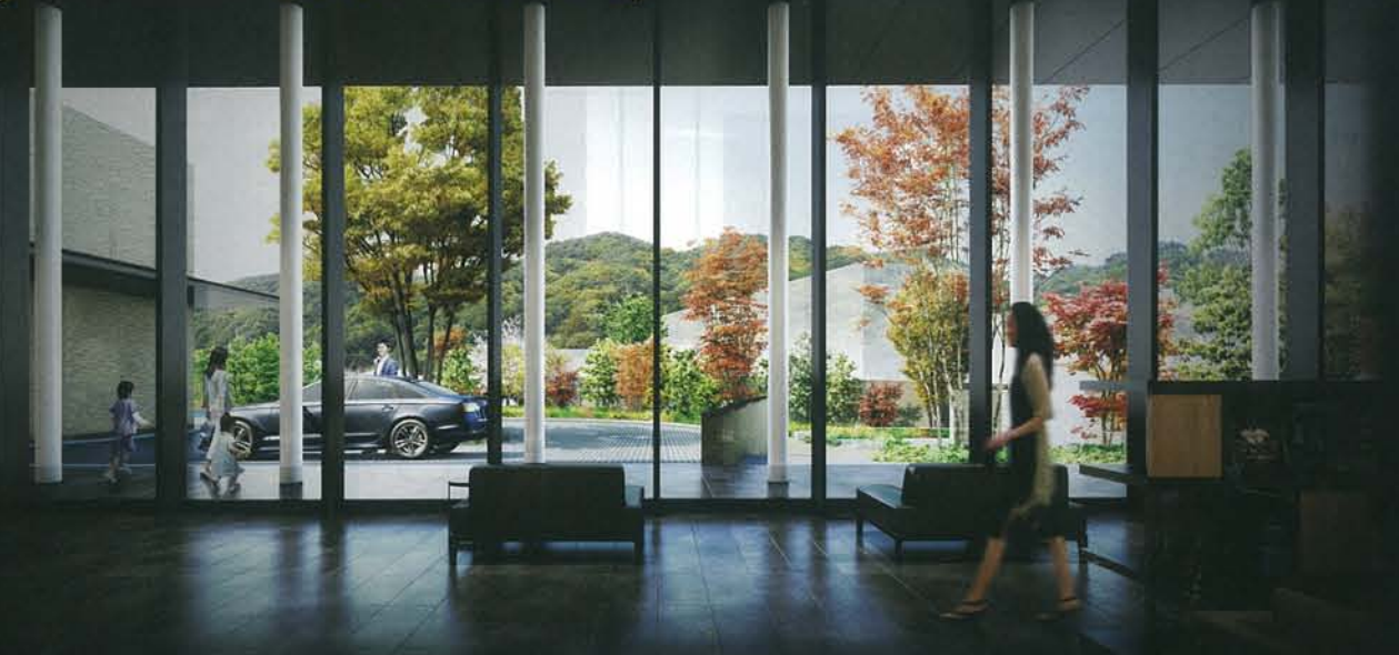
エントランス完成予想図