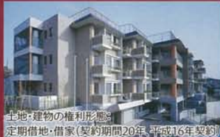
土地・建物の権利形態: 定期借地・借家(契約期間20年、平成16年契約)

〒573-0017 大阪府枚方市伊田町9番60号 京阪交野線「星ヶ丘駅」より徒歩約7分(約500m)