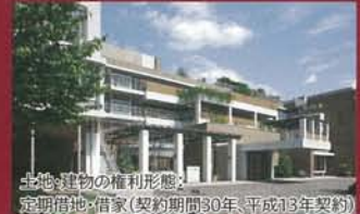
土地・建物の権利形態: 定期借地・借家(契約期間30年、平成13年契約)

〒572-0089 大阪府寝屋川市香里西之町22番7号 京阪本線「香里園駅」より徒歩約15分(約1.2km)