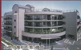
土地の権利形態は賃借

〒571-0063 大阪府門真市常称寺町10番1号 京阪本線「大和田駅」より徒歩約6分(約450m)