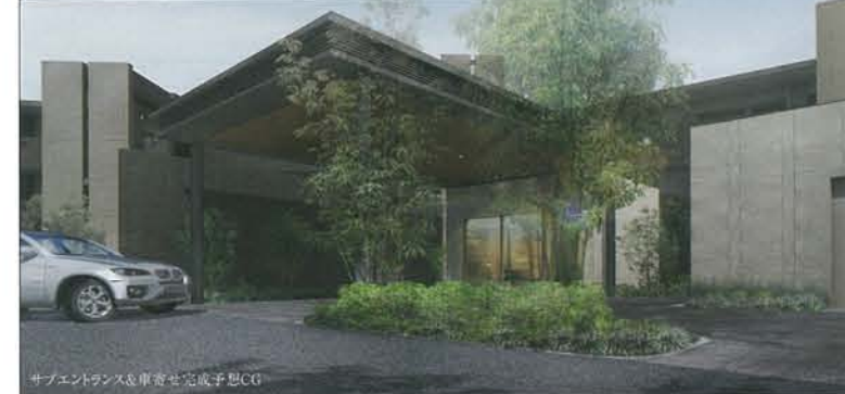
サブエントランスと車寄せ完成予想CG