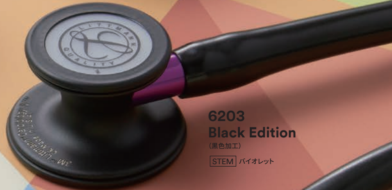
6203 Black Edition (黒色加工) [STEM] バイオレット