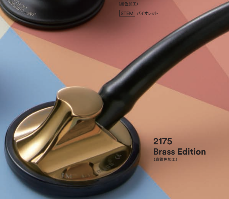
2175 Brass Edition (真鍮色加工)