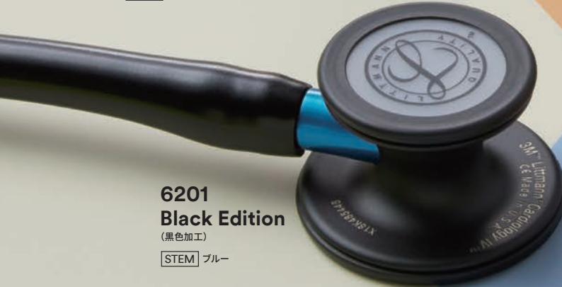
6201 Black Edition (黒色加工) [STEM] ブルー