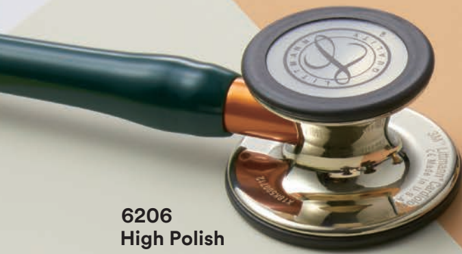
6206 High Polish Champagne Edition (ハイポリッシュシャンパン加工) [STEM] オレンジ