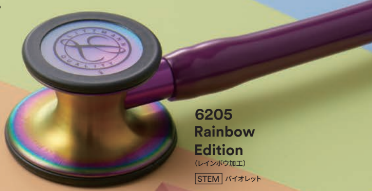
6205 Rainbow Edition (レインボウ加工) [STEM] バイオレット