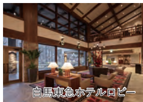
白馬東急ホテルロビー