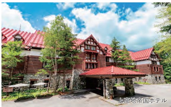
上高地帝国ホテル