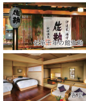
伝承千年の館 佐勘