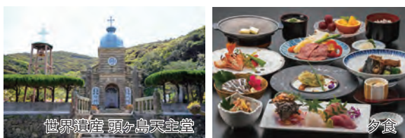
世界遺産 頭ヶ島天主堂