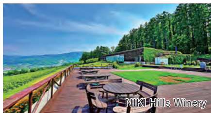
NIKI Hills Winery