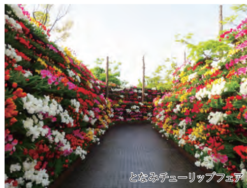
となみチューリップフェア