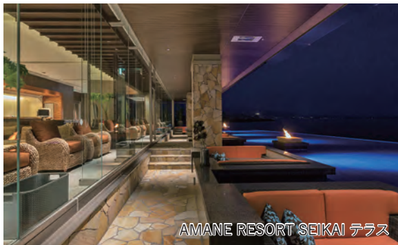
AMANE RESORT SEIKAI テラス

源泉掛け流しの露天風呂付「AMANE RESORT SEIKAI」で過ごす3日間