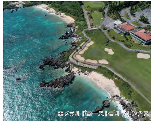
エメラルドコーストゴルフリンクス