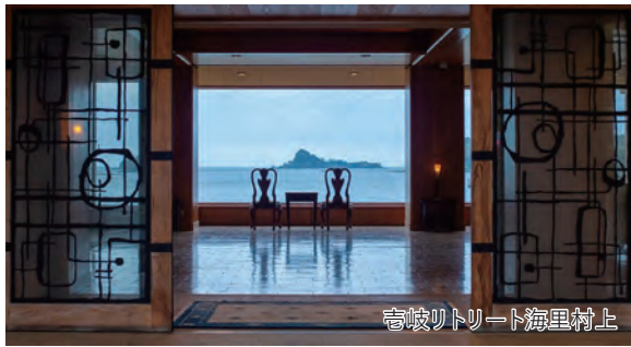
壱岐リトリート海里村上