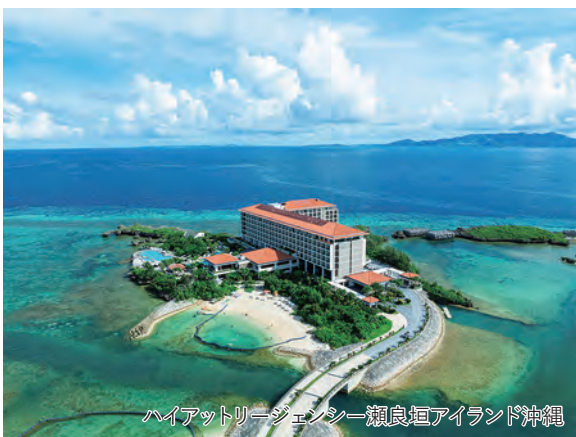
ハイアットリージェンシー瀬良垣アイランド沖縄

旅行期間 2026年5月3日(日)～5日(火・祝) 旅行代金 お一人様 328,000円(2名1室/伊丹空港発着) ※その他発着地をご希望の場合は、お問い合わせください。 募集人数 16名(最少催行人数10名) 添乗員 同行いたします 交通機関 航空機・現地貸切バス(運行バス会社:さつま交通観光) 食事条件 朝2回・昼3回・夕2回 宿泊場所 さつま乃湯/城山ホテル鹿児島(桜島ビューツイン)