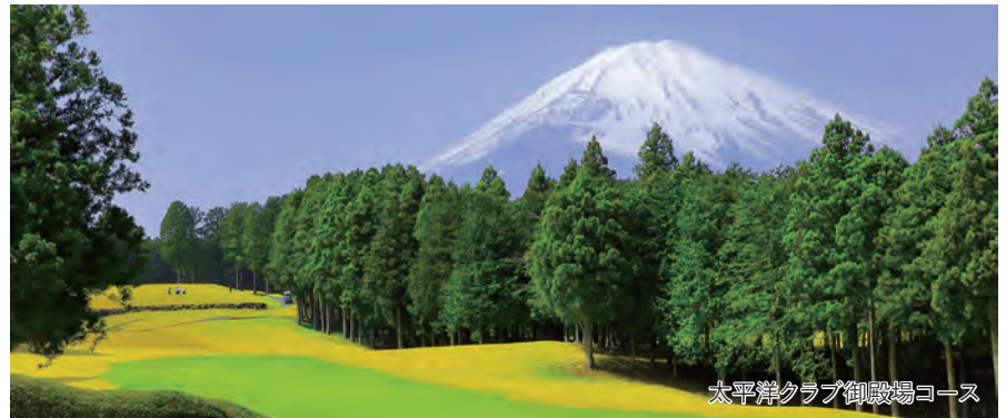
太平洋クラブ御殿場コース