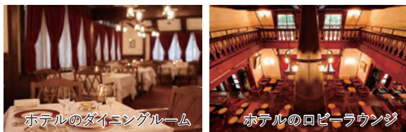
ホテルのダイニングルーム