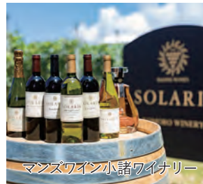
マンズワイン小諸ワイナリー