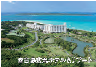
宮古島東急ホテル&amp;リゾート