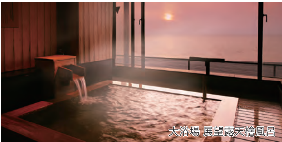
大浴場 展望露天檜風呂