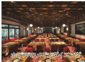
ホテルのメインダイニング