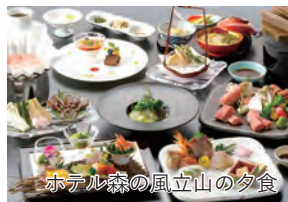
ホテル森の風立山の夕食