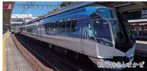
観光特急しまかぜ

宿泊場所 伊勢志摩温泉/賢島宝生苑 (特別フロア「翠景」・ベッド付き和室または和室)