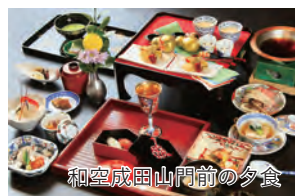
和空成田山門前の夕食