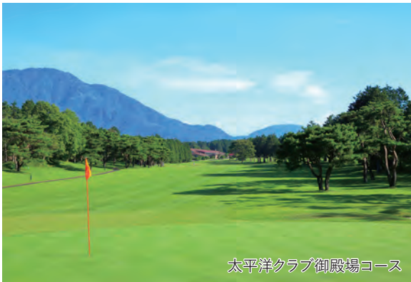
太平洋クラブ御殿場コース