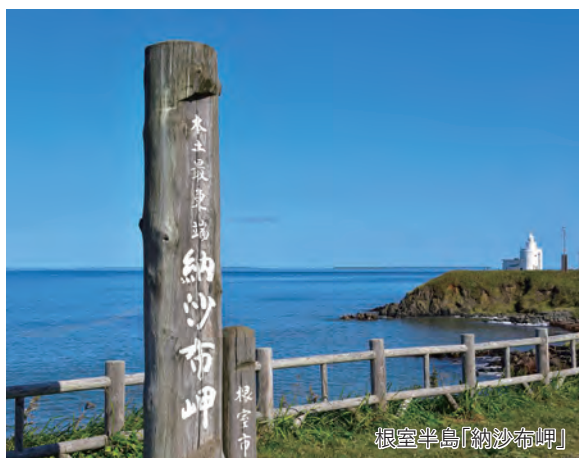
根室半島「納沙布岬」