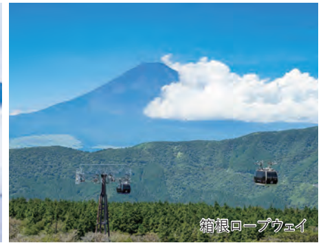
箱根ロープウェイ