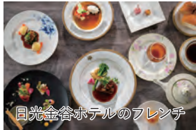
日光金谷ホテルのフレンチ