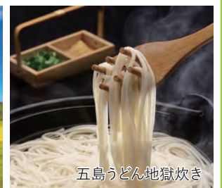
五島うどん地獄炊き