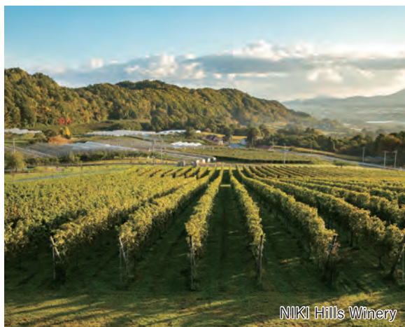
NIKI Hills Winery