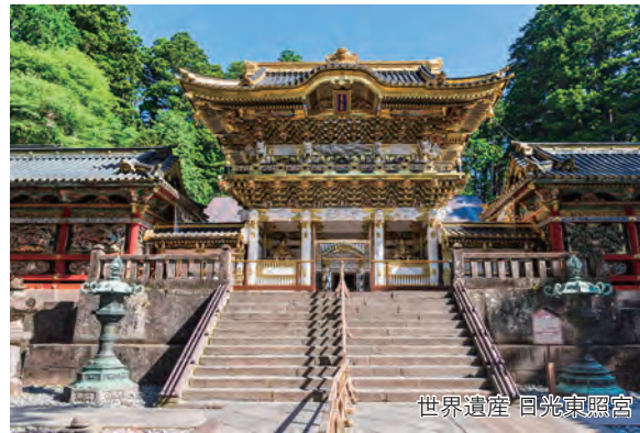
世界遺産 日光東照宮