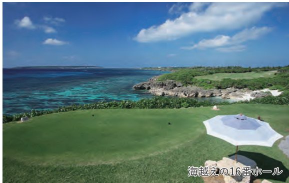
海越えの16番ホール