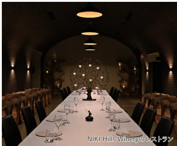
NIKI Hills Wineryのレストラン