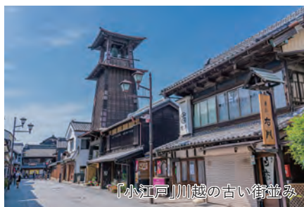
「小江戸」川越の古い街並み

旅行期間 2026年5月3日(日)～5日(火・祝) 旅行代金 お一人様 268,000円(2名1室/伊丹空港発着) ※その他発着地をご希望の場合は、お問合せください。 ※2泊目ベッド付和室をご希望の場合は、お一人様8,800円追加 募集人数 16名(最少催行人数10名) 添乗員 同行いたします 交通機関 JR東海道新幹線【グリーン席・禁煙車】 ※JR上越新幹線【普通指定席・禁煙車】 現地貸切バス(運行バス会社:西武観光バス) 食事条件 朝2回・昼3回・夕2回 宿泊場所 川越/川越プリンスホテル(洋室) 所沢/中国割烹旅館 掬水亭(和室)