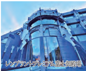
レンブラントプレミアム富士御殿場