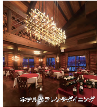
ホテルのフレンチダイニング