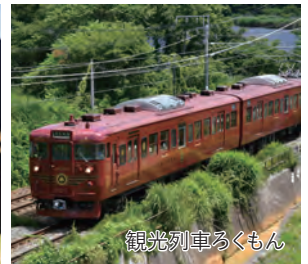
観光列車ろくもん