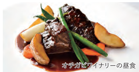
オチガビワイナリーの昼食