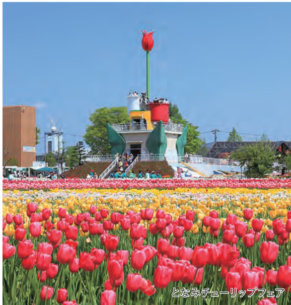
となみチューリップフェア