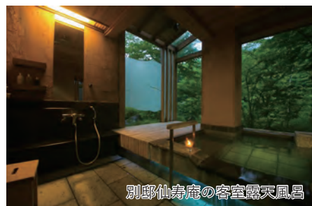
別邸仙寿庵の客室露天風呂

旅行期間 2026年5月3日(日)～5日(火・祝) 旅行代金 お一人様 298,000円(2名1室/新大阪駅発着) ※その他発着地をご希望の場合は、お問合せください。 ※2泊目、露天風呂付和洋室ご希望の場合は、お一人様15,000円追加 募集人数 14名(最少催行人数10名) 添乗員 同行いたします 交通機関 JR新幹線【グリーン席・禁煙車】 ※東京以遠【普通指定席・禁煙車】 現地貸切バス(運行バス会社:新和観光バス) 食事条件 朝2回・昼2回・夕2回 宿泊場所 伊香保温泉／ホテル天坊(和室または和洋室) 谷川温泉／別邸仙寿庵(露天風呂付和室)