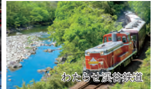
わたらせ渓谷鉄道