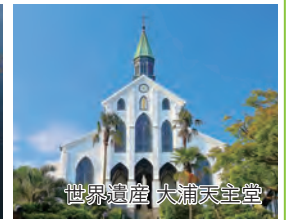
世界遺産 大浦天主堂

旅行期間 2026年5月3日(日)～5日(火・祝) 旅行代金 お一人様 258,000円(2名1室/新大阪駅発着) ※その他発着地をご希望の場合は、お問い合わせください。 ※小学生のお子様は20,000円引きとなります。 ※軍艦島クルーズは船会社規定により未就学児はご乗船いただけません。 募集人数 16名(最少催行人数10名) 添乗員 同行いたします 交通機関 JR新幹線【グリーン席・禁煙車】 ※JR特急【普通指定席・禁煙車】 現地貸切バス(運行バス会社:長崎バス観光) 食事条件 朝2回・昼0回・夕0回 宿泊場所 ハウステンボス/ホテルヨーロッパ(洋室/連泊)