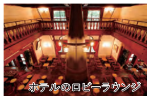
ホテルのロビーラウンジ

旅行期間 2026年5月3日(日)～5日(火・祝) 旅行代金 お一人様 298,000円(2名1室/新大阪駅発着) ※ベランダ付ツインヘッパップグレードをご希望の場合、 お一人様55,000円(2泊分)追加 ※その他発着地をご希望の場合は、お問い合わせください。 募集人数 16名(最少催行人数10名) 添乗員 同行いたします 交通機関 JR新幹線【グリーン席・禁煙車】 ※JR特急【普通指定席・禁煙車】 現地貸切バス(運行バス会社:栄和交通) 食事条件 朝2回・昼1回・夕2回 宿泊場所 上高地/上高地帝国ホテル(洋室・連泊)