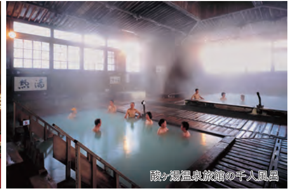
酸ヶ湯温泉旅館の千人風呂