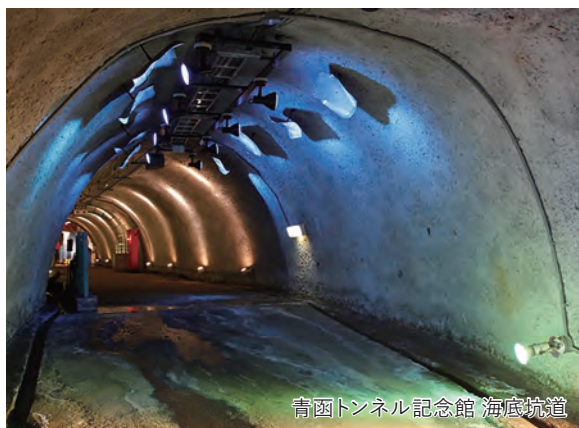
青函トンネル記念館 海底坑道