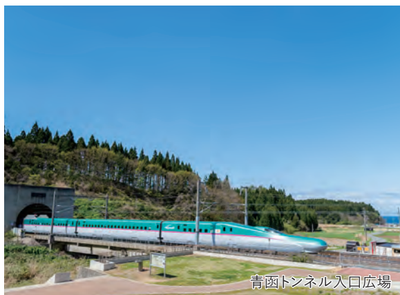
青函トンネル入口広場