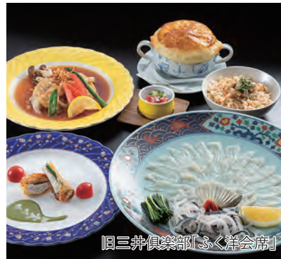
旧三井倶楽部「ふく洋会席」