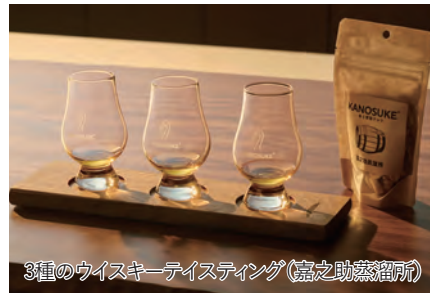
3種のウイスキーテイスティング(嘉之助蒸留所)