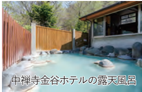
中禅寺金谷ホテルの露天風呂