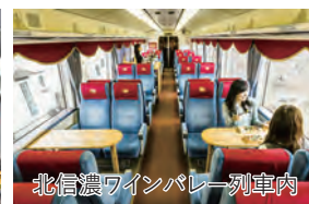
北信濃ワインバレー列車内