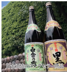
白金酒造のロングセラー商品