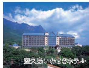
屋久島いわさきホテル