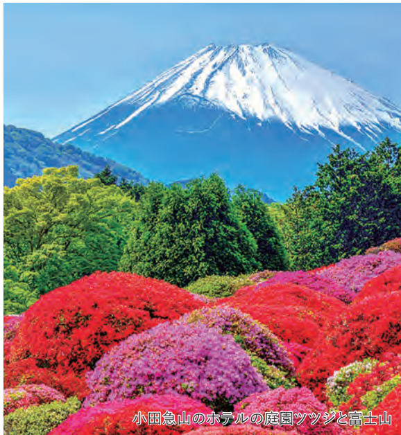
小田急山のホテルの庭園ツツジと富士山