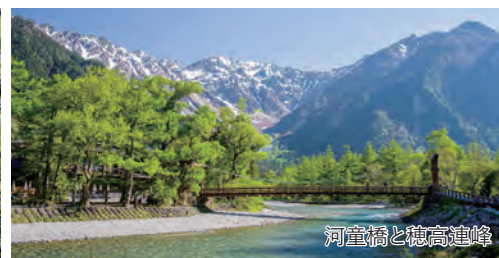
河童橋と穂高連峰