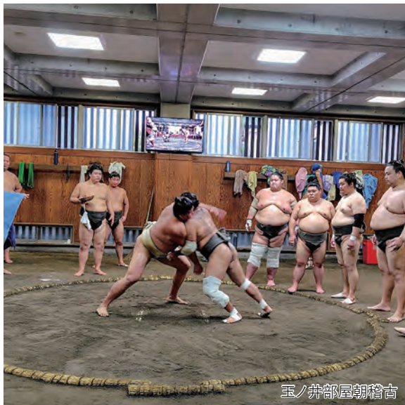
玉ノ井部屋朝稽古