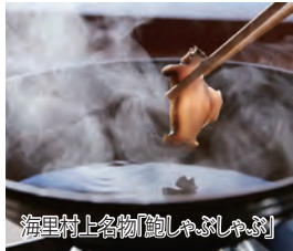
海里村上名物「鮑しゃぶしゃぶ」