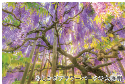
あしかがフラワーパークの大藤棚