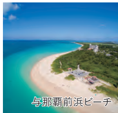
与那覇前浜ビーチ