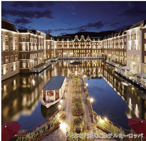
ハウステンボス ホテルヨーロッパ