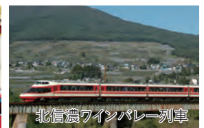
北信濃ワインバレー列車