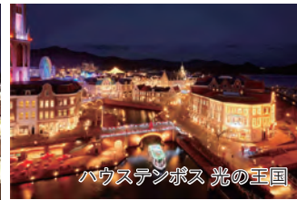
ハウステンボス 光の王国