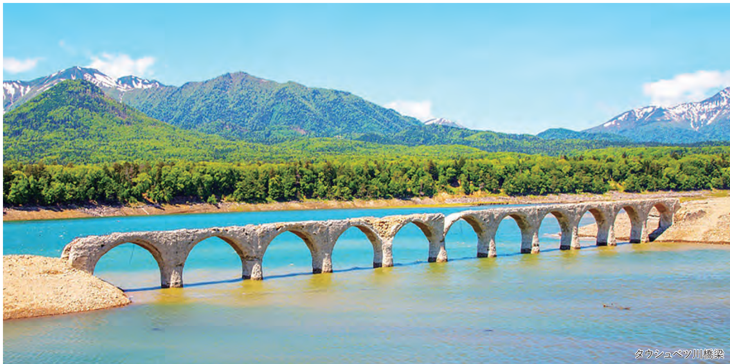
タウシュベツ川橋梁