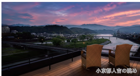
小京都人吉の眺め