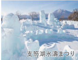
支笏湖氷濤まつり