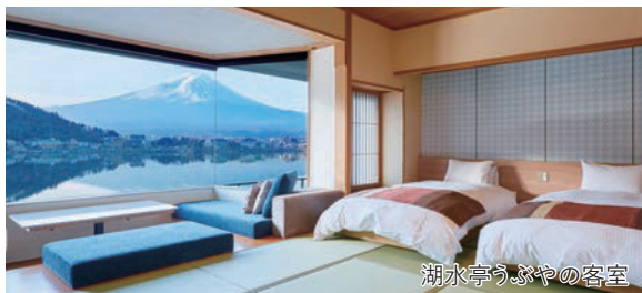
湖水亭うぶやの客室