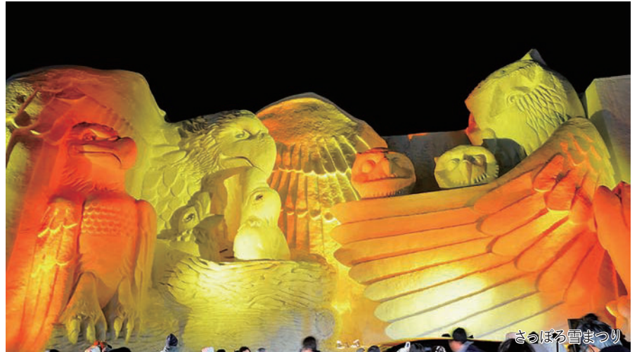
さっぽろ雪まつり