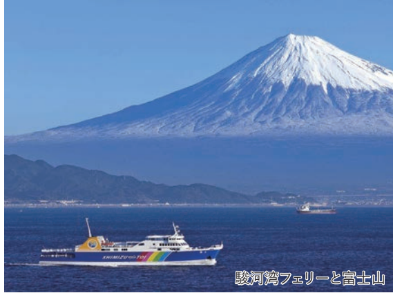
駿河湾フェリーと富士山