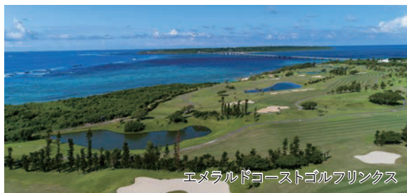
エメラルドコーストゴルフリンクス