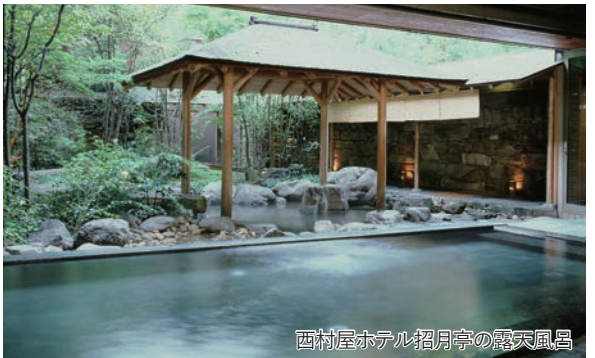
西村屋ホテル招月庭の露天風呂