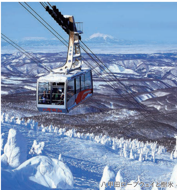
八甲田ロープウェイと樹氷