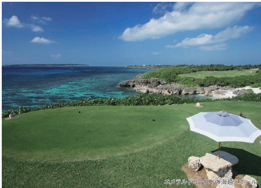
エメラルドコーストの海越えホール

旅のPoint ◎名物の海越えホールや宮古ブルーと称される海を臨むリゾートゴルフをご満喫ください。 ◎南国リゾート宮古島でゆっくりと休日をお過ごしください。ゴルフとフリープランが お選びいただけます。 ◎バスルームとお手洗いがセパレートタイプの「コーラルウィング洋室」もご用意しております。