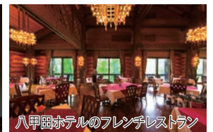
八甲田ホテルのフレンチレストラン