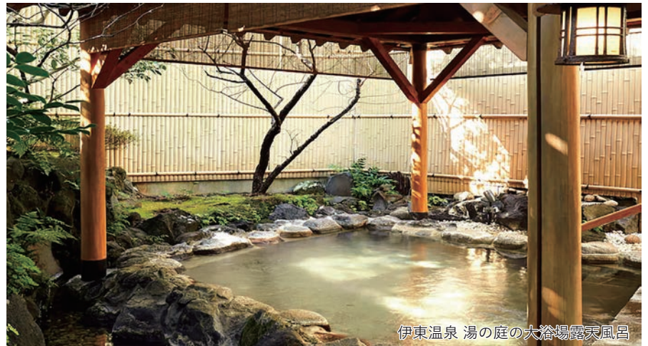
伊東温泉 湯の庭の大浴場露天風呂