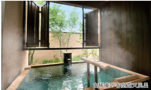
古稀庵の客室露天風呂