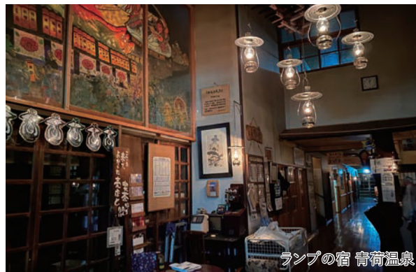
ランプの宿 青荷温泉