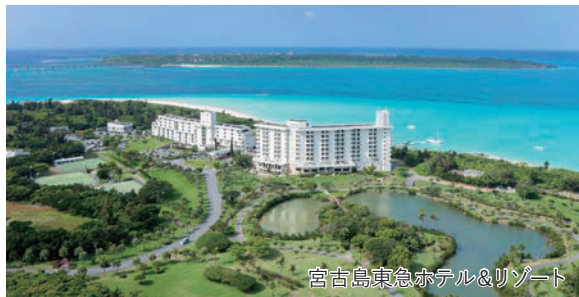
宮古島東急ホテル&リゾート