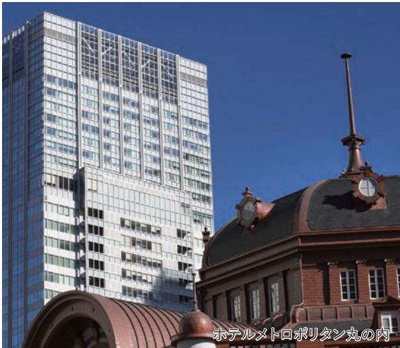
ホテルメトロポリタン丸の内