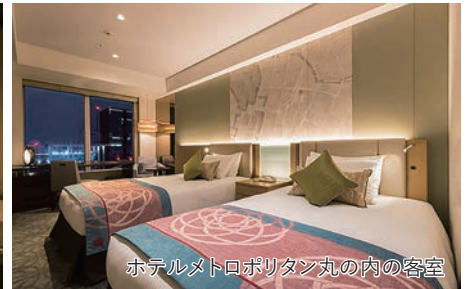
ホテルメトロポリタン丸の内の客室