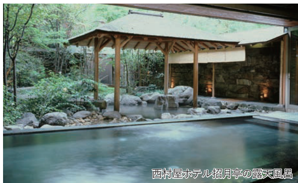
西村屋ホテル招月亭の露天風呂