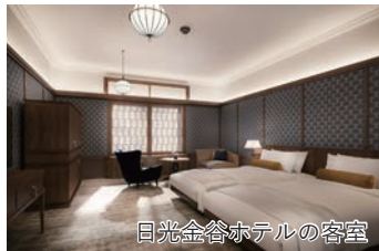
日光金谷ホテルの客室