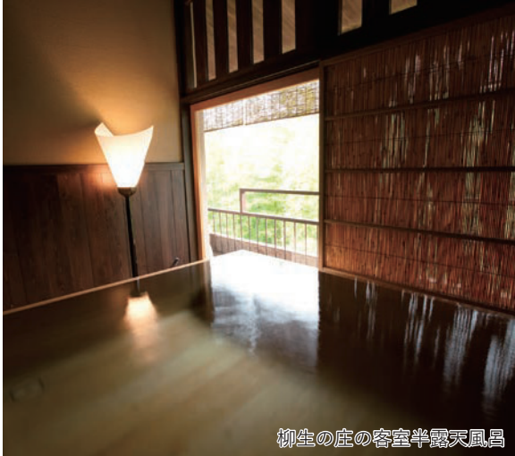
柳生の庄の客室半露天風呂