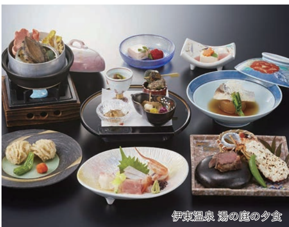
伊東温泉 湯の庭の夕食