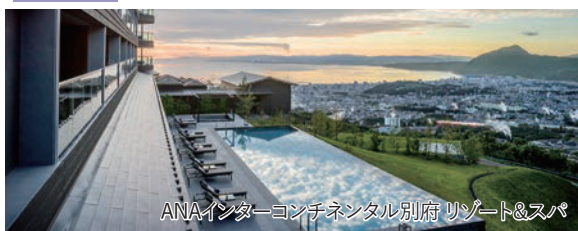
ANAインターコンチネンタル別府リゾート&amp;スパ