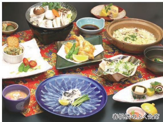
春帆楼のふく会席