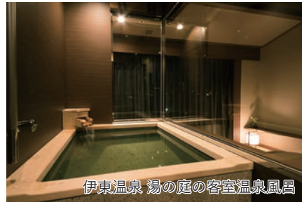
伊東温泉 湯の庭の客室温泉風呂