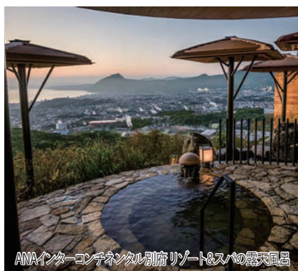
ANAインターコンチネンタル別府リゾート&amp;スパの露天風呂