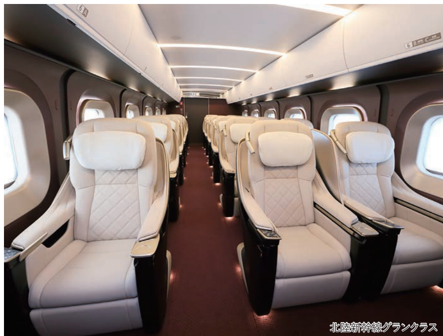
北陸新幹線グランクラス