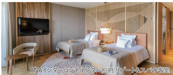
ANAインターコンチネンタル別府リゾート&amp;スパの客室