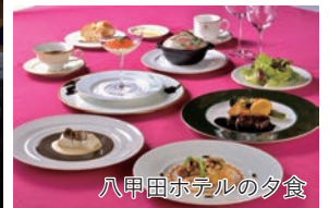
八甲田ホテルの夕食