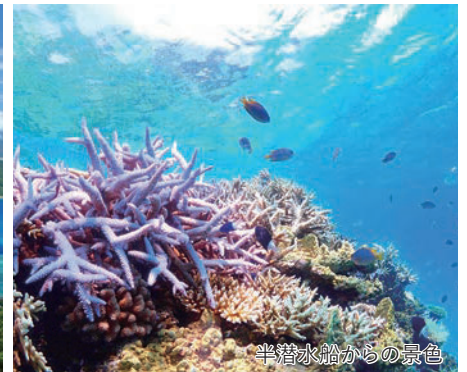
半潜水船からの景色