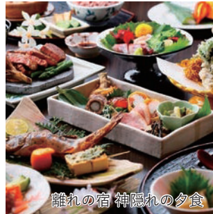
離れの宿 神隠れの夕食