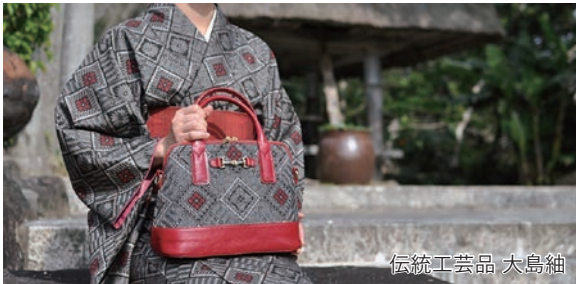
伝統工芸品 大島紬