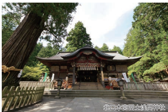
北口本宮富士浅間神社