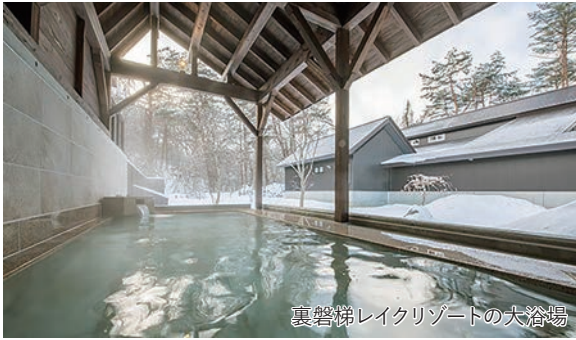
裏磐梯レイクリゾートの大浴場