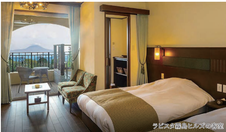
ラピスタ霧島ヒルズの客室