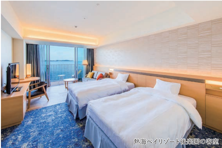
熱海ベイリゾート後楽園の客室