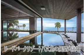
リードパークリゾート八丈島の展望大浴場