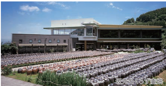
坂元のくろず壺畑