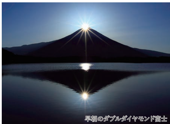
早朝のダブルダイヤモンド富士