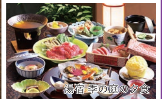
湯宿 季の庭の夕食