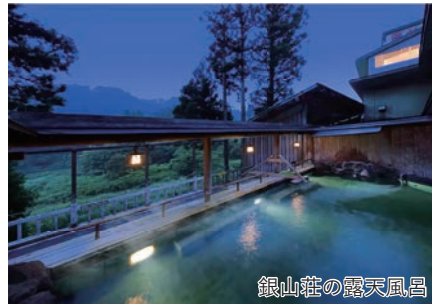
銀山荘の露天風呂