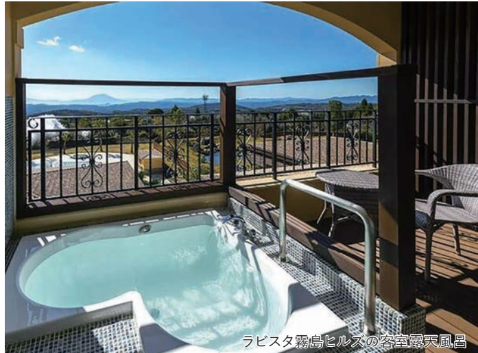
ラピスタ霧島ヒルズの客室露天風呂