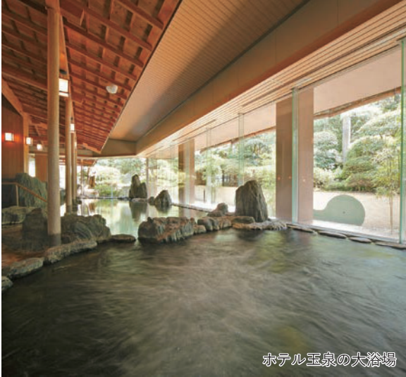
ホテル玉泉の大浴場