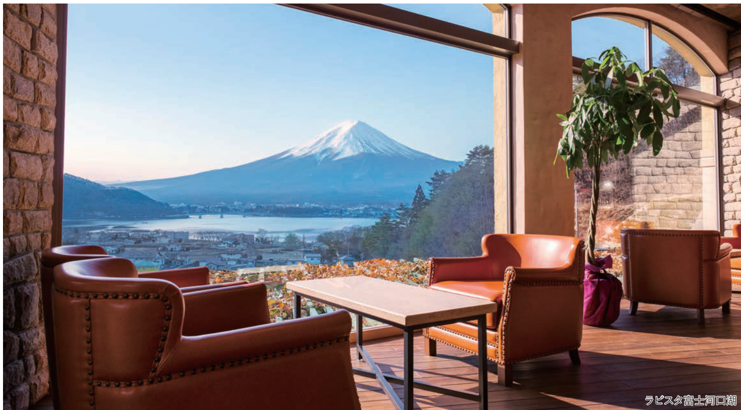
ラビスタ富士河口湖

～新年の幕開けを富士山と共に～ ダイヤモンド富士と初日の出観賞 ラビスタ富士河口湖に泊まる3日間