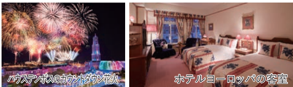
ハウステンボスのカウントダウン花火

◎2022年で開業30周年を迎えるハウステンボスで「 光の王国 」を開催。近隣のゴルフプレーや長崎市内観光のお手配も承ります。