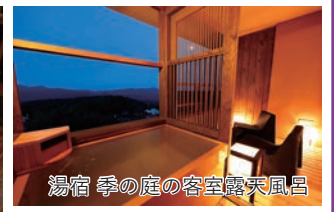
湯宿 季の庭の客室露天風呂