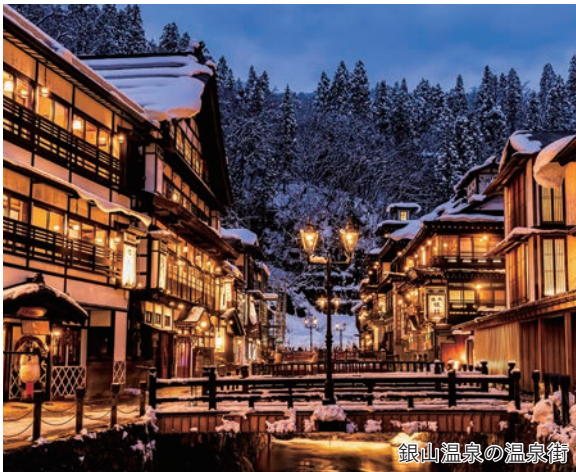
銀山温泉の温泉街