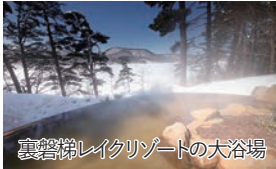
裏磐梯レイクリゾートの大浴場