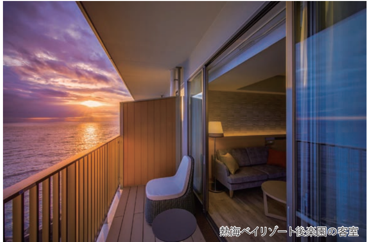
熱海ベイリゾート後楽園の客室