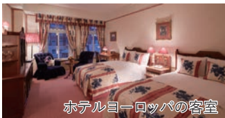
ホテルヨーロッパの客室