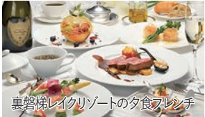
裏磐梯レイクリゾートの夕食フレンチ