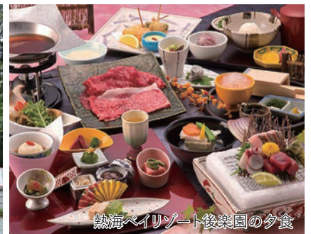
熱海ベイリゾート後楽園の夕食