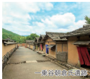
一乗谷朝倉氏遺跡