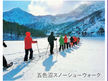
五色沼スノーシューウォーク