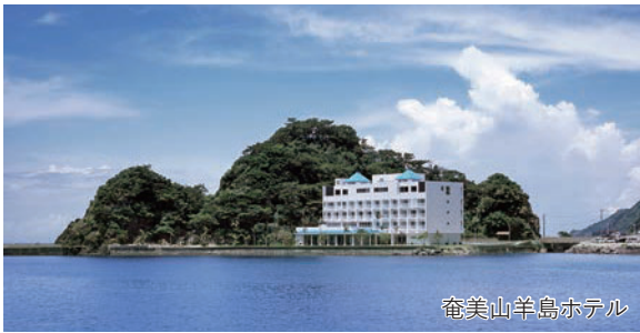
奄美山羊島ホテル