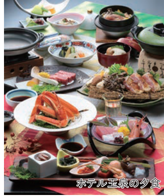
ホテル玉泉の夕食