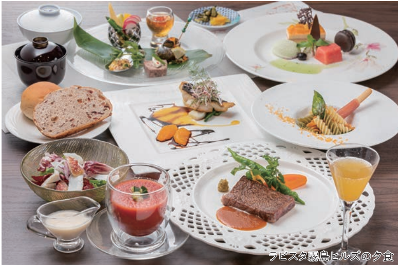
ラピスタ霧島ヒルズの夕食