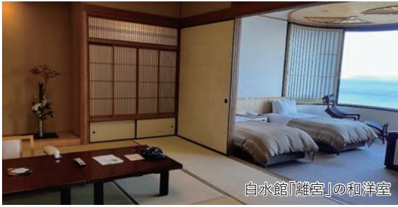
白水館「離宮」の和洋室