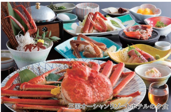
三国オーシャンリゾートホテルの夕食