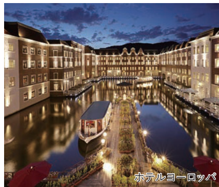
ホテルヨーロッパ