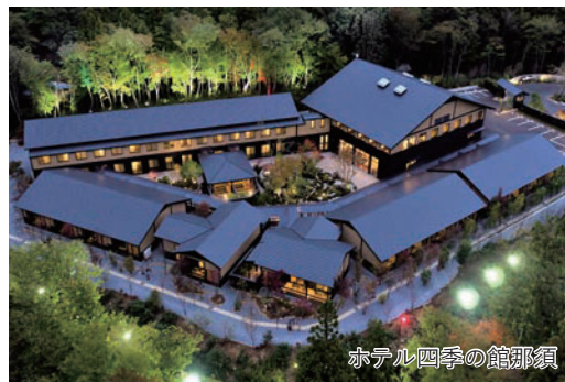
ホテル四季の館那須