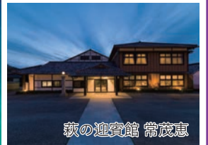
萩の迎賓館 常茂恵