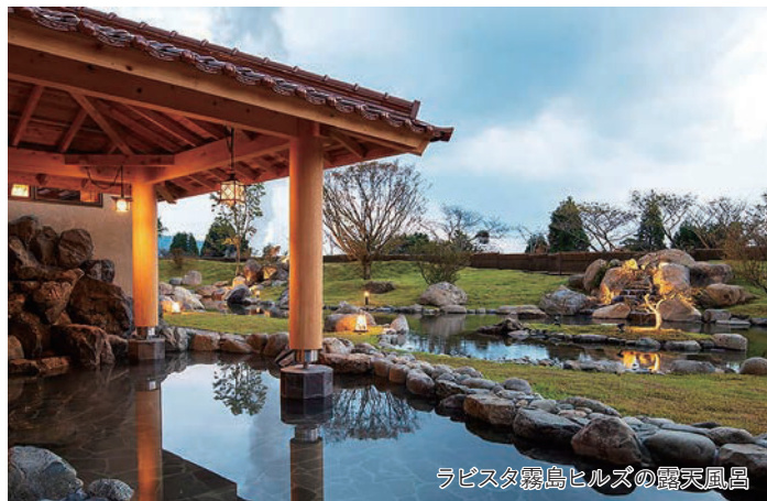
ラピスタ霧島ヒルズの露天風呂