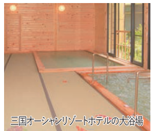
三国オーシャンリゾートホテルの犬湯