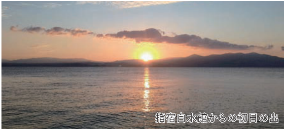
指宿白水館からの初日の出