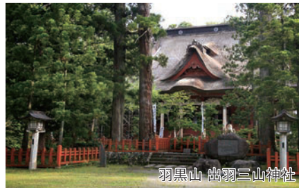
羽黒山 出羽三山神社