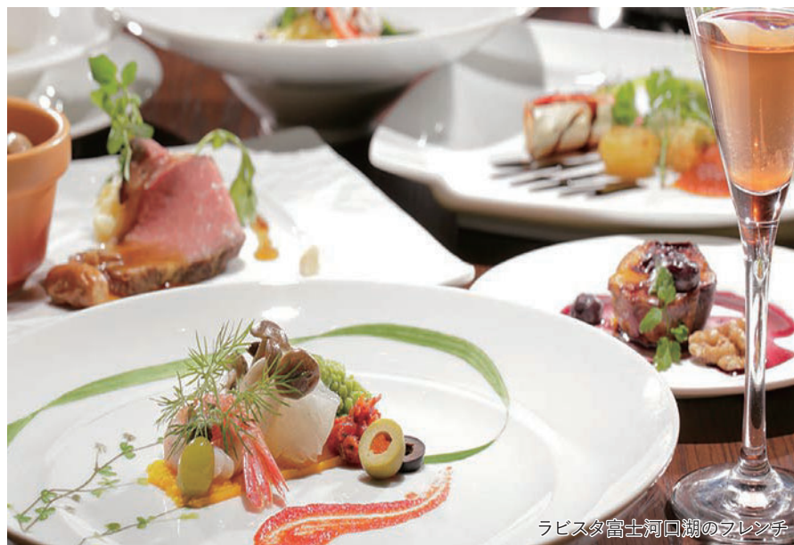
ラビスタ富士河口湖のフレンチ