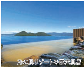
乃の風リゾートの露天風呂