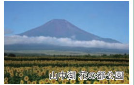
山中湖 花の都公園