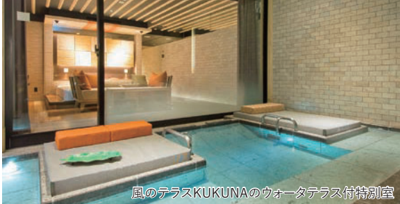
風のテラスKUKUNAのウォーターテラス付特別室