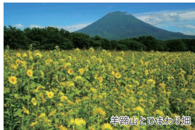
羊蹄山とひまわり畑