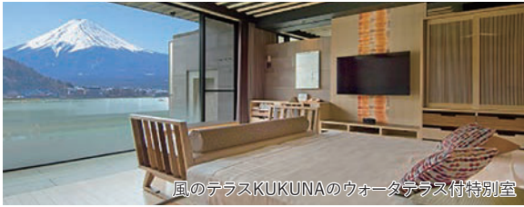
風のテラスKUKUNAのウォーターテラス付特別室