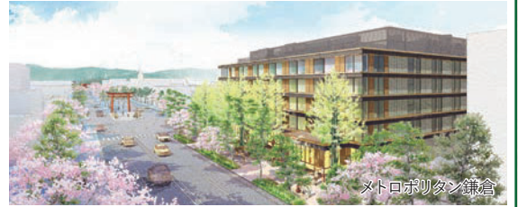
メトロポリタン鎌倉