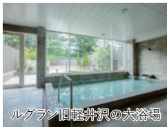
ルグラン旧軽井沢の大浴場

旅のPoint ◎旧軽井沢銀座まで徒歩6分という好立地に佇む、ルグラン旧軽井沢ホテルに連泊します。自然に囲まれたクラシカルな雰囲気、ゆっくりとお寛ぎいただけます。また、信州美食フレンチのご夕食や軽井沢エリアでは珍しい温湯施設(大浴場)もお楽しみください。 ◎非公開エリアをご覧いただけるワイナリー見学&試飲のほか、セゾン現代美術館や歴史に触れる懐古園など、軽井沢旅のコンシェルジュと巡る大人の軽井沢プレミアムツアーへご案内いたします。