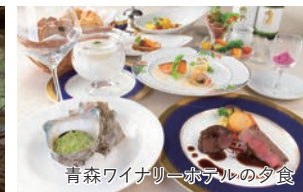
青森ワイナリーホテルの夕食