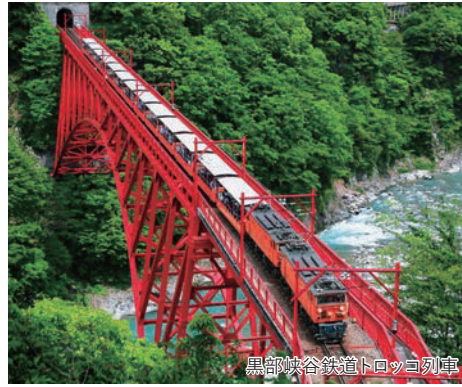
黒部峡谷鉄道トロッコ列車