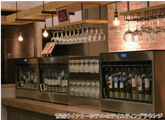
青森ワイナリーホテルのテイスティングラウンジ