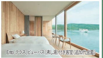
Ento テラス、ビューバス(沸し湯)付き客室(追加代金)