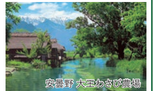
安曇野 大王わさび農場