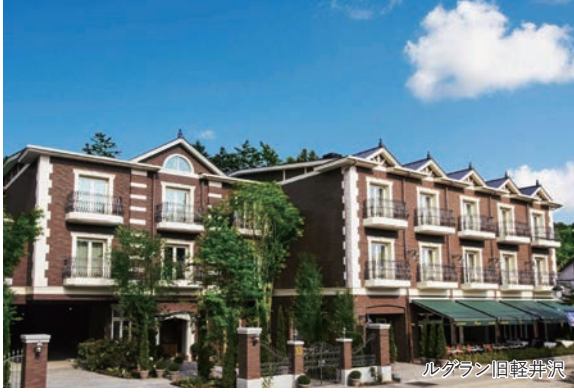
ルグラン旧軽井沢