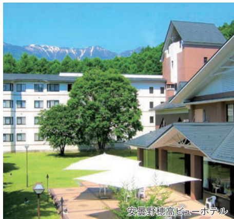
安曇野穂高ビューホテル