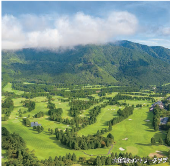
大箱根カントリークラブ