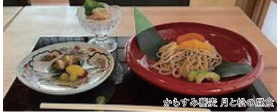
からすみ蕎麦 月と松の昼食