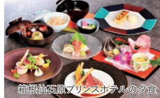
箱根仙石原プリンスホテルの夕食