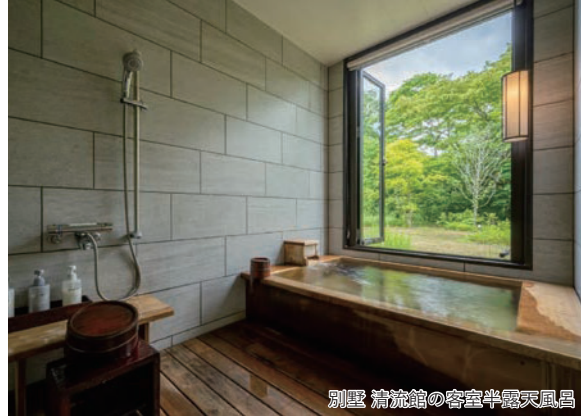
別荘 清流館の客室半露天風呂