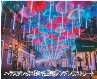
ハウステンボス「光の王国」アンブレラストリート