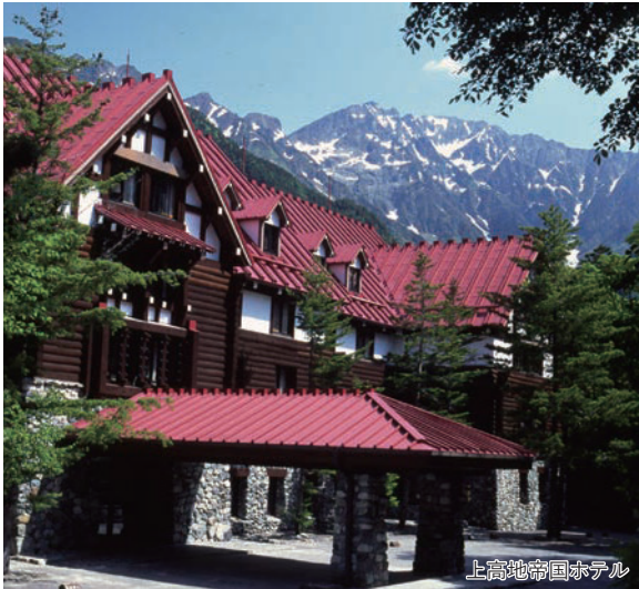
上高地帝国ホテル