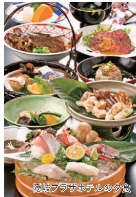
隠岐プラザホテルの夕食