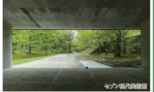
セゾン現代美術館