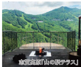
志賀高原「山の駅テラス」