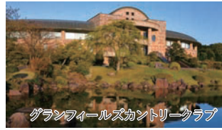
グランフィールズカントリークラブ