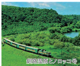
釧路湿原とノロッコ号