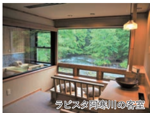
ラピスタ阿寒川の客室