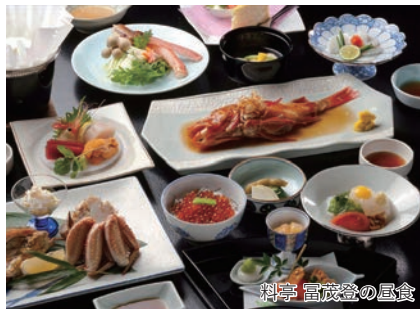
料亭 富茂登の昼食