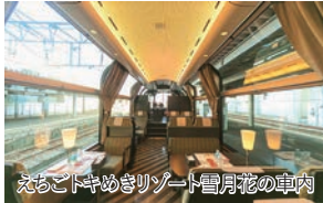
えちごトキめきリゾート雪月花の車内