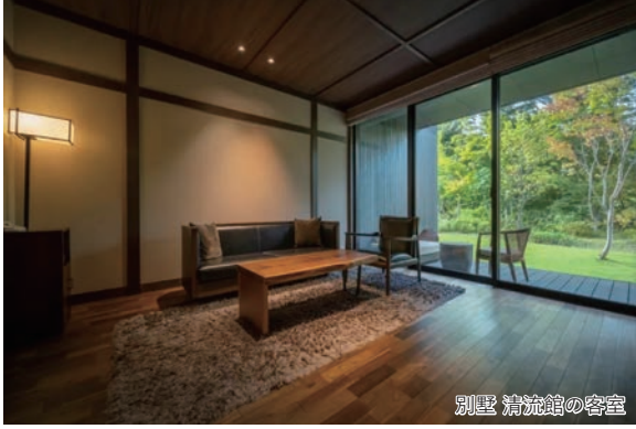
別荘 清流館の客室