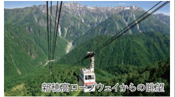
新穂高ロープウェイからの眺望