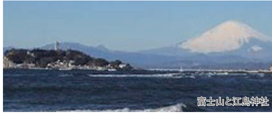
富士山と江島神社