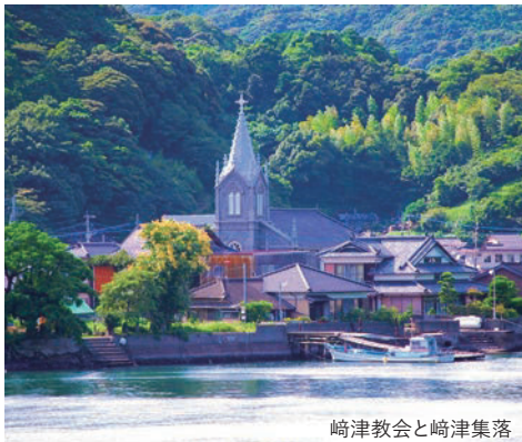
崎津教会と崎津集落