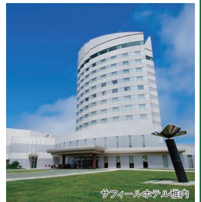
サフィールホテル稚内