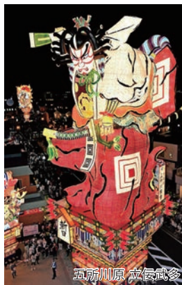
五所川原 立佞武多