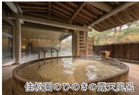
佳松園のひのきの露天風呂