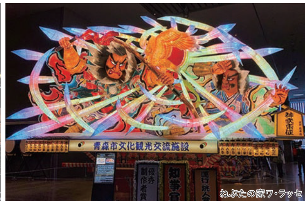
ねぶたの家ワ・ラッセ