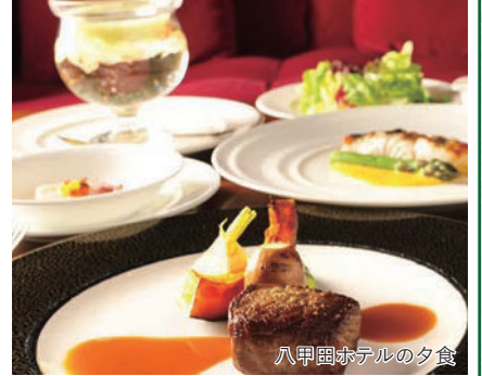
八甲田ホテルの夕食