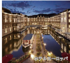
ホテルヨーロッパ