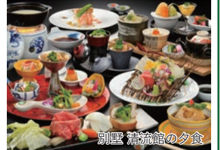
別荘 清流館の夕食