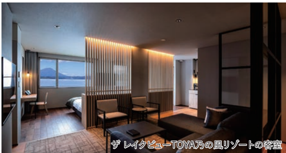
ザレイクビューTOYA乃の風リゾートの客室