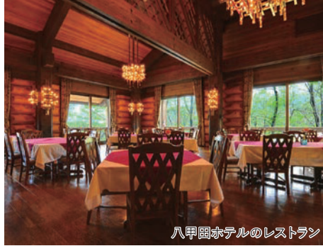
八甲田ホテルのレストラン