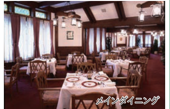
メインダイニング