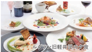
ルグラン旧軽井沢の夕食