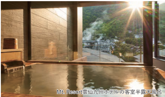
Mt. Resort雲仙九州ホテルの客室半露天風呂