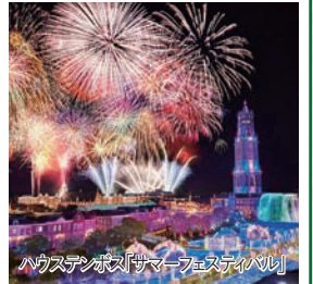
ハウステンボス「サマーフェスティバル」