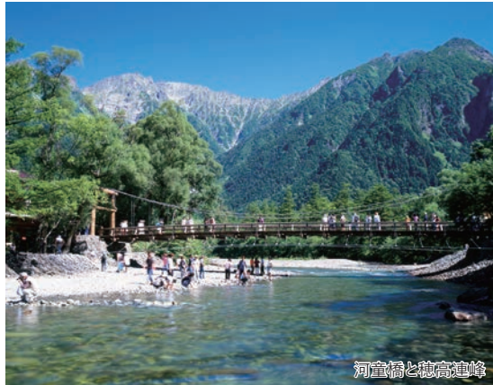
河童橋と穂高連峰