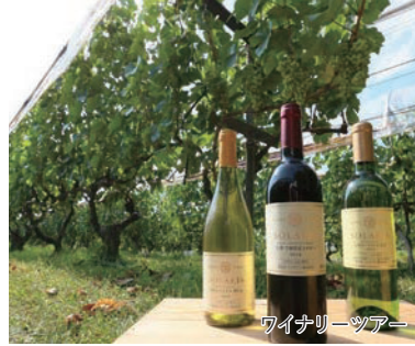
ワイナリーツアー