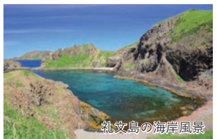
礼文島の海岸風景