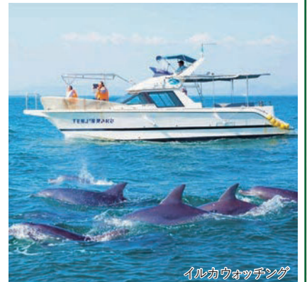
イルカウォッチング