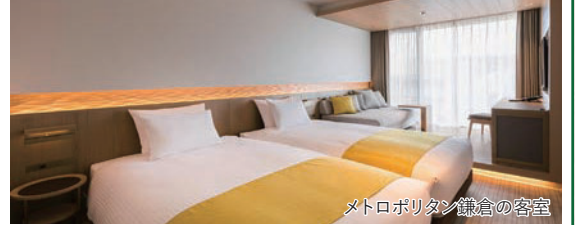
メトロポリタン鎌倉の客室