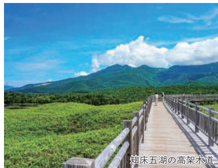
知床五湖の高架木道