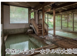
青森ワイナリーホテルの大浴場