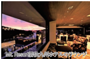
Mt. Resort雲仙九州ホテルのラウンジ