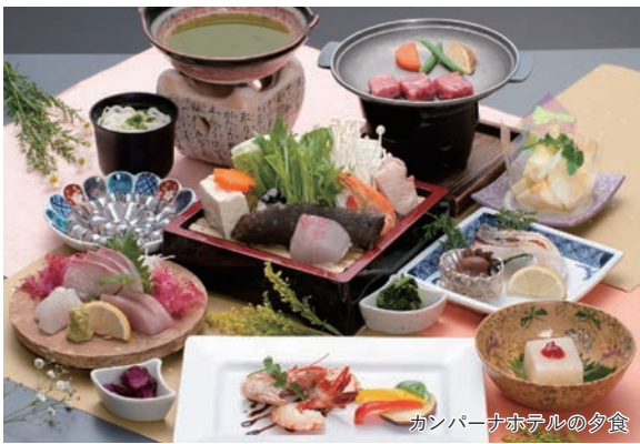
カンパーナホテルの夕食

～NHK朝ドラ「舞い上がれ」の舞台となった秘島～ 青く澄んだ海と手つかずの自然、異国文化漂う長崎五島3日間