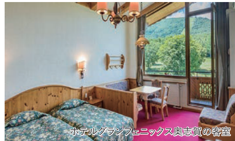
ホテルグランフェニックス奥志賀の客室