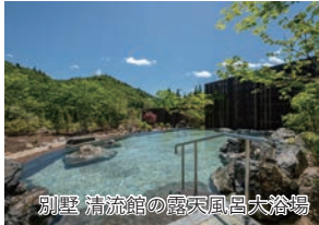
別荘 清流館の露天風呂大浴場