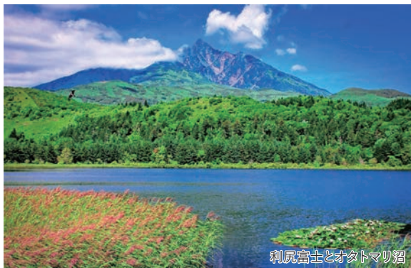
利尻富士とオタマリ沼