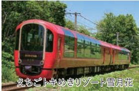
えちごトキめきリゾート雪月花