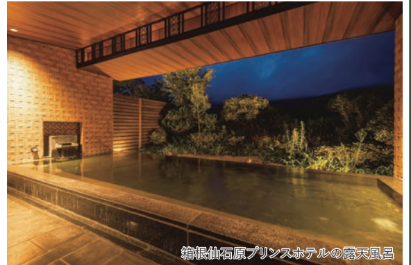
箱根仙石原プリンスホテルの露天風呂