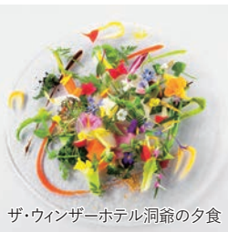
ザ・ウィンザーホテル洞爺の夕食