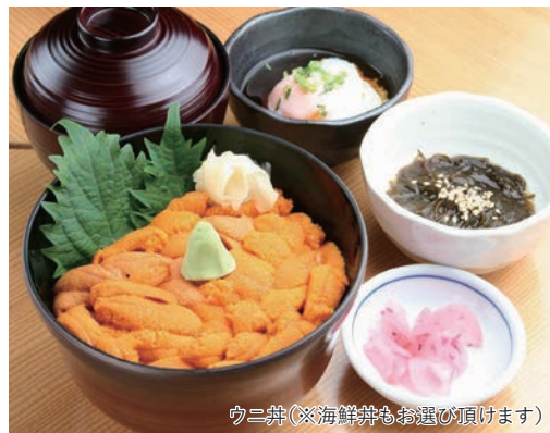
ウニ丼(※海鮮丼もお選び頂けます)