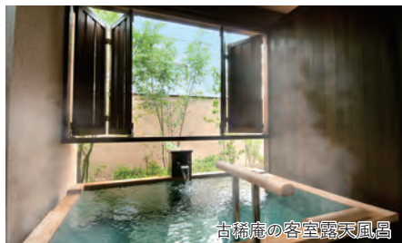
古稀庵の客室露天風呂