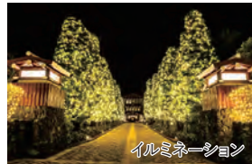
イルミネーション