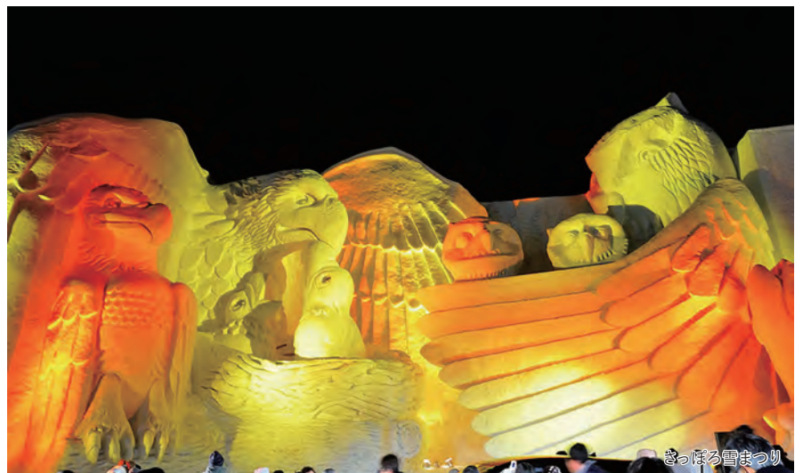
さっぽろ雪まつり