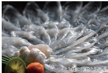
角上楼の天然とらふぐ