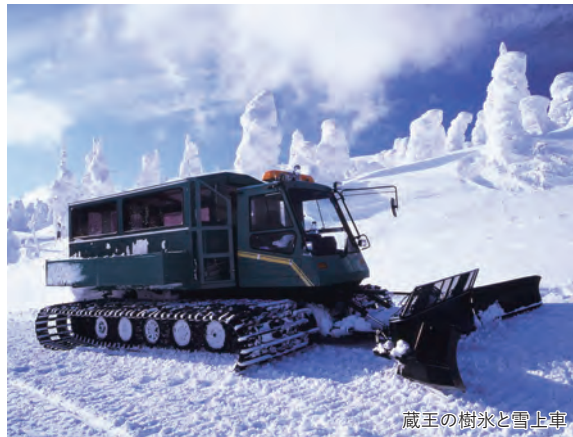
蔵王の樹氷と雪上車