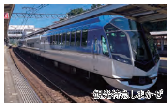
観光特急しまかぜ