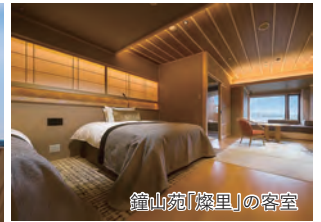
鐘山苑「燦里」の客室