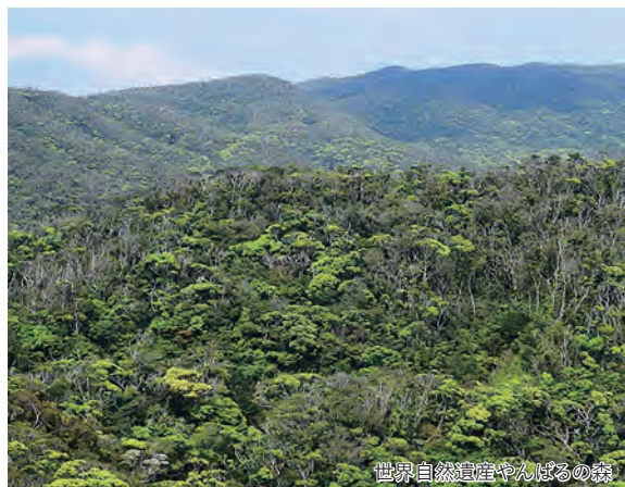
世界自然遺産やんばるの森