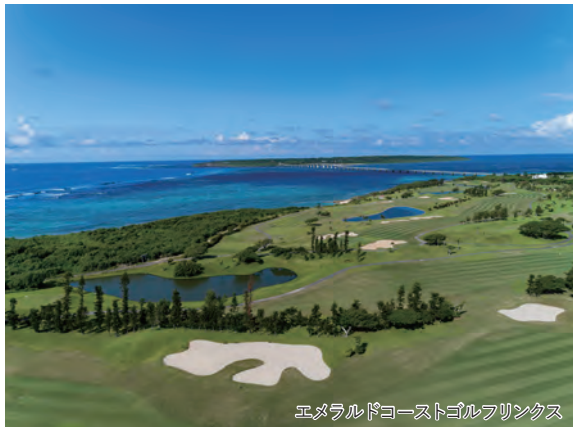
エメラルドコーストゴルフリンクス