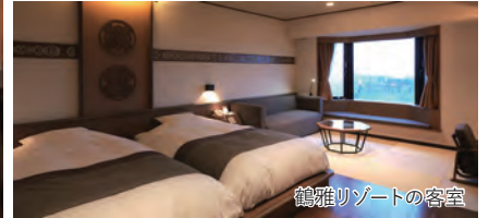
鶴雅リゾートの客室