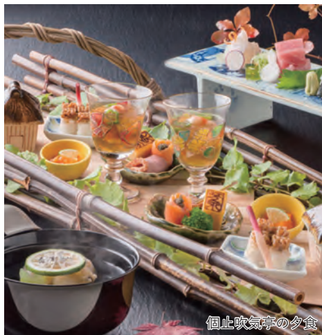
個止吹気亭の夕食