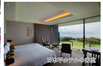
日本平ホテルの客室