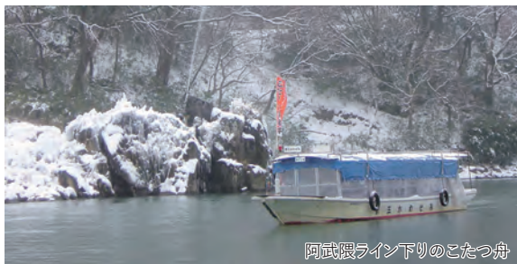
阿武隈ライン下りのこたつ舟