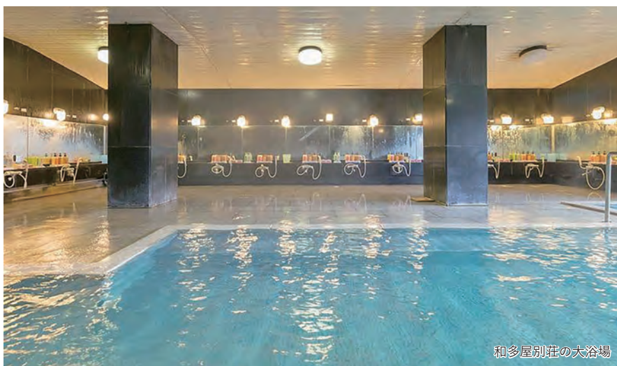
和多屋別荘の大浴場