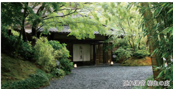
隠れ湯宿 柳生の庄