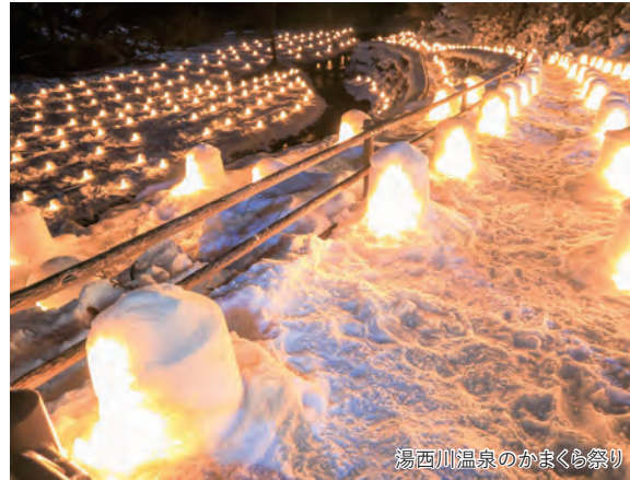
湯西川温泉のかまくら祭り