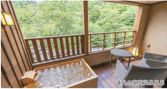
蓮月の客室温泉風呂