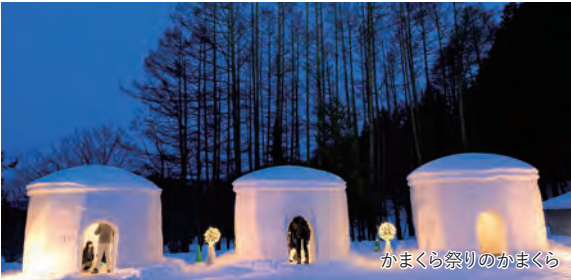
かまくら祭りのかまくら