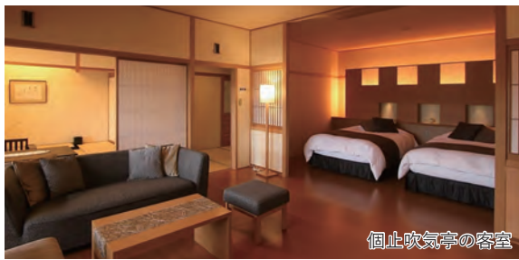
個止吹気亭の客室

～食材の宝庫・若狭の冬の味覚と全16室の特別スイート「 ことぶきてい 個止吹気亭」～ 「若狭ふぐ」と「若狭牛」の競演・冬の越前グルメと芦原温泉2日間