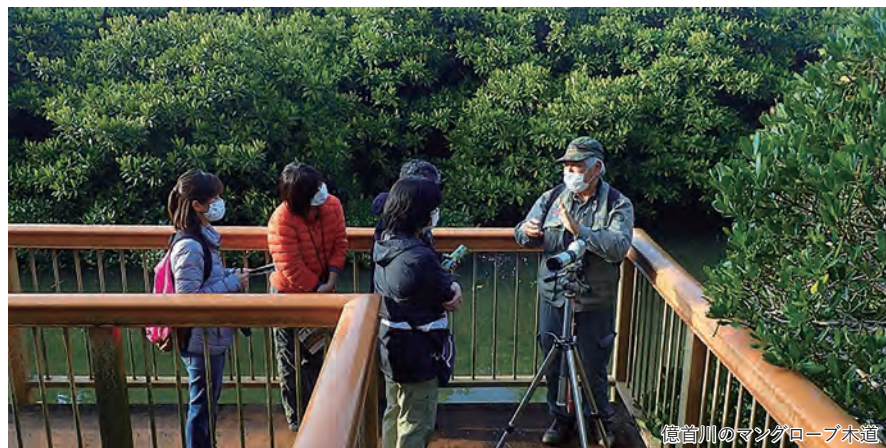
億首川のマングローブ木道