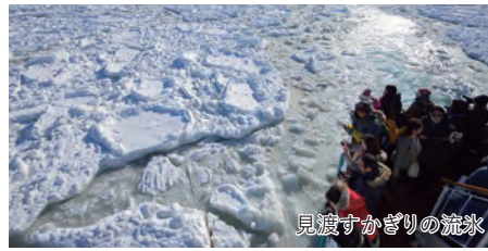
見渡すかぎりの流氷