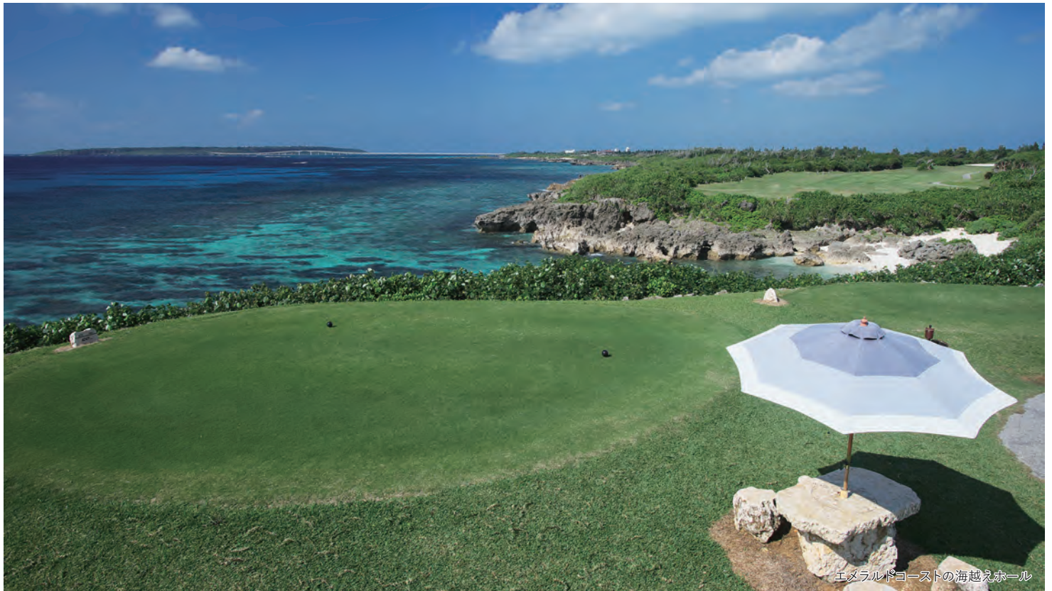
エメラルドコーストの海越えホール

～平均20°C 2サム possibleのプライベートゴルフとリゾートホテルで過ごす～ 美らリゾート・海越えにチャレンジ宮古島ゴルフ&フリープラン3日間