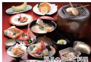
松月の白エビ料理