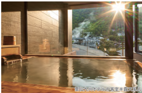
雲仙九州ホテルの客室半露天風呂