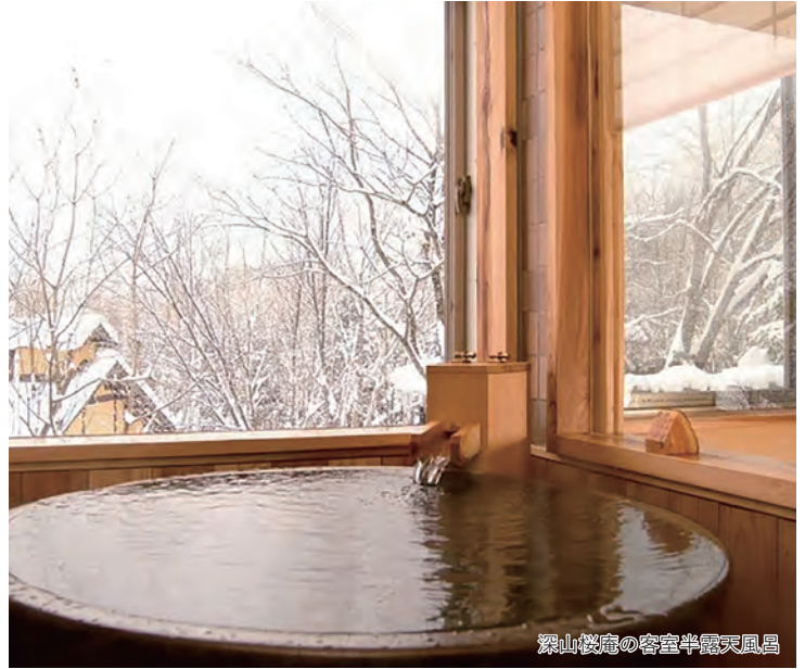
深山桜庵の客室半露天風呂