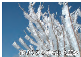
花ぼうろと呼ばれる霧氷