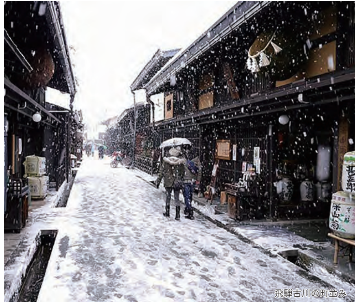
飛騨古川の町並み