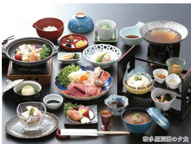
和多屋別荘の夕食