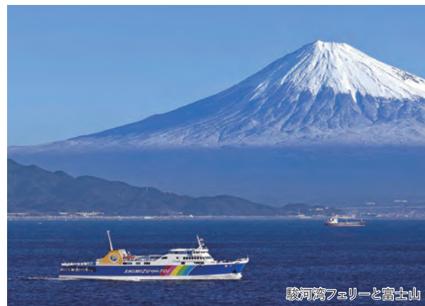
駿河湾フェリーと富士山