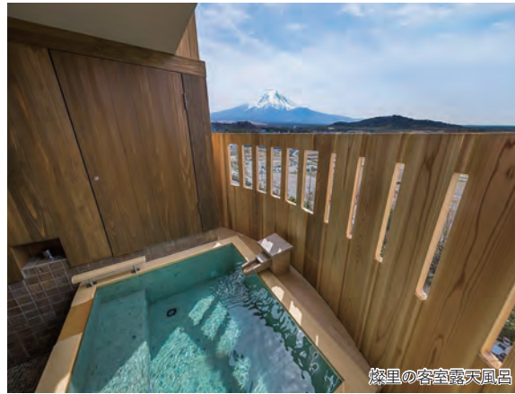
燦里の客室露天風呂