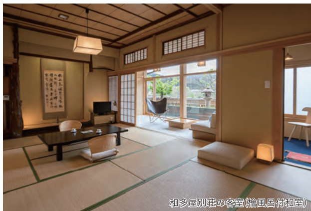
和多屋別荘の客室(繪風呂付和室)