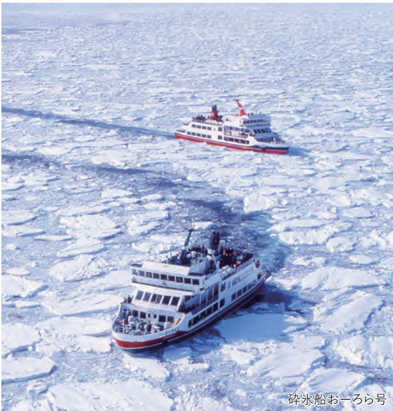
砕氷船おーろら号