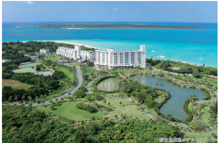
宮古島東急ホテル&amp;リゾート