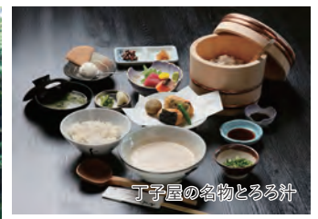
丁子屋の名物とろろ汁