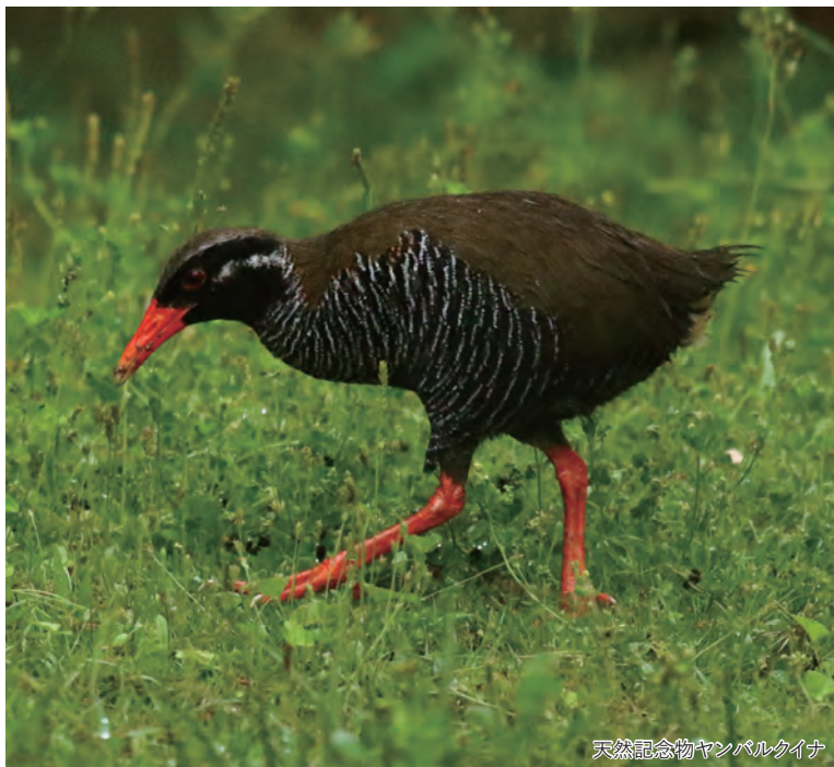
天然記念物ヤンバルクイナ