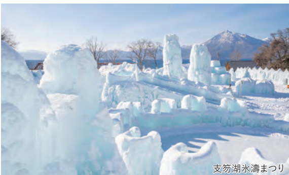
支笏湖水濤まつり