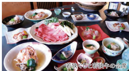
若狭ぐじと若狭牛の会席