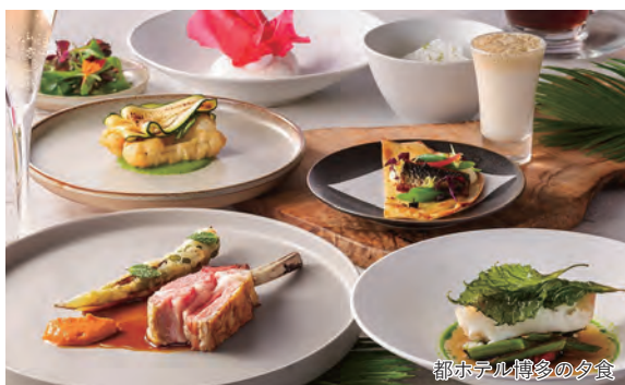
都ホテル博多の夕食