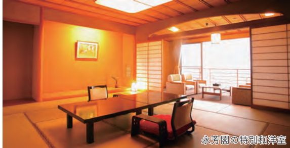
永芳閣の特別和洋室

旅のPoint ◎全てのお部屋から富山湾を一望できる「永芳閣」にご宿泊。ツインベッドルームが付いた二間構成の特別客室をご用意いたしました。ご夕食は、脂の乗った天然ぶりや富山湾の幸を存分にお楽しみいただけます。 ◎まるで水墨画のような「庄川遊覧船」や富山湾の奇跡「雨晴海岸」など、冬の絶景をお楽しみください。 ◎「のどぐろ御膳」や老舗磯料理「松月」で「白エビ」のご昼食など、北陸・富山湾のグルメをご堪能下さい。