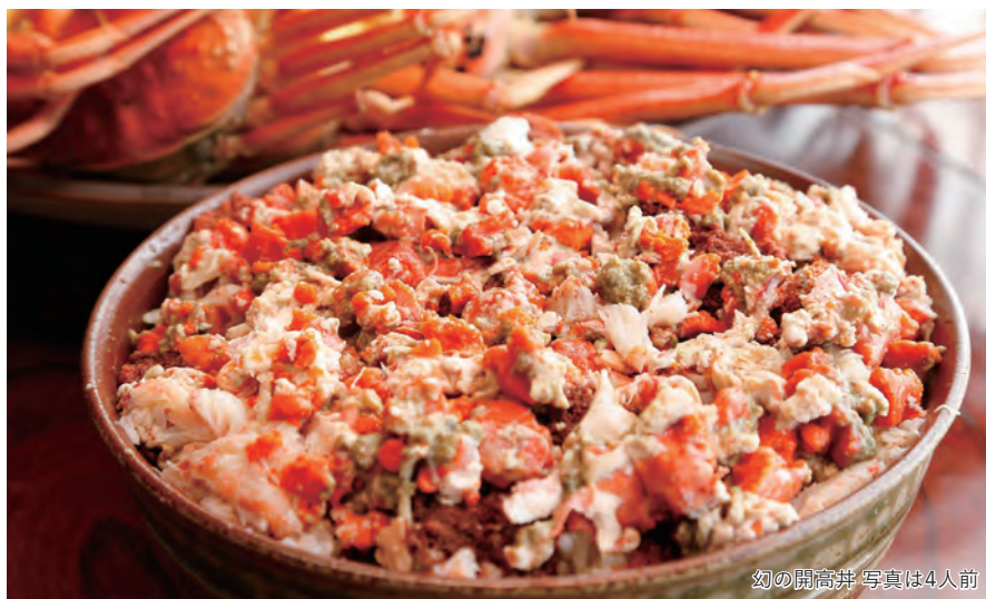
幻の開高丼 写真は4人前

旅のPoint ◎雌のズワイガニ(せいこがに)の漁期に合わせて提供される海の宝石箱「開高井」。資源保護のため漁期の50日間しか味わえない希少なグルメです。芥川賞作家の開高健氏が絶賛し名付けた、一度は食べたい究極の冬の味覚をお楽しみください。予約困難の希少グルメですが、特別に旬の越前がにを使った懐石料理と併せて、開高井(1人前)をお召し上がりいただけます。