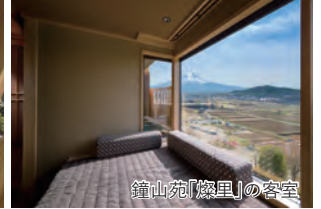
鐘山苑「燦里」の客室