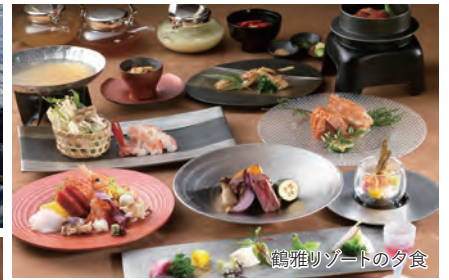
鶴雅リゾートの夕食