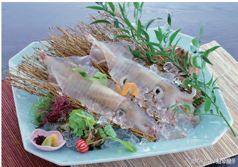
呼子イカの活き造り