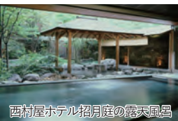
西村屋ホテル招月庭の露天風呂