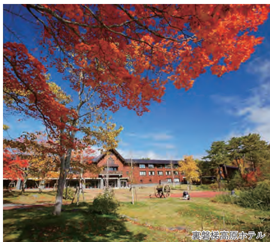
裏磐梯高原ホテル