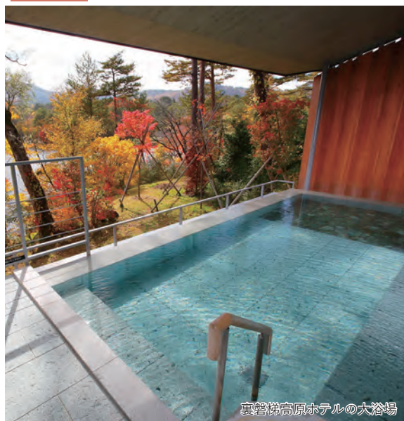
裏磐梯高原ホテルの大浴場

～大自然に抱かれた高原リゾートで至福のひとつとき～ 雄大な磐梯山を望む高級温泉リゾート「裏磐梯高原ホテル」2日間