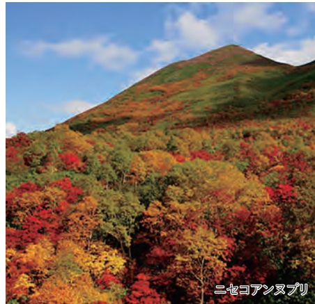
ニセコアンヌプリ