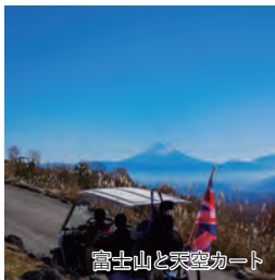
富士山と天空カート