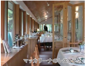
マッカリーナのレストラン