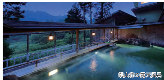
銀山荘の露天風呂