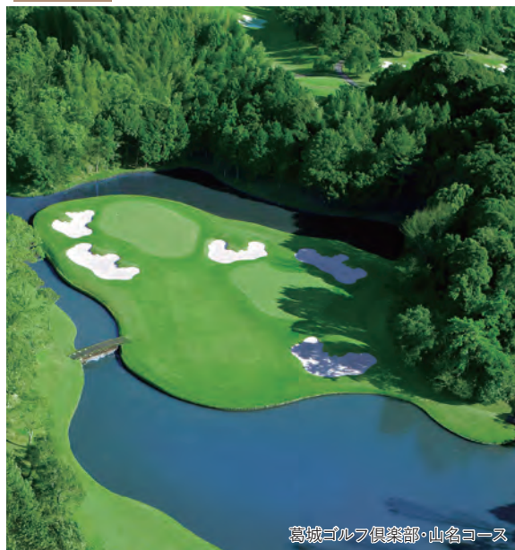
葛城ゴルフ倶楽部・山名コース