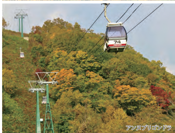
アンヌプリゴンドラ