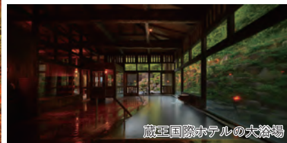
蔵王国際ホテルの大浴場