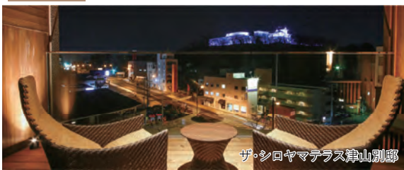
ザ・シロヤマテラス津山別邸