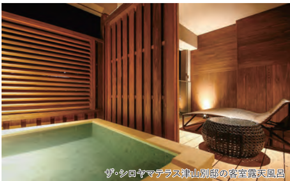
ザ・シロヤマテラス津山別邸の客室露天風呂