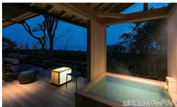
露天風呂付ドッグヴィラ