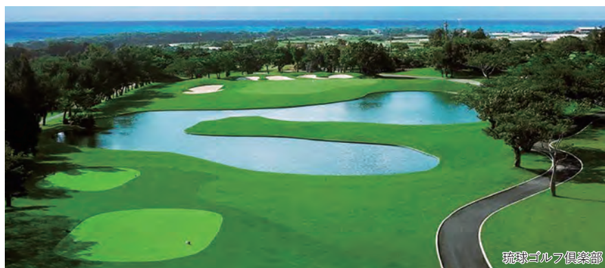
琉球ゴルフ倶楽部