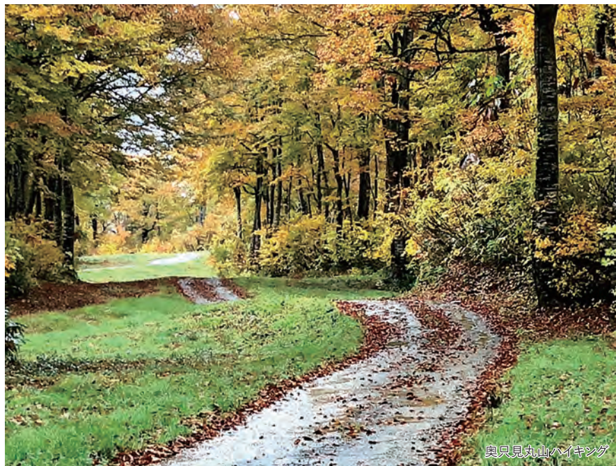
奥只見丸山ハイキング

旅のPoint ◎2時間程で登れる奥只見丸山の山頂(標高1,242m)からは、眼下に広がる日本最大級の貯水量を誇る巨大ダム奥只見湖、日本百名山 燧ヶ岳・平ヶ岳、二百名山 荒沢岳・末丈ヶ岳などの素晴らしい風景が一望できます。許可なしでは入れない絶景ハイキングコースをネイチャーガイドがご案内いたします。