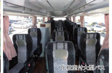
化粧室付大型バス