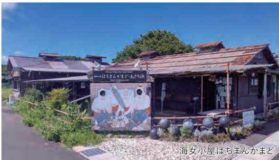
海女小屋はちまんかまど

旅のPoint ◎海女に出会える町・鳥羽市相差(おうさつ)では海女漁の話や踊りを楽しみ、海女さんが目の前のカマドで新鮮な魚介類を手焼きしてくれます。 ◎3列独立シート・化粧室付大型バスにてゆっくり快適にお過ごしいただけます。