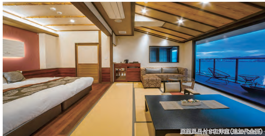
展望風呂付き和洋室(追加代金別)