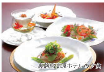
裏磐梯高原ホテルの夕食