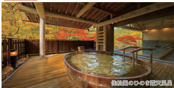
佳松園のひのき露天風呂

～紅葉と温泉・グルメを満喫する「黄金の国・岩手」～ 紅葉ベストシーズンに行く絶景スポット「厳美渓・中尊寺」2日間