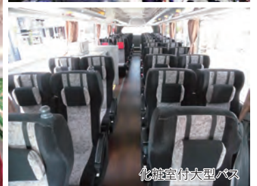
化粧室付大型バス