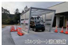
ゴルフカート消毒設備