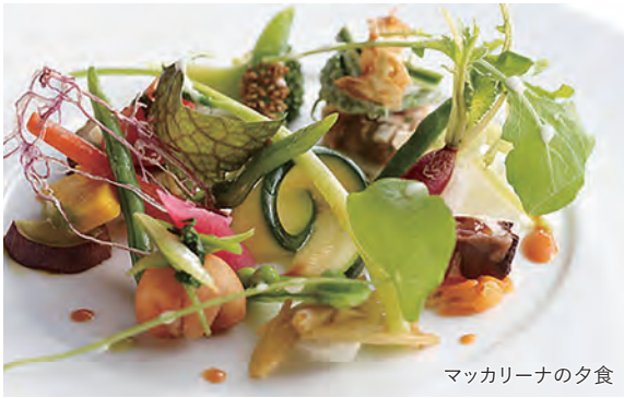
マッカリーナの夕食