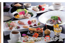
海のホテル島花の夕食