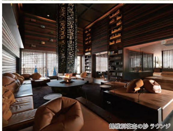
鶴雅別荘 奎の抄 ラウンジ