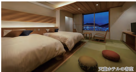
天童ホテルの客室