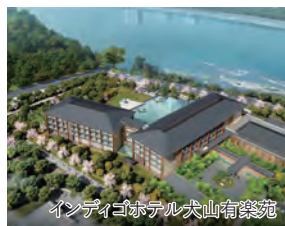
インディゴホテル犬山有楽苑