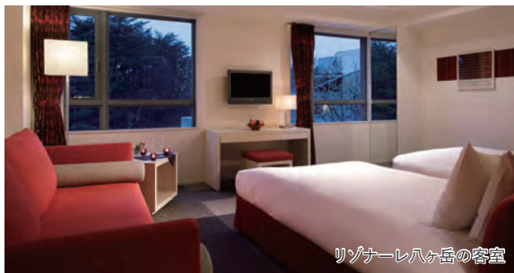
リゾナーレ八ヶ岳の客室

～紅葉のベストシーズンに行く圧巻の紅葉スポットと癒しのリゾートグルメ旅～ 秋の絶景「八ヶ岳高原」と憧れの星野リゾート「リゾナーレ八ヶ岳」2日間