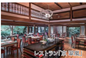
レストラン「京 翠嵐」