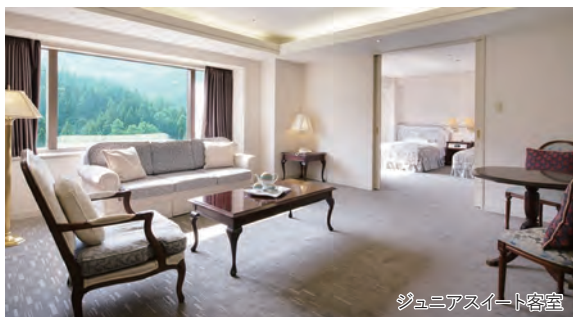
ジュニアスイート客室