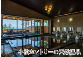
小松カントリーの天然温泉

旅のPoint ◎料理旅館「浅田屋」は加賀百万石の前田家とも縁があり、能登や七尾湾など石川県の食材を中心に贅沢な加賀会席が味わえます。 ◎50年前から数々のトーナメントを開催してきた「能登カントリークラブ」、日本男子プロトーナメント「コマツオープン」が16年連続開催されるコース「小松カントリークラブ」での贅沢な組み合わせ。両方共に温泉大浴場がある珍しいゴルフ場です。