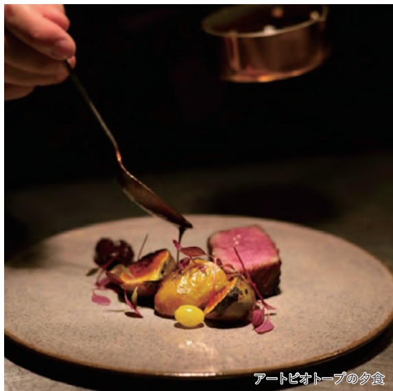
アートビオトープの夕食