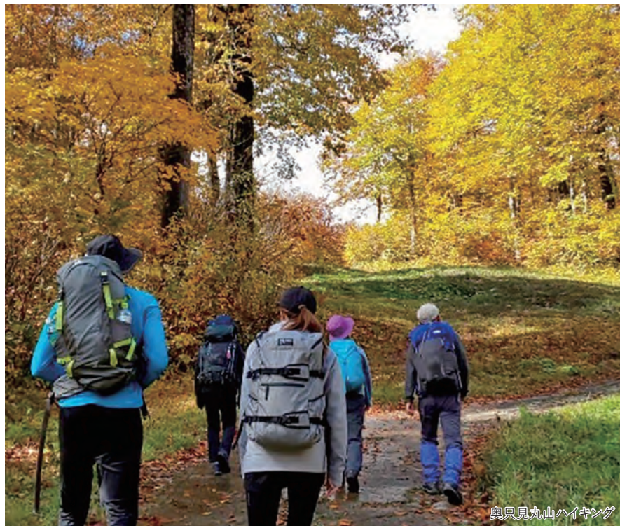
奥只見丸山ハイキング