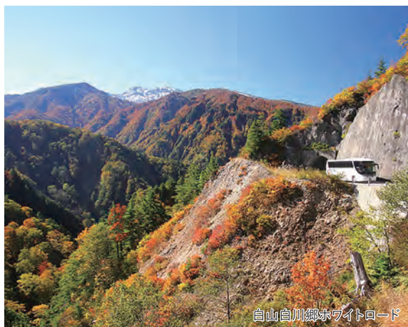
白山白川郷ホワイトロード