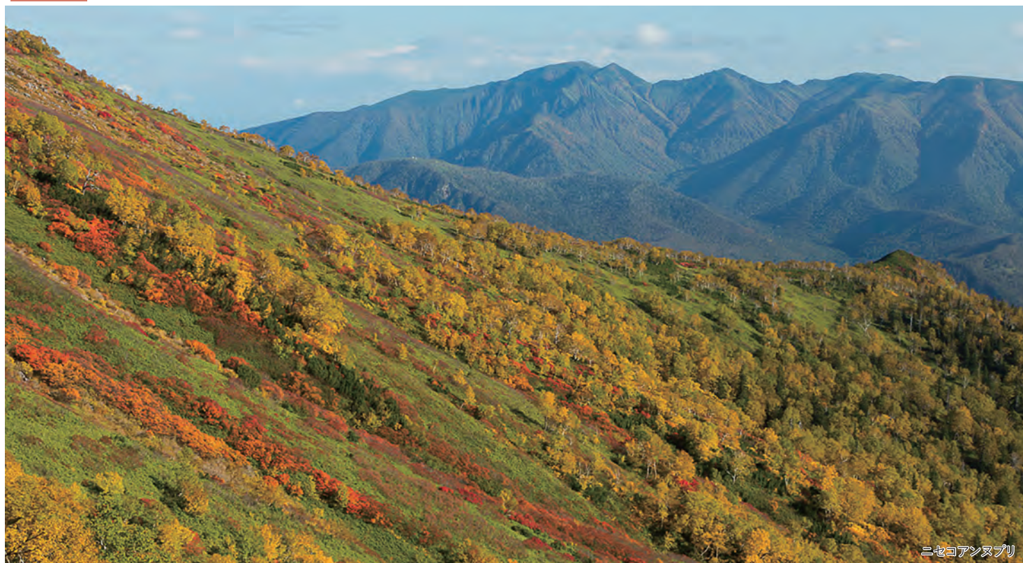
ニセコアンヌプリ