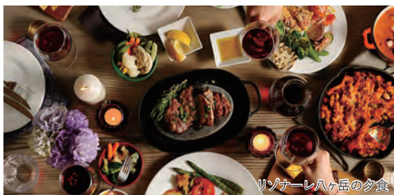
リゾナーレ八ヶ岳の夕食

旅のPoint ◎雄大な八ヶ岳を背景に、色づく渓谷と黄色い橋が調和する「八ヶ岳高原大橋」と辺り一面に広がる圧巻の紅葉風景をご覧ください。 ◎自然の恵みを堪能し、リゾート気分を楽しめる星野リゾート リゾナーレ八ヶ岳にご宿泊。 ◎お食事は、旬の食材を使用した洋食をお好きに楽しめる星野リゾート自慢のディナービュッフェやシェフのオリジナル八ヶ岳フレンチが味わえる「ル・ビオニエ」で頂くランチコースをご用意しております。