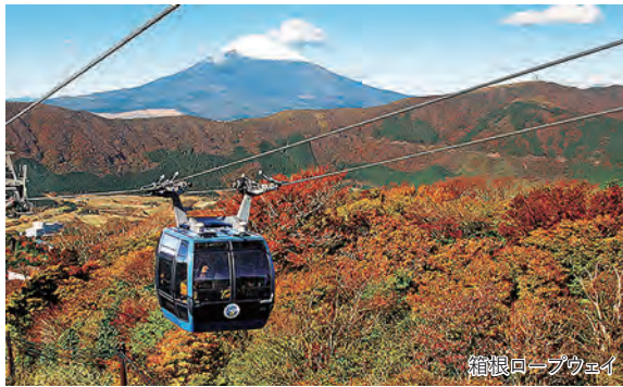
箱根ロープウェイ