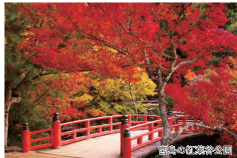
宮島の紅葉谷公園