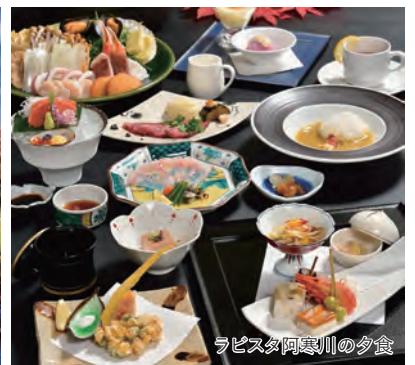
ラピスタ阿寒川の夕食