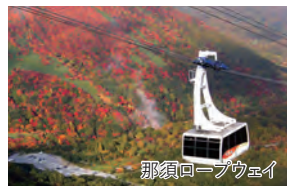
那須ロープウェイ