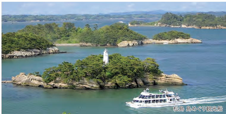
松島 島めぐり観光船