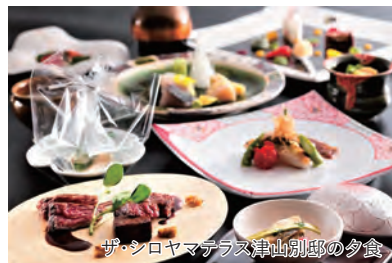
ザ・シロヤマテラス津山別邸の夕食