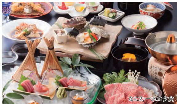
なにわー水の夕食

～威風堂々の松江城、小泉八雲が愛した景色、日本美の足立美術館を訪ねて～ 宍道湖を眺望する寛ぎの温泉宿と神々が集う「出雲大社」2日間