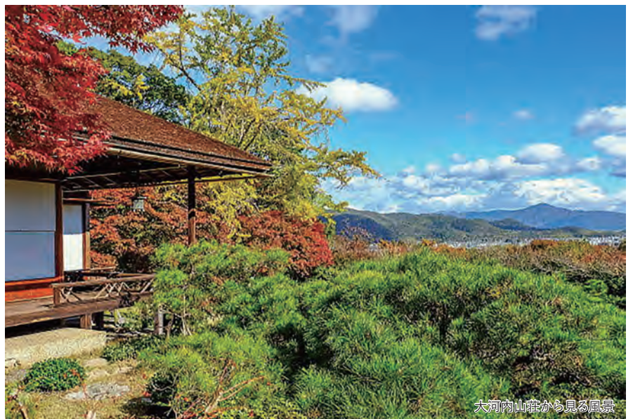
大河内山荘から見る風景