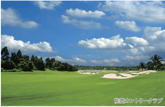
能登カントリークラブ

～石川県を代表する名門2コースと粋なお料理を味わう～ 北陸屈指のトーナメントコースと「浅田屋」でいただく極上の加賀料理3日間