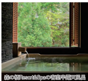
森の栖Resort&amp;Spaの客室半露天風呂