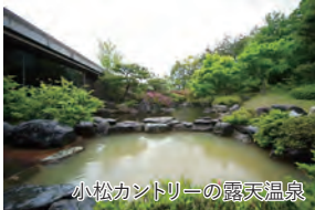
小松カントリーの露天温泉