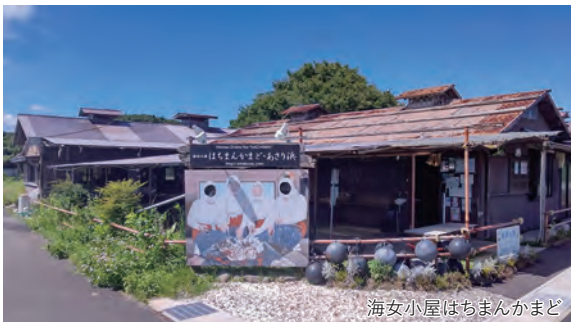
海女小屋はちまんかまど

旅のPoint ◎海女に出会える町・鳥羽市相差(おうさつ)では海女漁の話や踊りを楽しみ、海女さんが目の前のカマドで新鮮な魚介類を手焼きしてくれます。決して飾らないお店ですが、鮮度抜群です。 ◎化粧室付大型バスにてゆっくり快適にお過ごしいただけます。