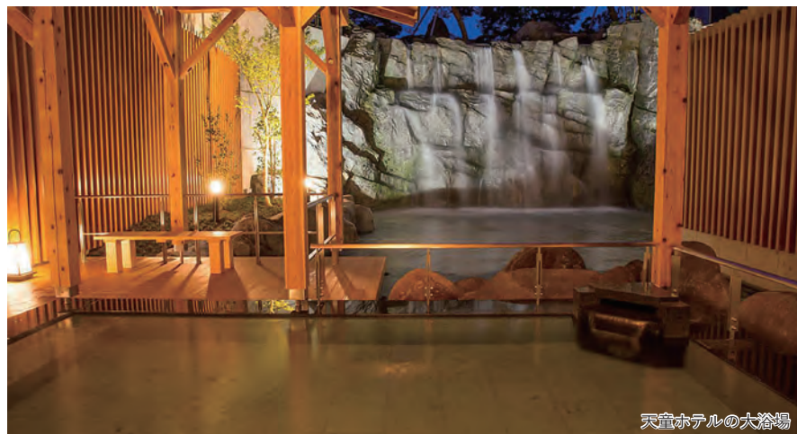
天童ホテルの大浴場