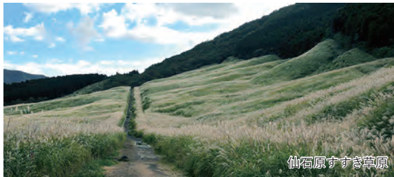
仙石原すすき草原