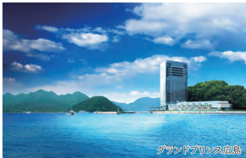
グランドプリンス広島