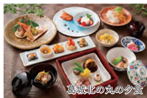
葛城北の丸の夕食