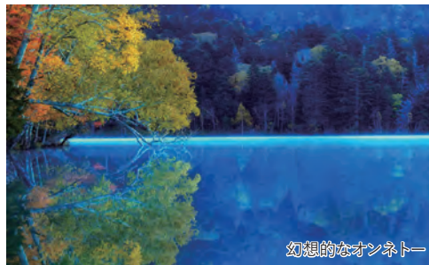
幻想的なオンネトー