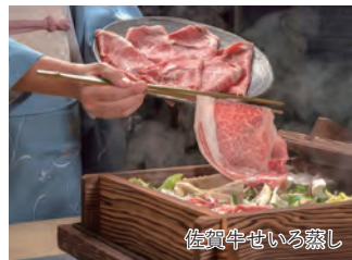
佐賀牛せいろ蒸し