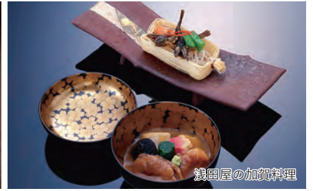
浅田屋の加賀料理