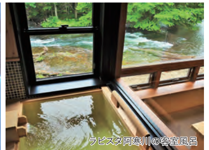
ラピスタ阿寒川の窓室風呂