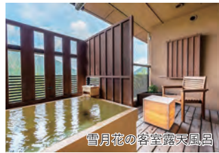
雪月花の客室露天風呂