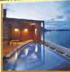
「鷗風亭」屋上展望露天風呂(波の湯)

旅行期間 2020年5月3日(日)~5日(火・祝) 旅行代金 お一人様 218,000円 (2名様1室) ※新大阪駅発着以外ご希望の場合は、お問い合わせください。 募集人数 12名(最少催行人数10名) 添乗員 同行いたします 交通機関 JR【普通指定席・禁煙車】 現地貸切バス(運行バス会社:福山観光バス・奥道後交通) 宿泊施設 鞆の浦/鷗風亭(最上階プレミアムツイン) 道後温泉/道後御湯(露天風呂付和洋室)