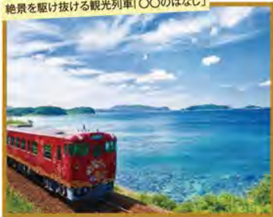
絶景を駆け抜ける観光列車「〇〇のはなし」

旅行期間 2020年5月3日(日)~5日(火・祝) 旅行代金 お一人様 198,000円 (2名様1室) ※新大阪駅発着以外ご希望の場合は、お問い合わせください。 募集人数 14名(最少催行人数10名) 添乗員 同行いたします 交通機関 JR新幹線【グリーン席・禁煙車】 現地貸切バス(運行バス会社:新下関観光バス) 宿泊施設 下関温泉/ホテル風の海(温泉展望風呂付洋室・連泊)