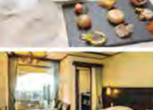
ラピスタ霧島ヒルズ露天風呂付客室

旅行期間 2020年5月3日(日)~5日(火・祝) 旅行代金 お一人様 189,000円 (2名様1室) ※新大阪駅発着以外ご希望の場合は、お問い合わせください。 募集人数 16名(最少催行人数10名) 添乗員 同行いたします 交通機関 JR九州新幹線・肥薩おれんじ鉄道【普通指定席・禁煙車】 現地貸切バス(運行バス会社:託摩観光) 宿泊施設 熊本市内/ザ・ニューホテル熊本(洋室) 霧島温泉/ラピスタ霧島ヒルズ(露天風呂付洋室)