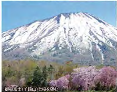
蝦夷富士(羊蹄山)と桜を望む