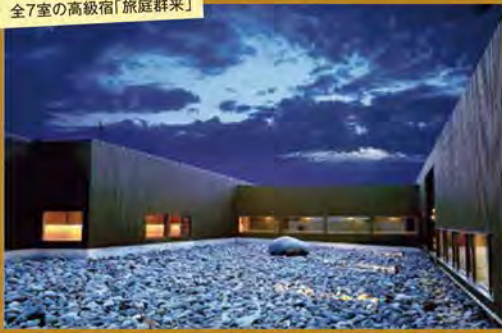
全7室の高級宿「旅庭群来」

～ニューオープンの宿と北のグルメを堪能～ 一度は泊まりたい全7室の「旅庭群来」と森林リゾートに泊まる道南グルメ紀行 3日間