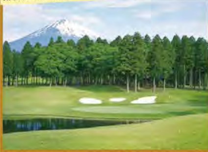
太平洋クラブ御殿場コース18番コース

旅行期間 2020年5月3日(日)~5日(火・祝) 旅行代金 お一人様 138,000円 (2名様1室)【プレー費別途】 ※新大阪駅発着以外ご希望の場合は、お問い合わせください。 募集人数 12名(最少催行人数10名) 添乗員 同行いたします 交通機関 JR新幹線【グリーン席・禁煙車】、現地貸切バス(運行バス会社:伊豆バス) 宿泊施設 御殿場/御殿場高原ホテルBU(洋室・連泊)