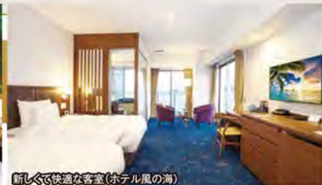
新しく快適な客室(ホテル風の海)