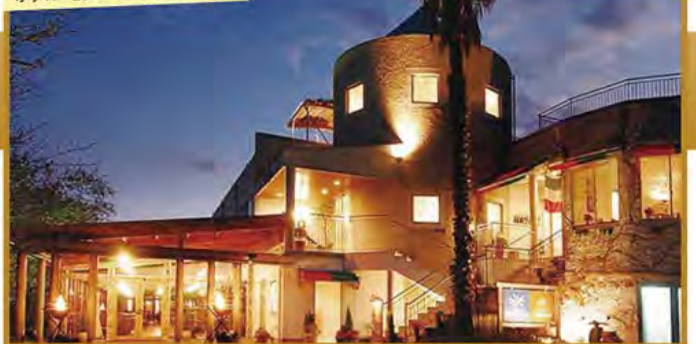
ホテル モアナコースト鳴門 外観

旅行期間 2020年5月3日(日)~5日(火・祝) 旅行代金 お一人様 188,000円 (2~3名様1室) 募集人数 4名(最少催行人数2名) 添乗員 同行いたしません 交通機関 高速バス(大阪~鳴門) 宿泊施設 ホテル モアナコースト鳴門(本館3階建てメゾネット 55㎡・連泊)