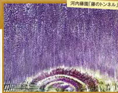
河内藤園「藤のトンネル」