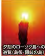
夕刻のローソク島への遊覧(島後・隠岐の島)

旅行期間 2020年5月3日(日)~5日(火・祝) 旅行代金 お一人様 178,000円 (2名様1室) 募集人数 16名(最少催行人数10名) 添乗員 同行いたします 交通機関 航空機、現地貸切バス(運行バス会社:一畑交通・隠岐観光) 宿泊施設 隠岐の島町/隠岐プラザホテル(和室または和洋室) 海士町/マリンポートホテル海士(洋室)