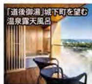
「道後御湯」城下町を望む温泉露天風呂

旅行期間 2020年5月3日(日)~5日(火・祝) 旅行代金 お一人様 218,000円 (2名様1室) ※新大阪駅発着以外ご希望の場合は、お問い合わせください。 募集人数 12名(最少催行人数10名) 添乗員 同行いたします 交通機関 JR【普通指定席・禁煙車】 現地貸切バス(運行バス会社:福山観光バス・奥道後交通) 宿泊施設 鞆の浦/鷗風亭(最上階プレミアムツイン) 道後温泉/道後御湯(露天風呂付和洋室)