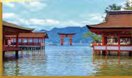
美しい世界遺産*厳島神社

旅行期間 2020年5月4日(月・祝)~6日(水・休) 旅行代金 お一人様 188,000円 (2名様1室) ※新大阪駅発着以外ご希望の場合は、お問い合わせください。 募集人数 12名(最少催行人数10名) 添乗員 同行いたします 交通機関 JR新幹線【グリーン席・禁煙車】※広島→新岩国間は【普通指定席・禁煙車】 現地貸切バス(運行バス会社:岩国観光・廿日市交通) 宿泊施設 宮浜温泉/宮島 離れの宿IBUKU別邸(露天風呂付離れ洋室または和洋室・連泊)