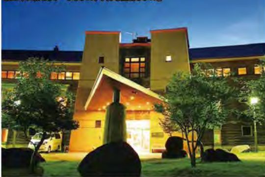
森の中に佇むリゾートホテル「中禅寺金谷ホテル」