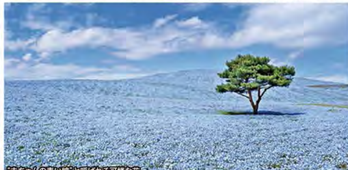
「赤ちゃんの青い瞳」と呼ばれる可憐な花