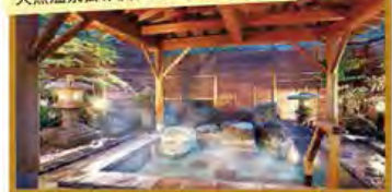
「天然温泉掛け流しの露天風呂」(望雲)

旅行期間 2020年5月3日(日)～5日(火・祝) 旅行代金 お一人様 189,000円 (2名様1室) ※湯宿 季の庭(露天風呂付和洋室)ご希望の場合、お一人様10,000円追加(2泊分) ※新大阪駅発着以外ご希望の場合は、お問い合わせください。 募集人数 16名(最少催行人数10名) 添乗員 同行いたします 交通機関 JR新幹線【グリーン席・禁煙車】 ※東京以遠【普通指定席・禁煙車】 現地貸切バス(運行バス会社:草津交通・まほろば観光) 宿泊施設 草津温泉/望雲「新館 雲松庵」(和室・連泊) または 湯宿 季の庭(露天風呂付和洋室・連泊)