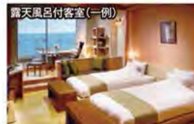
露天風呂付客室(一例)

旅行期間 2020年5月5日(火・祝)~6日(水・祝) 旅行代金 お一人様 168,000円 (2名様1室) ※新大阪駅発着以外ご希望の場合は、お問い合わせください。 募集人数 12名(最少催行人数10名) 添乗員 同行いたします 交通機関 JR新幹線【グリーン席・禁煙車】※JR特急【普通指定席・禁煙車】 現地貸切バス(運行バス会社:ニコバス) 宿泊施設 伊豆稲取温泉/食べるお宿 浜の湯(露天風呂付和洋室)