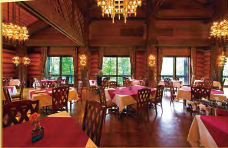
八甲田ホテルのログハウス調レストラン

～手つかずの自然に心癒される旅～ 「八甲田ホテル」2連泊でゆったり巡るみちのく春の絶景紀行 3日間