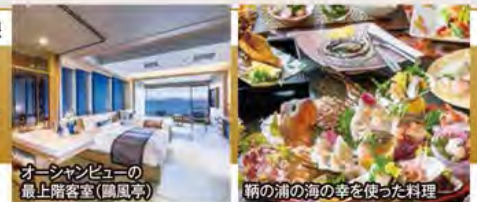
オーシャンビューの最上階客室(鷗風亭)