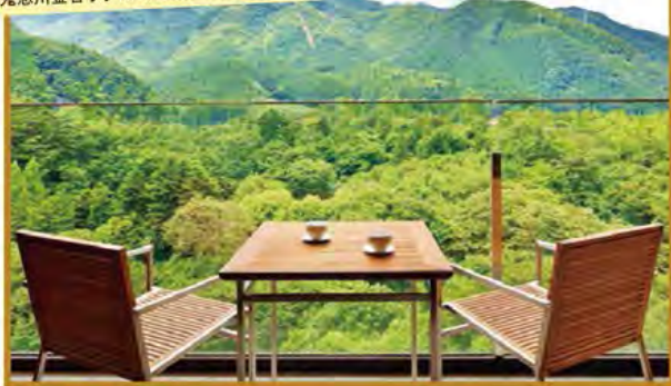
鬼怒川金谷ホテルの客室テラスからの景色