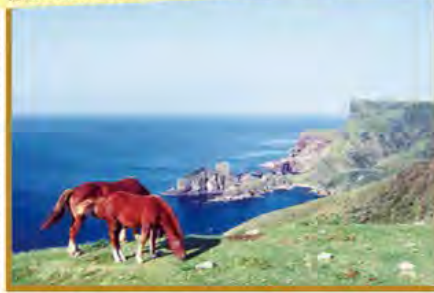
隠岐を代表する景勝地・国賀海岸(島前・西ノ島)

旅行期間 2020年5月3日(日)~5日(火・祝) 旅行代金 お一人様 178,000円 (2名様1室) 募集人数 16名(最少催行人数10名) 添乗員 同行いたします 交通機関 航空機、現地貸切バス(運行バス会社:一畑交通・隠岐観光) 宿泊施設 隠岐の島町/隠岐プラザホテル(和室または和洋室) 海士町/マリンポートホテル海士(洋室)