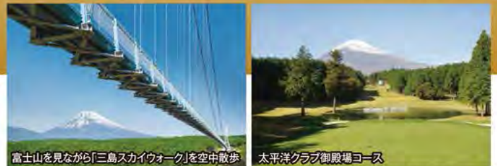
富士山を見ながら「三島スカイウォーク」を空中散歩