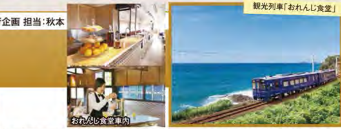
観光列車「おれんじ食堂」

旅行期間 2020年5月3日(日)~5日(火・祝) 旅行代金 お一人様 189,000円 (2名様1室) ※新大阪駅発着以外ご希望の場合は、お問い合わせください。 募集人数 16名(最少催行人数10名) 添乗員 同行いたします 交通機関 JR九州新幹線・肥薩おれんじ鉄道【普通指定席・禁煙車】 現地貸切バス(運行バス会社:託摩観光) 宿泊施設 熊本市内/ザ・ニューホテル熊本(洋室) 霧島温泉/ラピスタ霧島ヒルズ(露天風呂付洋室)