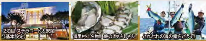
2泊目 ステラコート太安閣(基本設定)