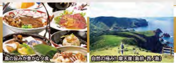
島の旨みが豊かな夕食

~雄大な海洋風景と急峻な山並みの風光明媚な景観~ 世界のジオパーク・隠岐の島!! 溢れる自然美と島グルメ 3日間