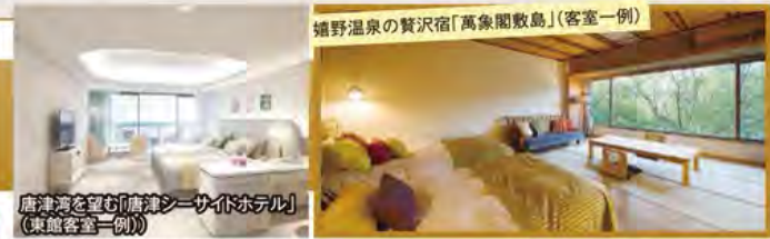
嬉野温泉の贅沢宿「萬象閣敷島」(客室一例)

旅行期間 2020年5月3日(日)~5日(火・祝) 旅行代金 お一人様 198,000円 (2名様1室) ※新大阪駅発着以外ご希望の場合は、お問い合わせください。 ※3名様1室のご希望も承ります。 ※2泊目、露天風呂付ご希望の場合、お一人様8,000円追加 募集人数 14名(最少催行人数10名) 添乗員 同行いたします 交通機関 JR新幹線【グリーン席・禁煙車】 現地貸切バス(運行バス会社:ロイヤル観光バス) 宿泊施設 唐津/唐津シーサイドホテル(2019年12月オープン新東館・洋室) 嬉野温泉/萬象閣敷島(和洋室)