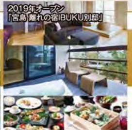
2019年オープン「宮島 離れの宿IBUKU別邸」