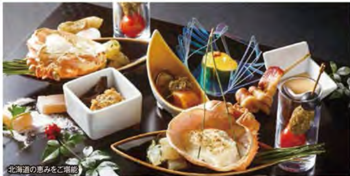
北海道の恵みをご堪能

~日本でいちばん最後に春を感じ、桜や北の大地の恵みを満喫~ 「登別・ニセコ温泉」の極上宿に泊まる北海道周遊&グルメ 3日間