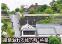
風情溢れる城下町・杵築

旅行期間 2020年5月3日(日)~5日(火・祝) 旅行代金 お一人様 198,000円 (2名様1室) ※新大阪駅発着以外ご希望の場合は、お問い合わせください。 ※2泊目「田乃倉」露天風呂付客室ご希望の場合、お一人様10,000円追加 募集人数 12名(最少催行人数10名) 添乗員 同行いたします 交通機関 JR新幹線【グリーン席・禁煙車】※JR特急【普通指定席・禁煙車】 現地貸切バス(運行バス会社:別府観光バス) 宿泊施設 別府温泉/潮騒の宿 晴海(露天風呂付51㎡洋室) 由布院温泉/旅亭 田乃倉(和室)