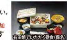
有田焼でいただく昼食(保名)

旅行期間 2020年5月3日(日)~5日(火・祝) 旅行代金 お一人様 198,000円 (2名様1室) ※新大阪駅発着以外ご希望の場合は、お問い合わせください。 ※3名様1室のご希望も承ります。 ※2泊目、露天風呂付ご希望の場合、お一人様8,000円追加 募集人数 14名(最少催行人数10名) 添乗員 同行いたします 交通機関 JR新幹線【グリーン席・禁煙車】 現地貸切バス(運行バス会社:ロイヤル観光バス) 宿泊施設 唐津/唐津シーサイドホテル(2019年12月オープン新東館・洋室) 嬉野温泉/萬象閣敷島(和洋室)