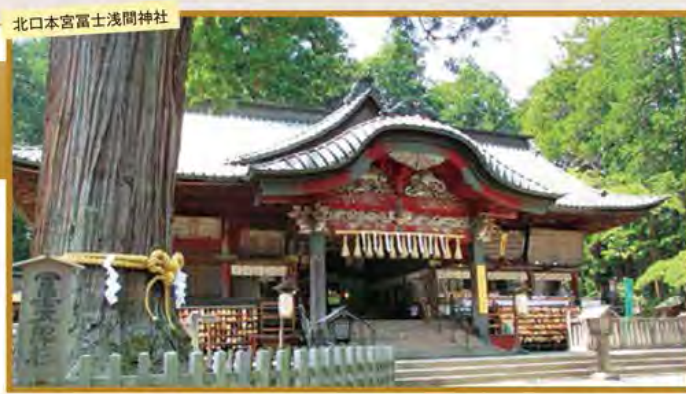
北口本宮富士浅間神社