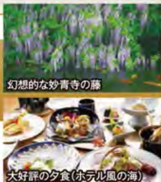
幻想的な妙青寺の藤

旅行期間 2020年5月3日(日)~5日(火・祝) 旅行代金 お一人様 198,000円 (2名様1室) ※新大阪駅発着以外ご希望の場合は、お問い合わせください。 募集人数 14名(最少催行人数10名) 添乗員 同行いたします 交通機関 JR新幹線【グリーン席・禁煙車】 現地貸切バス(運行バス会社:新下関観光バス) 宿泊施設 下関温泉/ホテル風の海(温泉展望風呂付洋室・連泊)