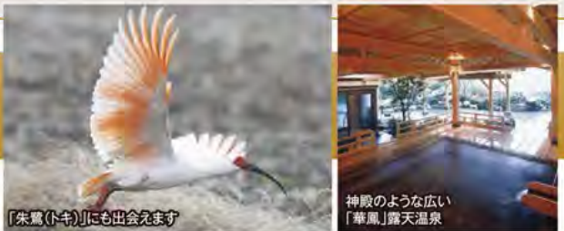
「朱鷺(トキ)」にも出会えます