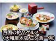
四国の絶品グルメ(大和屋本店)ご夕食一例

旅行期間 2020年5月3日(日)~6日(水・休) 旅行代金 お一人様 228,000円 (2名様1室) ※新大阪駅発着以外ご希望の場合は、お問い合わせください。 募集人数 12名(最少催行人数10名) 添乗員 同行いたします 交通機関 JR新幹線【グリーン席・禁煙車】※JR特急【普通指定席・禁煙車】 現地貸切バス (運行バス会社:かずらばしタクシー・県交北部交通・愛媛近鉄タクシー 他同等クラス) 宿泊施設 高知市内/城西館(和室)、四万十温泉/四万十の宿(和室または洋室) 道後温泉/大和屋本店(和室)