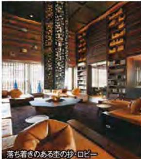
落ち着きのある空の抄・ロビー