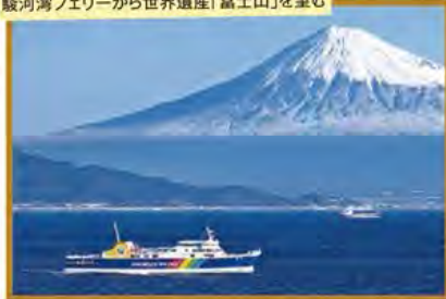
駿河湾フェリーから世界遺産「富士山」を望む

旅行期間 2020年5月3日(日)~4日(月・祝) 旅行代金 お一人様 158,000円 (2名様1室) ※露天風呂付和室ご希望の場合、お一人様8,000円追加 ※新大阪駅発着以外ご希望の場合は、お問い合わせください。 募集人数 16名(最少催行人数10名) 添乗員 同行いたします 交通機関 JR新幹線【グリーン席・禁煙車】 現地貸切バス(運行バス会社:ドリーム観光バス) 宿泊施設 修善寺温泉/柳生の庄(半露天風呂付和室)