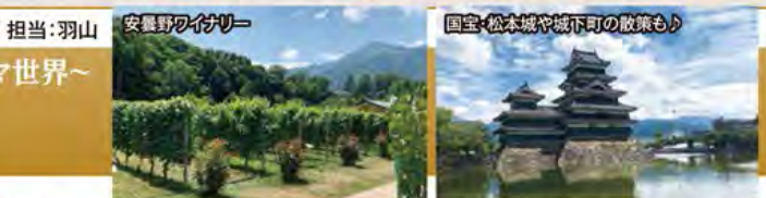
安曇野ワイナリー