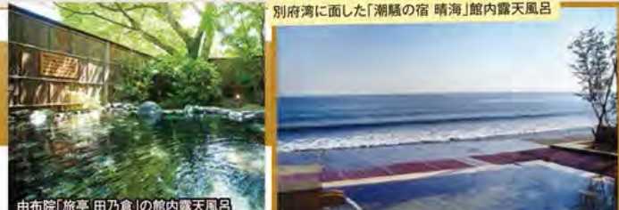
別府湾に面した「潮騒の宿 晴海」館内露天風呂

旅行期間 2020年5月3日(日)~5日(火・祝) 旅行代金 お一人様 198,000円 (2名様1室) ※新大阪駅発着以外ご希望の場合は、お問い合わせください。 ※2泊目「田乃倉」露天風呂付客室ご希望の場合、お一人様10,000円追加 募集人数 12名(最少催行人数10名) 添乗員 同行いたします 交通機関 JR新幹線【グリーン席・禁煙車】※JR特急【普通指定席・禁煙車】 現地貸切バス(運行バス会社:別府観光バス) 宿泊施設 別府温泉/潮騒の宿 晴海(露天風呂付51㎡洋室) 由布院温泉/旅亭 田乃倉(和室)