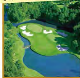
春のトーナメント開催の山名コース

旅行期間 2020年5月3日(日)~5日(火・祝) 旅行代金 お一人様 149,000円 (2名様1室)【プレー費別途】 ※新大阪駅発着以外ご希望の場合は、お問い合わせください。 募集人数 16名(最少催行人数10名) 添乗員 同行いたします 交通機関 JR新幹線【グリーン席・禁煙車】 宿泊施設 袋井/葛城北の丸(洋室・連泊)