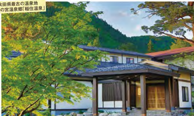
秋田県最古の温泉地 秋の宮温泉郷「稲住温泉」

～露天風呂付客室で快適に過ごす～ 秋田最古の温泉地とみちのく三県を巡るプレミアム東北 3日間