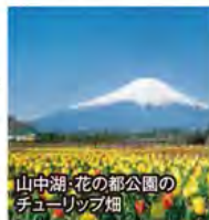
山中湖・花の都公園のチューリップ畑

旅行期間 2020年5月3日(日)~5日(火・祝) 旅行代金 お一人様 198,000円 (2~3名様1室) ※新大阪駅発着以外ご希望の場合は、お問い合わせください。 募集人数 20名(最少催行人数10名) 添乗員 同行いたします 交通機関 JR新幹線【グリーン席・禁煙車】 現地貸切バス(運行バス会社:ドリーム観光バス) 宿泊施設 河口湖/ラビスタ富士河口湖(洋室・連泊)