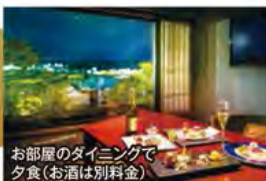
鐘山苑「別墅然然」テラス付客室(一例)

旅行期間 2020年5月3日(日)～5日(火・祝) 旅行代金 お一人様 218,000円 (2名様1室) ※新大阪駅発着以外ご希望の場合は、お問い合わせください。 ※3名様1室のご希望も承ります。 ※鐘山苑テラス付客室ご希望の場合、お一人様30,000円追加(2泊分) 募集人数 14名(最少催行人数10名) 添乗員 同行いたします 交通機関 JR新幹線【グリーン席・禁煙車】※JR特急【普通指定席・禁煙車】 富士山ビュー特急【1号車特別車両】 現地貸切バス(運行バス会社:ドリーム観光バス) 宿泊施設 富士山温泉 / 鐘山苑「別墅然然」(露天風呂付和洋室・連泊)