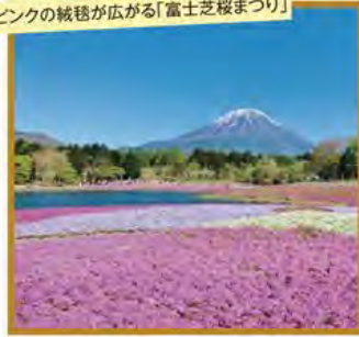
ピンクの絨毯が広がる「富士芝桜まつり」

旅行期間 2020年5月3日(日)~5日(火・祝) 旅行代金 お一人様 198,000円 (2~3名様1室) ※新大阪駅発着以外ご希望の場合は、お問い合わせください。 募集人数 20名(最少催行人数10名) 添乗員 同行いたします 交通機関 JR新幹線【グリーン席・禁煙車】 現地貸切バス(運行バス会社:ドリーム観光バス) 宿泊施設 河口湖/ラビスタ富士河口湖(洋室・連泊)