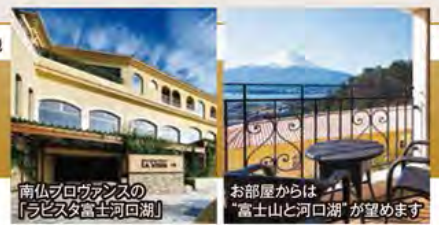
南仏プロヴァンスの「ラビスタ富士河口湖」

~南仏プロヴァンスが薫る絶景のホテルにご宿泊~ 80万株の富士芝桜まつりと富士山を望むラビスタ富士河口湖 3日間