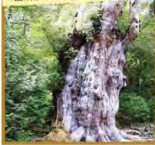
一度は見てみたい世界遺産の縄文杉

●ご宿泊は広めのデラックスツインと温泉を備えるリゾートホテルで、トレッキングでの疲れを癒すのに最適です。