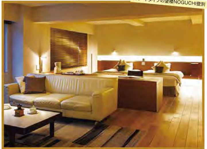
スイートタイプの望楼NOGUCHI登別

旅のPoint ●雪解け後にピンク色の花びらが咲き誇る北の大地。爽やかな春の休日をお過ごしいただけます。