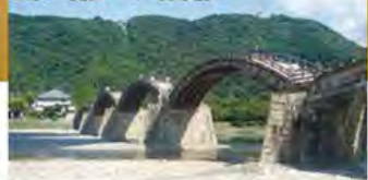
日本三奇橋の一つ 錦帯橋