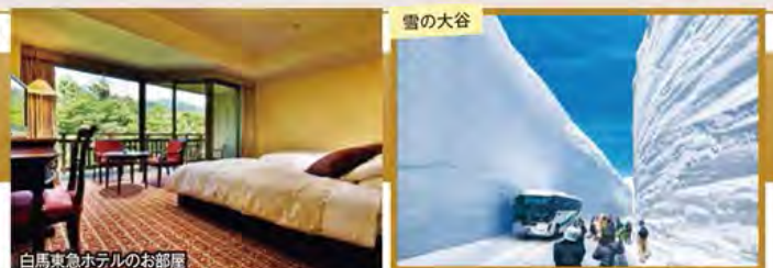
白馬東急ホテルのお部屋