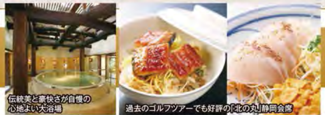
伝統美と豪快さが自慢の心地よい犬浴場