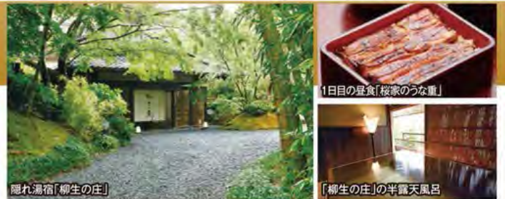
隠れ湯宿「柳生の庄」

旅行期間 2020年5月3日(日)~4日(月・祝) 旅行代金 お一人様 158,000円 (2名様1室) ※露天風呂付和室ご希望の場合、お一人様8,000円追加 ※新大阪駅発着以外ご希望の場合は、お問い合わせください。 募集人数 16名(最少催行人数10名) 添乗員 同行いたします 交通機関 JR新幹線【グリーン席・禁煙車】 現地貸切バス(運行バス会社:ドリーム観光バス) 宿泊施設 修善寺温泉/柳生の庄(半露天風呂付和室)