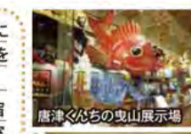
唐津湾を望む「唐津シーサイドホテル」(東館客室一例)