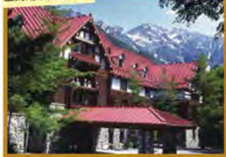
上高地帝国ホテル