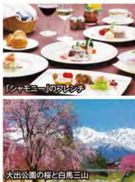
大出公園の桜と白馬三山

●北アルプスの迎賓館「白馬東急ホテル」は、赤い屋根がシンボルのヨーロッパテイスト溢れる高貴なリゾートホテル。ゆったり2連泊でご用意。ホテルでありながら、大浴場の天然温泉や洋食と和食2種類のディナーをお楽しみいただけます。 ●アルペンルート室堂では、立山・雪の大谷ウォークにご案内。高さ最大20mにも迫る、雪の壁の間を、4月中旬~6月中旬限定でウォーキングすることができます。 ●例年GWが見頃の白馬の桜。息を飲むほど美しい、残雪の白馬三山と桜の共演をお楽しみください。