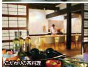
こだわりの茶料理