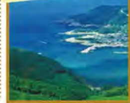
無数の島々が織りなす景色が素晴らしい浅茅湾(対馬)

旅行期間 2020年5月3日(日)~5日(火・祝) 旅行代金 お一人様 179,000円 (2名様1室) ※伊丹空港発着以外ご希望の場合は、お問い合わせください。 ※2泊目を「海里村上」ご希望の場合、お一人様55,000円追加 募集人数 16名(最少催行人数10名) 添乗員 現地添乗員が同行いたします 交通機関 航空機、現地貸切バス(運行バス会社:対馬交通・壱岐交通) 宿泊施設 対馬・真珠の湯温泉/対馬グランドホテル(洋室) 壱岐/ステラコート太安閣(和室)または海里村上