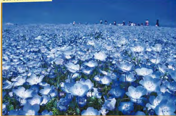
どこまでも続くネモフィラの青

旅のPoint ●約450万本のネモフィラが丘一面を埋め尽くす、国営ひたち海浜公園へご案内。太平洋を望む丘に登ると青空の青・海の青・ネモフィラの青に包まれます。 ●お泊りは、日本の建築美に西洋の家具や備品がとけ込んだ「日本最古のクラシックリゾートホテル」日光金谷ホテル。日光東照宮にもご参拝いただけます。