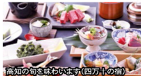
高知の旬を味わいます(四万十の宿)

旅行期間 2020年2月23日(日)~24日(月・祝) 旅行代金 お一人様 98,000円 (2名様1室) ※2/22(土)大阪空港ホテル前泊承ります【別途料金】 ※露天風呂付客室ご希望の場合、お一人様3,000円追加 募集人数 14名(最少催行人数10名) 添乗員 同行いたします 交通機関 航空機、現地貸切バス(運行バス会社:高知駅前観光) 宿泊施設 四万十川 / 四万十の宿(洋室)