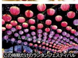
この時期だけのランタンフェスティバル

旅行期間 2020年2月22日(土)~24日(月・祝) 旅行代金 お一人様 138,000円 (2名様1室/エコミークラス利用) 【プレー費別途】 ※シングル利用の場合、18,000円追加 ※空港税、燃油特別付加運賃等(概算15,000円)別途必要 ※ビジネスクラスご希望の場合はお問い合わせください。 募集人数 12名(最少催行人数10名) 添乗員 同行いたします 利用航空会社 エバー航空 宿泊施設 台北/インペリアル(連泊)