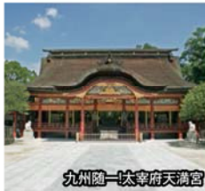
九州随一!太宰府天満宮