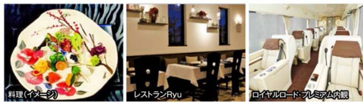
料理(イメージ) レストランRyu ロイヤルロード・プレミアム内観

ラグジュアリーバスで行く美味しい日帰り 令和初の新年を迎えた伊勢神宮参拝と松阪牛フレンチ懐石