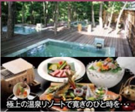
極上の温泉リゾートで寛ぎのひと時を...