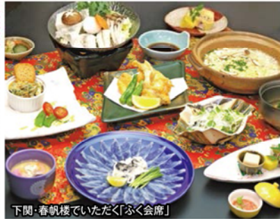
下関・春帆楼でいただく「ふく会席」

旅行期間 2020年2月23日(日)~24日(月・祝) 旅行代金 お一人様 138,000円 (2名様1室) ※新大阪駅発着以外ご希望の場合はお問い合わせください。 募集人数 6組様限定(最少催行人数10名) 添乗員 同行いたします 交通機関 JR新幹線【グリーン席・禁煙車】※新下関駅→新山口駅間は普通指定席 現地貸切バス(運行バス会社:おすすみ観光) 宿泊施設 湯田温泉 / 古稀庵(和洋室)