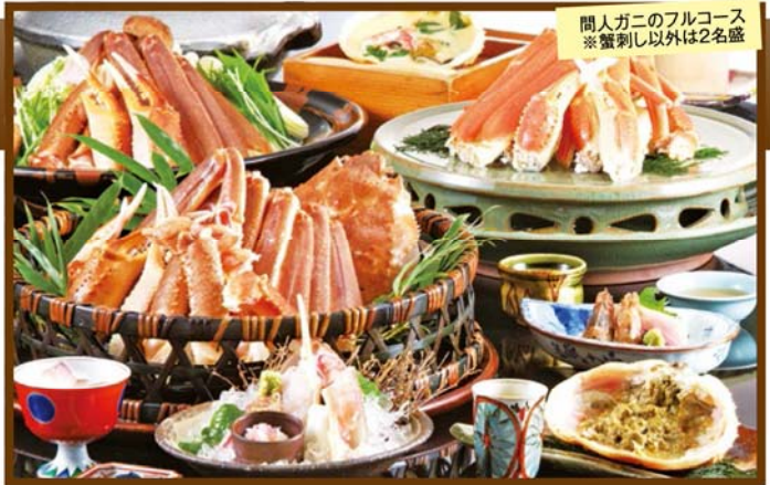
人間ガニのフルコース ※蟹刺し以外は2名盛