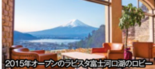
2015年オープンしたラビスタ富士河口湖のロビー