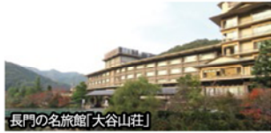
長門の名旅館「大谷山荘」