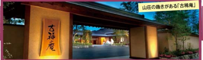
山荘の趣きがある「古稀庵」

~大好評!!豊富な湯量を誇る湯田温泉の極上宿~ 源泉掛け流しの露天風呂付「古稀庵」と 「春帆楼」の“ふく会席”2日間