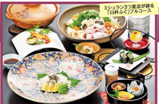
ミシュラン3つ星店が誇る「白杵ふぐ」フルコース

~ミシュラン3つ星獲得店の本店で味わうとらふぐと奥由布の名宿~ 全室露天風呂付!「ゆふいん月燈庵」と 「白杵ふぐ」を堪能する 2日間