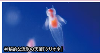
神秘的な流水の天使「クリオネ」