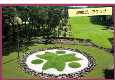
桃園ゴルフクラブ