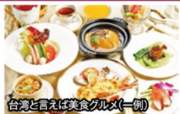
台湾と言えば美食グルメ(一例)