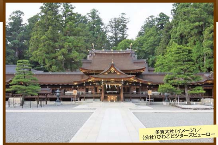
多賀大社(イメージ)

旅行期間 2020年1月12日(日) (日帰り) 旅行代金 お一人様 59,800円 募集人数 10名(最少催行人数6名) 添乗員 同行いたします 交通機関 貸切バス(運行バス会社:ケイエム観光バス) 昼食場所 近江八幡/レストラン ティファニー