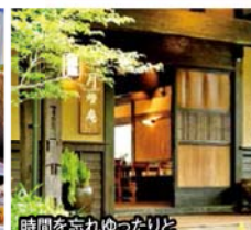
時間を忘れゆつたりと