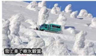
雪上車で樹氷観賞