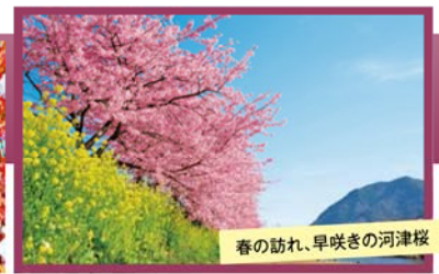
春の訪れ、早咲きの河津桜