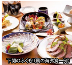
下関のふくも! (風の海夕食一例)