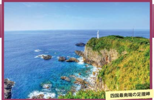
四国最南端の足摺岬

~わずか50分のフライトで気軽に土佐の国へ~ 幕末の志士「坂本龍馬」ゆかりの高知 足摺・四万十を巡る 2日間