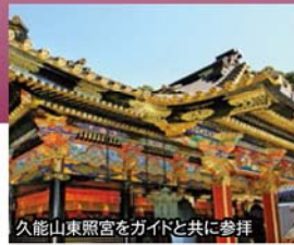
久能山東照宮をガイドと共に参拝