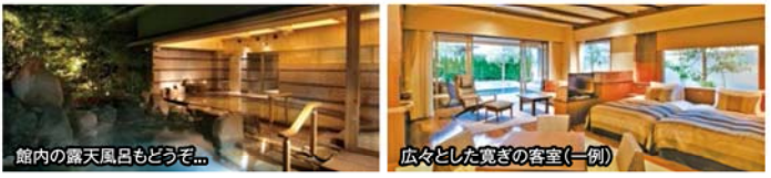
館内の露天風呂もどうぞ...