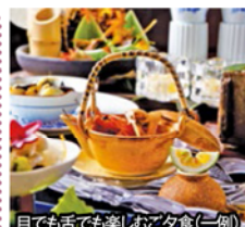
目で舌でも楽しむお夕食(一例)