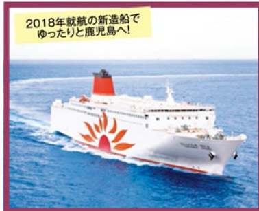
2018年就航の新造船でゆったりと鹿児島へ!