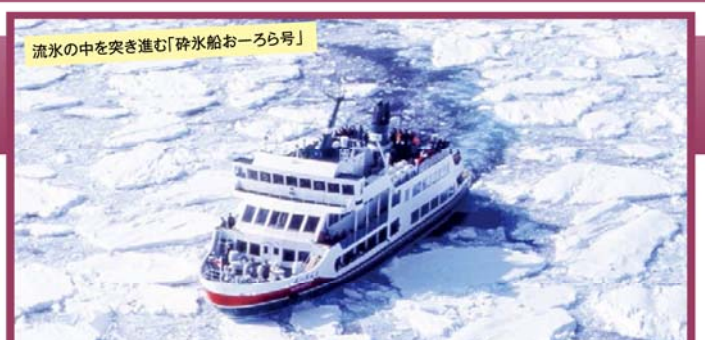
流水の中を突き進む「砕氷船おーろら号」

旅行期間 2020年2月23日(日)~24日(月・祝) 旅行代金 お一人様 148,000円 (2名様1室) ※伊丹空港発着以外ご希望の場合はお問い合わせください。 募集人数 25名(最少催行人数10名) 添乗員 現地添乗員が同行いたします 交通機関 航空機、現地貸切バス(運行バス会社:北海道ミントバス)※バスガイドは乗務いたしません 宿泊施設 網走呼人/北天の丘 あばしり湖 鶴雅リゾート(和洋室)