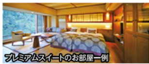
プレミアムスイートのお部屋一例