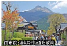
由布院:湯の坪街道を散策

旅行期間 2020年2月23日(日)~24日(月・祝) 旅行代金 お一人様 138,000円 (2名様1室) ※別館・特別室ご希望の場合、お一人様18,000円追加 ※新大阪駅発着以外ご希望の場合はお問い合わせください。 募集人数 12名(最少催行人数10名) 添乗員 同行いたします 交通機関 JR新幹線【グリーン席・禁煙車】※JR特急【普通指定席・禁煙車】 現地貸切バス(運行バス会社:別府観光バス) 宿泊施設 由布院温泉 / ゆふいん月燈庵(露天風呂付和室)