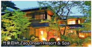
竹泉荘Mt.Zao Onsen Resort & Spa