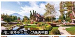
河口湖オルゴールの森美術館