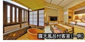
露天風呂付客室(一例)

旅行期間 2020年1月12日(日)～13日(月・祝) 旅行代金 お一人様 105,000円 (2名様1室) ※新大阪駅到着以外ご希望の場合はお問い合わせください。 募集人数 14名(最少催行人数10名) 添乗員 同行いたします 交通機関 JR新幹線【グリーン席・禁煙車】※JR特急【普通指定席・禁煙車】 現地貸切バス(運行バス会社:琴参バスまたは大川バス) 宿泊施設 ことひら温泉 / 敷島館(本館/露天風呂付和洋室または洋室)