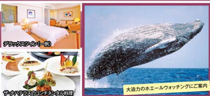
デラックスツイン(一例)