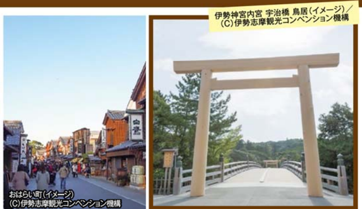
伊勢神宮内宮 宇治橋 鳥居(イメージ)

旅行期間 2020年1月13日(月・祝) (日帰り) 旅行代金 お一人様 59,800円 募集人数 10名(最少催行人数6名) 添乗員 同行いたします 交通機関 貸切バス(運行バス会社:ケイエム観光バス) 昼食場所 明和町/レストラン Ryu