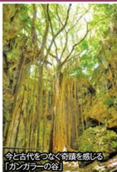
今と古代をつなぐ奇蹟を感じる「ガンガラーの谷」