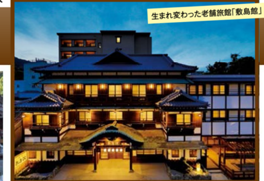
生まれ変わった老舗旅館「敷島館」

旅行期間 2020年1月12日(日)～13日(月・祝) 旅行代金 お一人様 105,000円 (2名様1室) ※新大阪駅到着以外ご希望の場合はお問い合わせください。 募集人数 14名(最少催行人数10名) 添乗員 同行いたします 交通機関 JR新幹線【グリーン席・禁煙車】※JR特急【普通指定席・禁煙車】 現地貸切バス(運行バス会社:琴参バスまたは大川バス) 宿泊施設 ことひら温泉 / 敷島館(本館/露天風呂付和洋室または洋室)