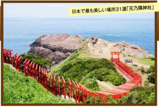
日本で最も美しい場所31選「元乃隅神社」

旅行期間 2020年1月12日(日)～13日(月・祝) 旅行代金 お一人様 128,000円 (2名様1室) ※「2018年7月NEW OPENの 曙館 66㎡プレミアムスイート(和洋室)」ご希望の場合、お一人様 4,000円追加 ※新大阪駅到着以外ご希望の場合はお問い合わせください。 募集人数 14名(最少催行人数10名) 添乗員 同行いたします 交通機関 JR新幹線【グリーン席・禁煙車】 現地貸切バス(運行バス会社:おおすみ観光バス) 宿泊施設 長門湯本温泉 / 大谷山荘(芙蓉館 60㎡ プレミアムスイート/和洋室)