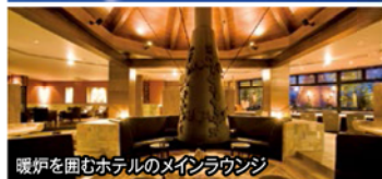
暖炉を囲むホテルのメインラウンジ

旅行期間 2020年2月23日(日)~24日(月・祝) 旅行代金 お一人様 148,000円 (2名様1室) ※伊丹空港発着以外ご希望の場合はお問い合わせください。 募集人数 25名(最少催行人数10名) 添乗員 現地添乗員が同行いたします 交通機関 航空機、現地貸切バス(運行バス会社:北海道ミントバス)※バスガイドは乗務いたしません 宿泊施設 網走呼人/北天の丘 あばしり湖 鶴雅リゾート(和洋室)