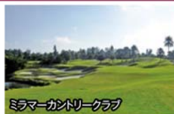
ミラマーカントリークラブ