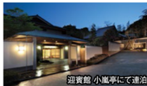
迎賓館 小嵐亭にて連泊

旅のPoint ● 明治からつづく熱海の奥座敷“迎賓館小嵐亭”に連泊。保温効果にすぐれる美肌の湯を、のんびりとお楽しみください。 ● 知っていてもなかなか行けない“伊豆大島”を観光します。黒潮の影響で1年を通じて温暖な気候に恵まれ、島の中央にそびえる三原山を中心とした火山島ならではの特長的な景観が広がっています。 ● 伊豆に早い春を告げるピンク色の桜“河津桜”もご覧いただき、ひと足早く春を感じいただけるツアーです。