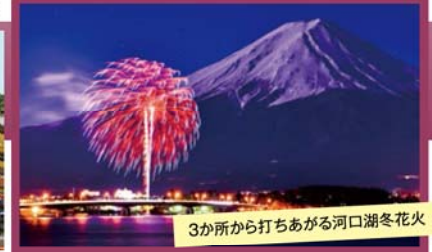
3か所から打ちあがる河口湖冬花火