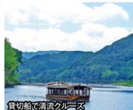
貸切船で清流クルーズ