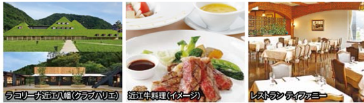
ラコリーナ近江八幡(クラブハリエ) 近江牛料理(イメージ) レストランティファニー

ラグジュアリーバスで行く美味しい日帰り 令和初の新年を迎えた 多賀大社参拝と近江牛のランチ