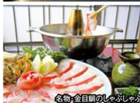
名物:金目鯛のしゃぶしゃぶ