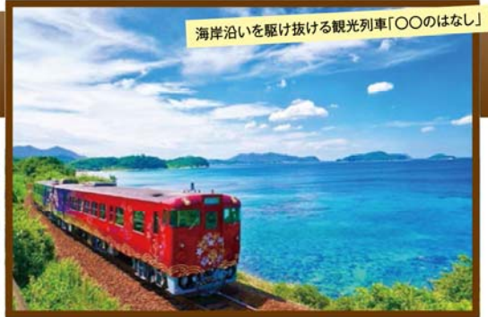
海岸沿いを駆け抜ける観光列車「〇〇のはなし」

旅行期間 2020年1月12日(日)～13日(月・祝) 旅行代金 お一人様 128,000円 (2名様1室) ※新大阪駅到着以外ご希望の場合はお問い合わせください。 募集人数 14名(最少催行人数10名) 添乗員 同行いたします 交通機関 JR新幹線【グリーン席・禁煙車】※九州新幹線【普通指定席・禁煙車】 現地貸切バス(運行バス会社:新下関観光バス) 宿泊施設 下関温泉 / ホテル風の海(温泉展望風呂付洋室)