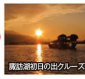
諏訪湖初日の出クルーズ

旅行期間 2019年12月31日(火)~2020年1月2日(木) 旅行代金 お一人様 189,000円 (2名様1室) ※離れ特別室ご希望の場合、お一人様20,000円追加(2泊分) ※新大阪駅発着以外の場合はお問い合わせください。 募集人数 12名(最少催行人数10名) 添乗員 同行いたします 交通機関 JR新幹線【グリーン席・禁煙車】※JR特急【普通指定席・禁煙車】 現地貸切バス(運行バス会社:茅野バス観光) のほはん 宿泊施設 上諏訪温泉/布半(諏訪湖側和室・連泊)