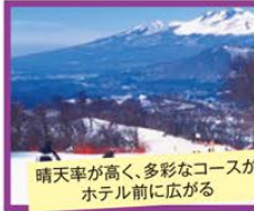
晴天率が高く、多彩なコースがホテル前に広がる

旅行期間 2019年12月31日(火)~2020年1月2日(木) 旅行代金 お一人様 189,000円 (ツイン利用/大人2名様1室) ※ツインは最大定員3名様。シングルはお受けできません。 お一人様 149,000円 (ツイン利用/大人4名様1室) ※コテージは3~4名様利用限定。3名様1室利用の場合、お一人様20,000円追加(2泊分) ※小人・幼児料金やその他別条件での料金はお問い合わせください。 ※新大阪駅発着以外の場合はお問い合わせください。 募集人数 12名(最少催行人数2名) 添乗員 同行いたしません 交通機関 JR新幹線【グリーン席・禁煙車】※東京以遠【普通指定席・禁煙車】 宿泊施設 軽井沢/軽井沢プリンスホテルイースト(ツインルームまたはコテージ・連泊)