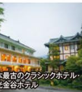
日本最古のクラシックホテル・日光金谷ホテル