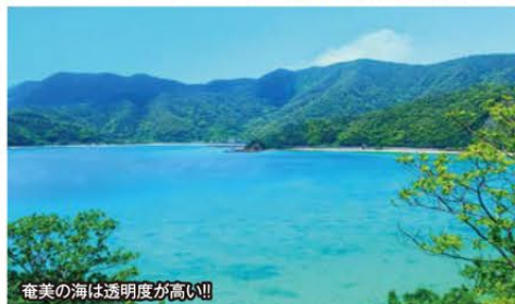
奄美の海は透明度が高い!!

旅のPoint ●2千万年変わらぬ太古の自然を持ち、はるか昔は大陸と繋がっていたとされる「奄美大島」へご案内いたします。