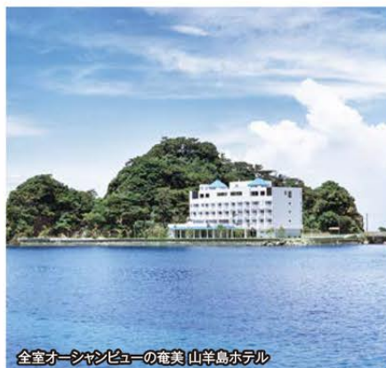
全室オーシャンビューの奄美 山羊島ホテル