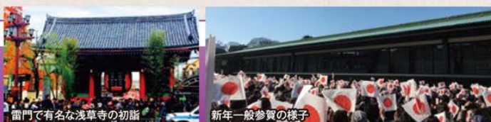
雷門で有名な浅草寺の初詣