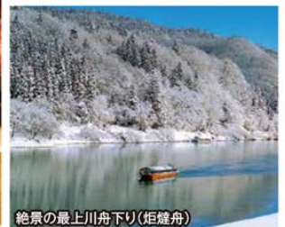
絶景の最上川舟下り(炬燵舟)