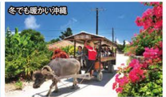
冬でも暖かい沖縄