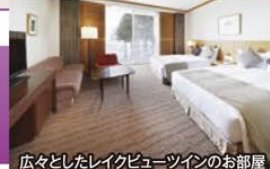
広々としたレイクビューツインのお部屋

~富士山ビューのホテルで令和最初の年越しを~ リニューアルが完了した「ザ・プリンス 箱根芦ノ湖」で過ごす お正月フリープラン 3日間