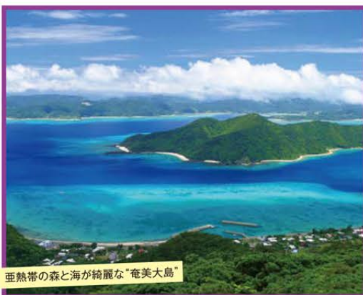
亜熱帯の森と海が綺麗な「奄美大島」

~毎年大好評!温暖な気候と豊かな自然が溢れる東洋のガラパゴス~ 南国の楽園で迎えるお正月!!奄美大島と秘境の加計呂麻島 3日間