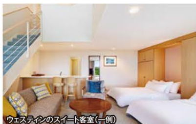
ウェスティンのスイート客室(一例)