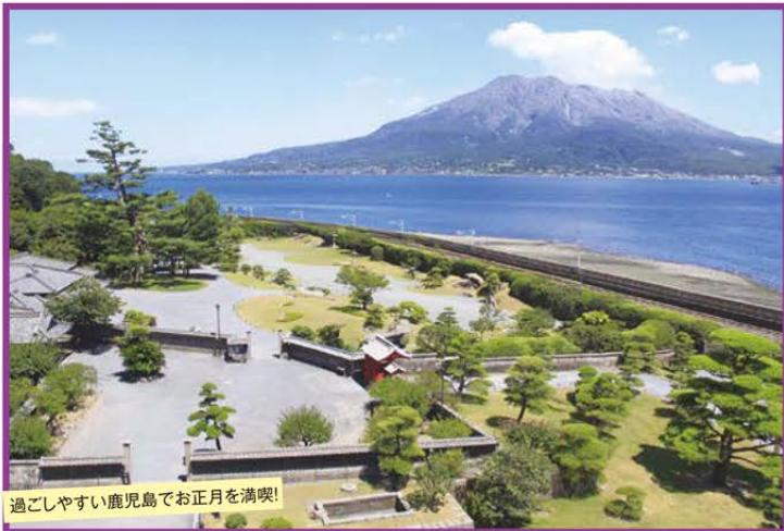
過ごしやすい鹿児島でお正月を満喫!

~2018年12月開業の暖かい南国リゾート~ 全室露天風呂付!「ラビスタ霧島ヒルズ」で過ごす鹿児島のお正月 3日間