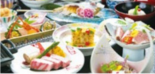
飛騨牛や厳選食材を使用した懐石