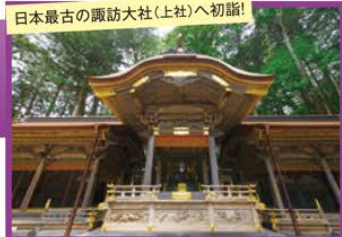
日本最古の諏訪大社(上社)へ初詣!

旅行期間 2019年12月31日(火)~2020年1月2日(木) 旅行代金 お一人様 189,000円 (2名様1室) ※離れ特別室ご希望の場合、お一人様20,000円追加(2泊分) ※新大阪駅発着以外の場合はお問い合わせください。 募集人数 12名(最少催行人数10名) 添乗員 同行いたします 交通機関 JR新幹線【グリーン席・禁煙車】※JR特急【普通指定席・禁煙車】 現地貸切バス(運行バス会社:茅野バス観光) のほはん 宿泊施設 上諏訪温泉/布半(諏訪湖側和室・連泊)