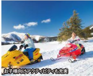
お子様向けアクティビティも充実