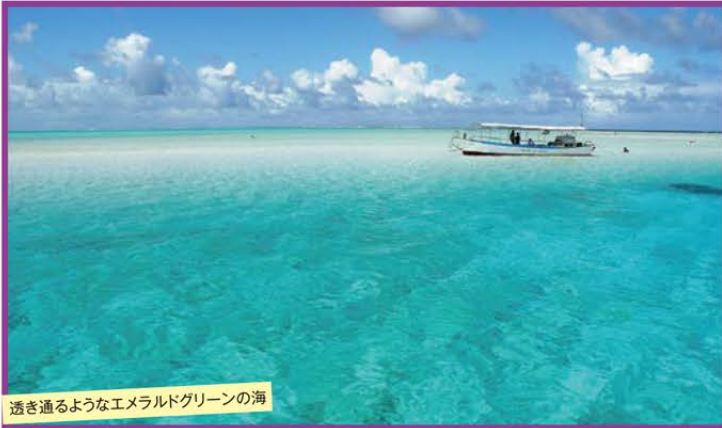
透き通るようなエメラルドグリーン海

～東洋の真珠と呼ばれる美しき楽園～ 一生に一度は行きたい癒しの島「与論島」で過ごすお正月 3日間