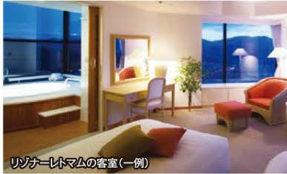
リゾートトマムの客室(一例)

～スキーデビューから上級者まで大満足～ ファミリースノーリゾート 星野リゾートトマム 4日間