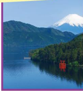
芦ノ湖より望む富士山の絶景

旅行期間 2019年12月31日(火)~2020年1月2日(木) 旅行代金 お一人様 178,000円 (2名様1室) ※新大阪駅発着以外の場合はお問い合わせください。 募集人数 16名(最少催行人数2名) 添乗員 同行いたしません 交通機関 JR新幹線【グリーン席・禁煙車】 宿泊施設 芦ノ湖/ザ・プリンス 箱根芦ノ湖(洋室・連泊)