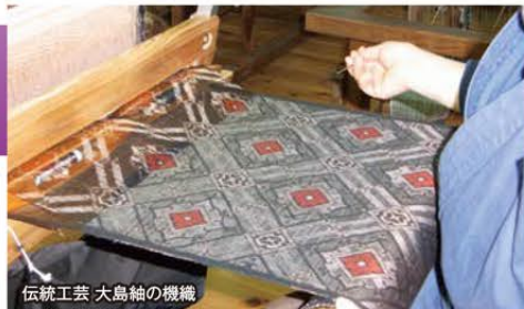
伝統工芸 大島紬の機織