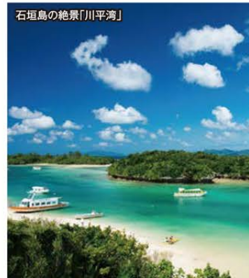
石垣島の絶景「川平湾」