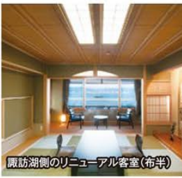
諏訪湖側のリニューアル客室(布半)