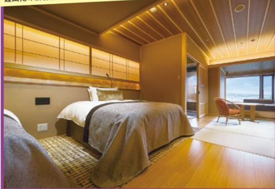
鐘山苑の新客室「燦里」(露天風呂付和洋室)

～世界遺産「富士山」を望むお宿で新年を迎える～ 富士山の露天風呂付・新客室 鐘山苑「燦里」で過ごす極上のお正月 3日間