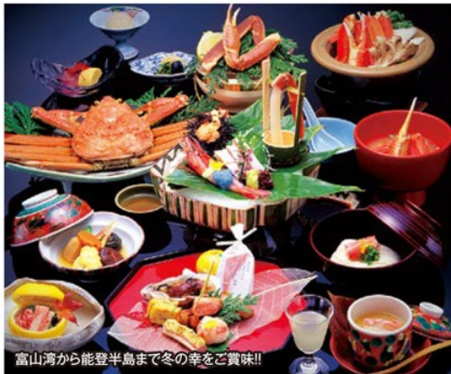
富山湾から能登半島まで冬の幸を堪能!!