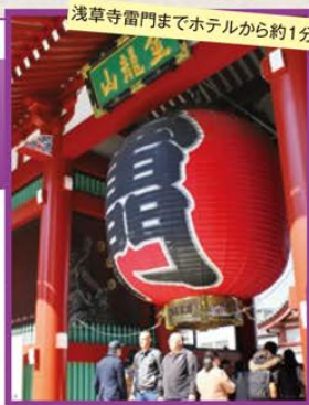
浅草寺雷門までホテルから約1分