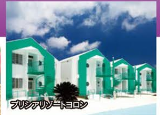
プリシアリゾートヨロン