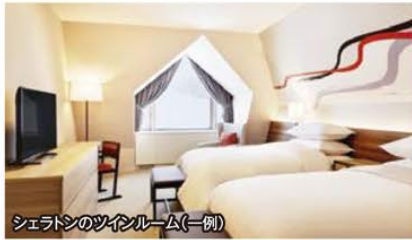
シェラトンのツインルーム(一例)

~リゾートの最高峰としてリブランドOPEN!~ 『世界屈指のパウダースノー』 キロロスノーワールド 4日間