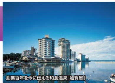
創業百年を今に伝える和倉温泉「加賀屋」