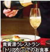
貴賓漂レストラン「トリアゾン」でのお食事

旅行期間 2019年12月31日(火)~2020年1月2日(木) 旅行代金 お一人様 178,000円 (2名様1室) ※新大阪駅発着以外の場合はお問い合わせください。 募集人数 16名(最少催行人数2名) 添乗員 同行いたしません 交通機関 JR新幹線【グリーン席・禁煙車】 宿泊施設 芦ノ湖/ザ・プリンス 箱根芦ノ湖(洋室・連泊)