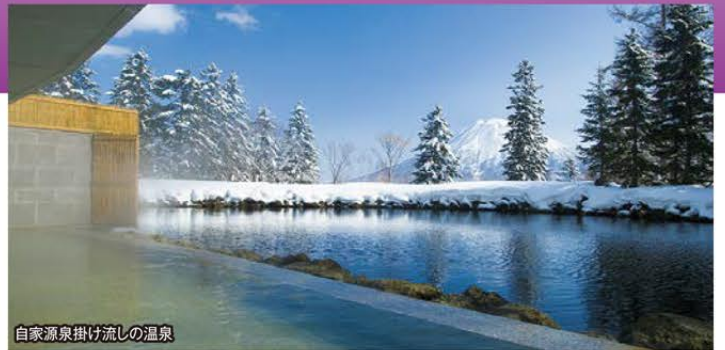
自家源泉掛け流しの温泉