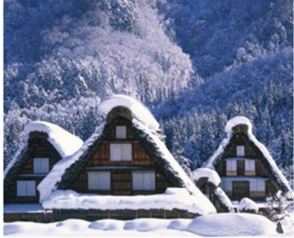
雪化粧が美しい世界遺産「白川郷」