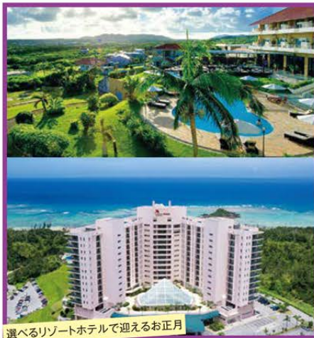
選べるリゾートホテルで迎えるお正月

●《石垣島》 …大自然の宝庫を味わうなら八重山リゾート!那覇より約400キロ離れた南の島。「西表島」「竹富島」など恵まれた大自然が多く、これぞ南の島。58㎡のお部屋は、くつろぎの空間。