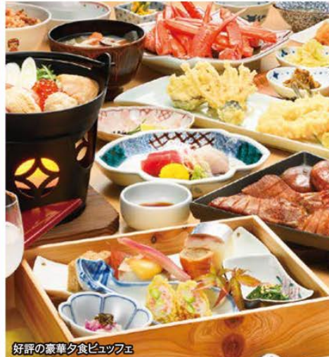
好評の豪華夕食ビュッフェ