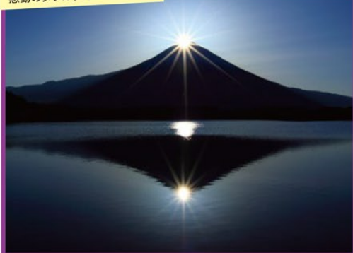
感動のダブルダイヤモンド富士

～新年の幕開け!運が良ければダブルダイヤモンド富士も♪～ 毎年好評!感動のダイヤモンド富士・初日の出観賞とラビスタ富士河口湖 3日間