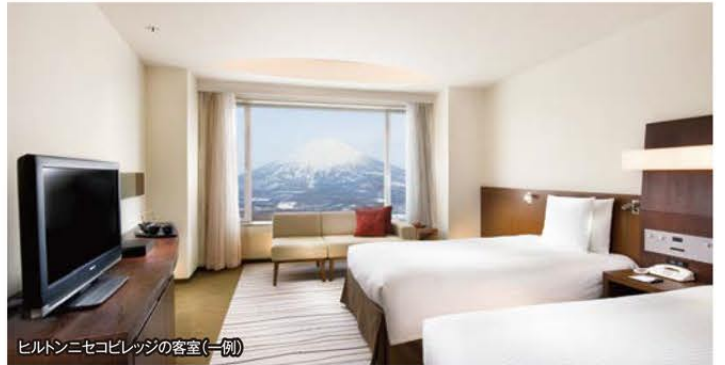
ヒルトンニセコビレッジの客室(一例)