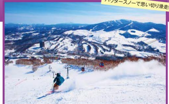
パウダースノーで思い切り滑走!

旅行期間 2019年12月30日(月)～2020年1月2日(木) 2019年12月31日(火)～2020年1月3日(金) ※前泊及び延泊、その他のご出発日も承ります。