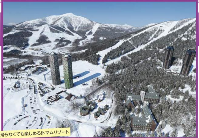
滑らなくても楽しめる!トマムリゾート

宿泊施設 星野リゾートトマム ザ・タワー(洋室・連泊) または リゾートトマム(スイート100～120㎡・連泊)