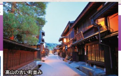
高山の古い町並み