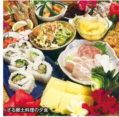
さる郷土料理の夕食