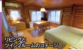
リビングとツイン2ルームのコテージ