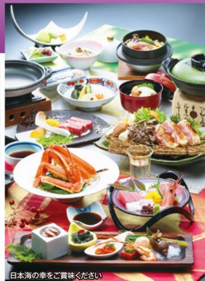
日本海の幸をご堪能ください

旅のPoint ●「平成の大遷宮」によって生まれ変わった「出雲大社」を元日に訪れる新年のご縁参りの旅!アメリカの日本庭園誌に16年連続日本一に選ばれた「足立美術館」や松江のシンボル「松江城」を訪ね。お堀を遊覧船でゆつくり巡ります。 ●約1300年前に書かれた「出雲国風土記」にも登場する歴史のある玉造温泉は、美肌潤い温泉と名高い名湯。化粧水のような泉質の温泉と純和風旅館で、心も体もゆつくりお寛ぎください。