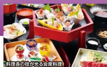
料理長の技が光る会席料理