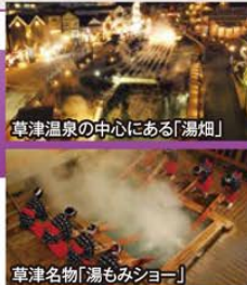
草津温泉の中心にある「湯畑」