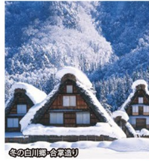
冬の白川郷・合掌造り

旅行期間 2019年12月31日(火)～2020年1月2日(木) 旅行代金 お一人様 169,000円 (2名様1室) ※新大阪駅発着以外の場合はお問い合わせください。 募集人数 12名(最少催行人数2名) 添乗員 同行いたしません 交通機関 JR新幹線【グリーン席・禁煙車】※JR特急【普通指定席・禁煙車】 宿泊施設 下呂温泉 / 水明館 臨川閣(和室・連泊)