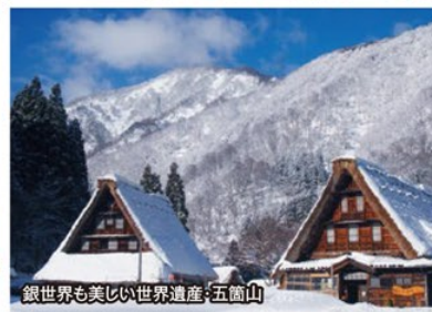
銀世界も美しい世界遺産・五箇山

旅のPoint ●北陸を代表する豪華旅館に連泊し、優雅にお正月を過ごすプランです。日本海の厳しい冬は魚介類の身をぎゅっと引き締め、特にこの時期は美味しく、良質なお米や地酒にも合います。