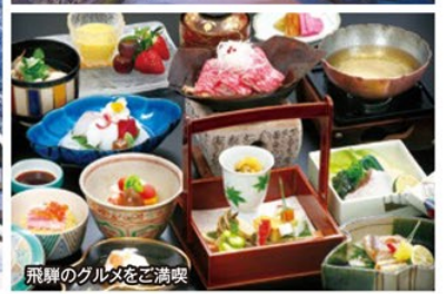
飛騨のグルメをご満喫