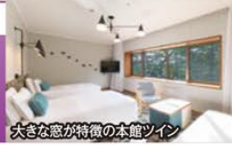
大きな窓が特徴の本館ツイン