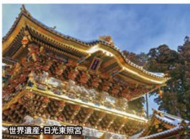
世界遺産:日光東照宮

●創業明治6年、 日本最古のクラシックリゾートホテル「日光金谷ホテル」 にもご宿泊いただけます。