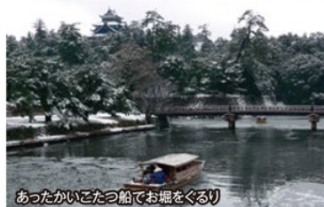
あったかいごたつ船でお堀をぐるり