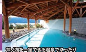
芦ノ湖を一望できる温泉でゆったり