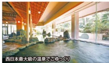
西日本最大級の温泉でゆつくり