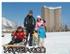
アクティビティも充実