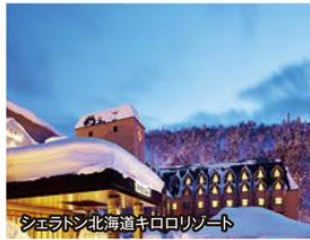
シェラトン北海道キロロリゾート