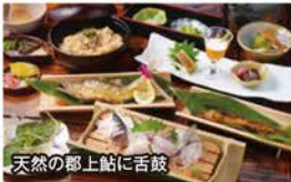
天然の郡上鮎に舌鼓