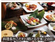
料理長こだわりの夕食(2泊目)