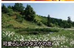
可愛らしいワタスゲの花

旅行期間 2019年7月13日(土)~15日(月・祝) 旅行代金 お一人様 159,000円 (2名様1室) 募集人数 14名(最少催行人数8名) 添乗員 同行いたします 交通機関 JR新幹線【グリーン席・禁煙車】※JR特急【普通指定席・禁煙車】 現地貸切バス(運行バス会社:千曲バス) 宿泊施設 長野駅直結 / ホテルメトロポリタン長野(洋室) 草津温泉 / 季の庭(露天風呂付和スーベリアツイン)