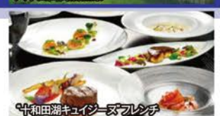
十和田湖キューズフレンチ