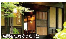
時間を忘れゆったりと

● ご宿泊は、約1万坪の自然あふれる敷地に18棟の 露天風呂付き離れ客室 を配す贅沢の「 ゆふいん月燈庵 」。喧騒から離れ鮮やかな新緑の中で私服のひと時をお過ごしいただけます。