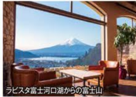
ラピスタ富士河口湖からの富士山

● 列車から、湖から、空から、ホテルから富士山を満喫!中でも富士山を背景に控えたラベンダー畑や、夏を感じさせるひまわり、まだまだ見頃の「バラ」などあらゆる角度より世界遺産・富士山をご覧いただけます。