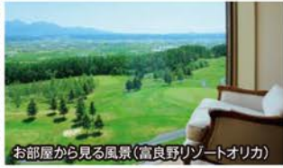
お部屋から見る風景(富良野リゾートオリカ)

●「丘の上の邸宅」 「富良野リゾートオリカ」 に宿泊。広大な田園地帯の景色を眺めながらの創作ディナーもお楽しみの1つ。