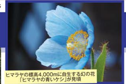
ヒマラヤの標高4,000mに自生する幻の花「ヒマラヤの青いケシ」が見頃

旅行期間 2019年7月13日(土)~15日(月・祝) 旅行代金 お一人様 158,000円 (2名様1室) 募集人数 14名(最少催行人数10名) 添乗員 同行いたします 交通機関 JR東海道新幹線・特急サンダーバード【グリーン席・禁煙車】 ※JR特急しなの・北陸新幹線【普通指定席・禁煙車】 現地貸切バス(運行バス会社: アルピコ交通、妙高高原観光バス) 宿泊施設 松本 / ホテルプエニスタ(洋室) 白馬 / 白馬東急ホテル(洋室)