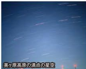
美ヶ原高原の満点の星空