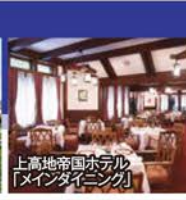
上高地帝国ホテル「メインダイニング」