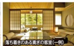
落ち着いた寛ぎの客室(一例)