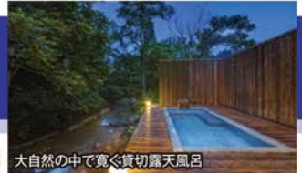
大自然の中で寛ぐ貸切露天風呂