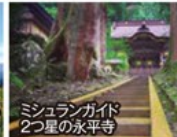
ミシュランガイド2つ星の永平寺