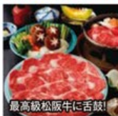
最高級松阪牛に舌鼓!

旅行期間 ①2019年6月1日(土)~2日(日) ②2019年6月8日(土)~9日(日) 旅行代金 お一人様 138,000円 (2名様1室) 募集人数 10名(最少催行人数8名)★10名様限定 添乗員 同行いたします 交通機関 貸切バス(運行バス会社:滋賀中央観光バス) ★全10席、ファーストクラスの乗り心地を実現したサミットVIP 宿泊施設 鳥羽/鳥羽国際ホテル(オーシャンビュースイート)