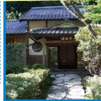
ミシュラン2つ星獲得!! 名亭・美山荘

● 1万株の紫陽花が綺麗とのことで脚光を浴び、京都でも1、2を争う西山『善峯寺』。一面に広がる紫陽花の絶景と感動を是非お楽しみください。