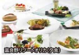
富良野リゾートオリカ(夕食)