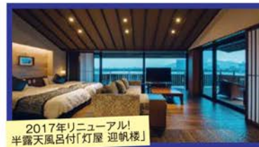
2017年リニューアル!半露天風呂付「灯屋 迎帆楼」