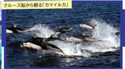
クルーズ船から観る「カマイルカ」