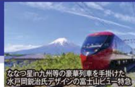
ななつ星in九州等の豪華列車を手掛けた水戸岡鋭治氏デザインの富士山ビュー特急

~毎回好評!富士山ビューの2つのホテルにご宿泊~ 列車・湖・空から観賞!花と絶景と富士山ぐるり満喫 3日間