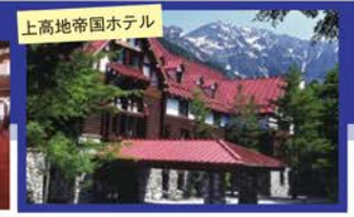
上高地帝国ホテル