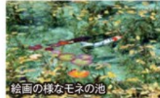
絵画の様なモネの池