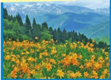
ニッコウキスゲ咲く白山高山植物園

● ニッコウキスゲやホタルブクロ、絶滅危惧種の希少な花々など、50種以上の植物を現地係員の説明のもとご観賞いただけます。