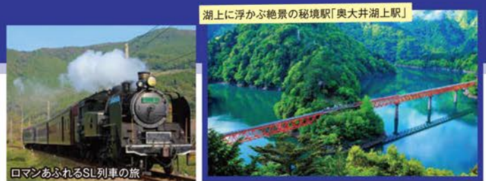
湖上に浮かぶ絶景の秘境駅「奥大井湖上駅」

旅行期間 2019年7月13日(土)~15日(月・祝) 旅行代金 お一人様 158,000円 (2名様1室) 募集人数 16名(最少催行人数10名) 添乗員 同行いたします 交通機関 JR新幹線【グリーン席・禁煙車】 現地貸切バス(運行バス会社:大鉄観光バス) 宿泊施設 静岡市内/ホテルアソシア静岡(洋室) 日本平/日本平ホテル(パルコニー付洋室)