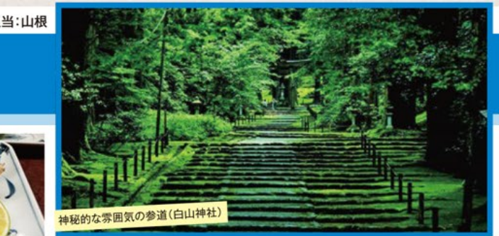
神秘的な雰囲気のある参道(白山神社)