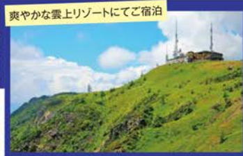
爽やかな雲上リゾートにてご宿泊