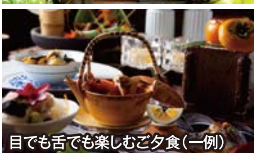
目でも舌でも楽しむご夕食(一例)