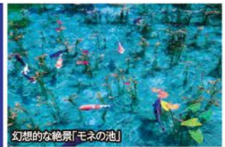
幻想的な絶景「モネの池」

旅行期間 2019年7月14日(日)~15日(月・祝) 旅行代金 お一人様 148,000円 (2名様1室) 募集人数 10名(最少催行人数8名) ★10名様限定 添乗員 同行いたします 交通機関 貸切バス(運行バス会社:滋賀中央観光バス) 全10席、ファーストクラスの乗り心地を実現したサミットVIP 宿泊施設 犬山温泉/灯屋 迎帆楼(半露天風呂付)