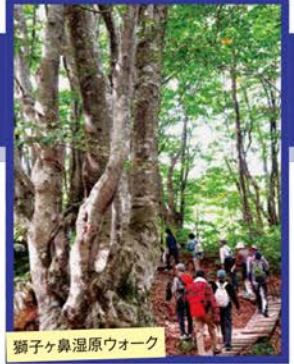
獅子ヶ鼻湿原ウォーク

旅行期間 2019年7月14日(日)～15日(月・祝) 旅行代金 お一人様 138,000円 (2名様1室) ※バルコニー付客室ご希望の場合、お一人様5,000円追加(先着2部屋) 募集人数 14名(最少催行人数10名) 添乗員 現地添乗員が同行いたします 交通機関 航空機、現地貸切バス(運行バス会社:象潟合同タクシー) 宿泊施設 草薨温泉/高見屋 最上川別邸「紅」(和洋室または洋室)