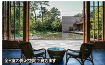
全8室の贅沢空間で寛ぎます