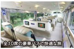
全10席の豪華バスで快適な旅

● 通常45名乗りの大型バスを全10席にレイアウトにした最高級バス「サミットVIP」にご乗車。全席に大型モニターを備え、化粧室まで完備した、まるでファーストクラスに乗っているかのような快適な旅をお楽しみください。 ● 古の歴史薫る東海の名城「犬山城」名古屋城を巡ります。名古屋城では、ついに完成公開された豪華絢爛な「本丸御殿」をご覧いただけます。また、日本一のブランド産の天然郡上鮎に行列の絶えない人気店のひつまぶしなど、グルメにもこだわったプレミアムツアーです。