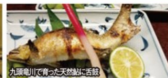
九頭竜川で育った天然鮎に舌鼓

旅のPoint ● 一度は訪れてみたい苔むす境内の美景が広がる「白山神社」。街の中心部とは空気の異なる、白山信仰の「聖域」で心清まる神秘の絶景をお楽しみいただけます。