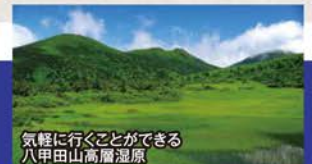
気軽に行くことのできる八甲田山高層湿原