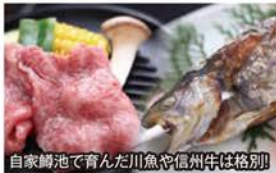
自家鱈池で育んだ川魚や信州牛は格別!

●お食事にも定評のある王ヶ頭ホテルでは、厳選 された地元食材の創作料理をご堪能ください。