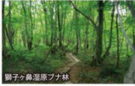
獅子ヶ鼻湿原ブナ林

●ニッコウキスゲをはじめ、約350種類の花々が咲き誇る天空の楽園「月山」はまさに高山植物の宝庫!!現地ネイチャーガイド同行!木道が整備されているので初心者の方でも安心して散策していただけます。