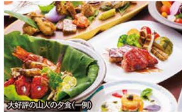
大好評の山人の夕食(一例)