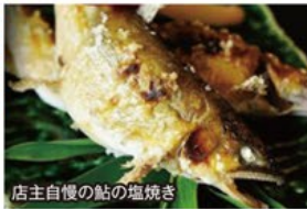
店主自慢の鮎の塩焼き