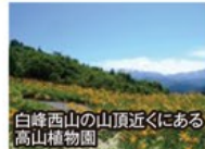
白峰西山の山頂近くにある高山植物園