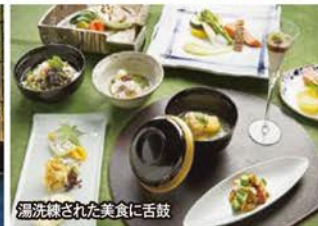
湯洗された美食に舌鼓