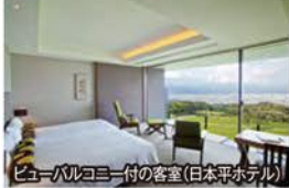
ビューパルコニー付の客室(日本平ホテル)

旅行期間 2019年7月13日(土)~15日(月・祝) 旅行代金 お一人様 158,000円 (2名様1室) 募集人数 16名(最少催行人数10名) 添乗員 同行いたします 交通機関 JR新幹線【グリーン席・禁煙車】 現地貸切バス(運行バス会社:大鉄観光バス) 宿泊施設 静岡市内/ホテルアソシア静岡(洋室) 日本平/日本平ホテル(パルコニー付洋室)