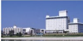
長良川河畔に行むホテル