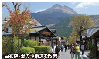
由布院・湯の坪街道を散策