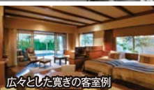
広々とした寛ぎの客室例

旅行期間 2019年7月13日(土)~15日(月・祝) 旅行代金 一人様 118,000円 (4名様1室) 123,000円 (3名様1室) 128,000円 (2名様1室) 募集人数 6名様限定(最少催行人数2名) 添乗員 同行ありません 交通機関 JR新幹線【普通指定席・禁煙車】 ※往復グリーン席ご希望の場合、一人様10,000円追加 宿泊施設 湯やまぐち湯田温泉/古稀庵(和洋室)