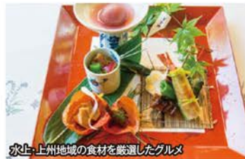
北上・上州地域の食材を厳選したグルメ