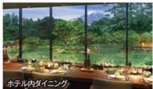
ホテル内ダイニング

～グループ毎に観光タクシーをご用意～ 昨年10月誕生!全室スイート露天風呂付客室「ふふ河口湖」フリー2日間