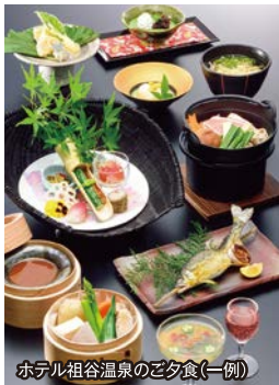
ホテル祖谷温泉のご夕食(一例)

● ご宿泊は、昨年好評の日本三大秘境「 祖谷渓 」を望む一軒宿「 ホテル祖谷温泉 」。6名様限定で、 展望風呂付の贅沢なお部屋 をご用意。客室のお風呂から、涼しげな 渓谷美 をひとりじめいただけます。ホテルの名物でもある ケーブルカー で行く 谷底の露天風呂 もお楽しみのひとつです。