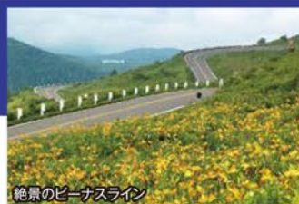
絶景のビーナスライン