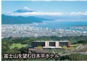
富士山を望む日本平ホテル

旅行期間 2019年7月13日(土)~15日(月・祝) 旅行代金 お一人様 158,000円 (2名様1室) 募集人数 16名(最少催行人数10名) 添乗員 同行いたします 交通機関 JR新幹線【グリーン席・禁煙車】 現地貸切バス(運行バス会社:伊豆バス他同等クラス) 宿泊施設 日本平/日本平ホテル(洋室) 河口湖温泉/ラピスタ富士河口湖(洋室)