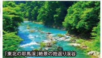
「東北の耶馬溪」絶景の抱返り溪谷

旅行期間 2019年7月14日(日)～15日(月・祝) 旅行代金 お一人様 169,000円 (2名様1室) 募集人数 12名(最少催行人数10名) 添乗員 現地添乗員が同行いたします 交通機関 航空機、現地貸切バス(運行バス会社:国際興業バス) 宿泊施設 湯川温泉/山人-yamado-(半露天風呂付洋室)