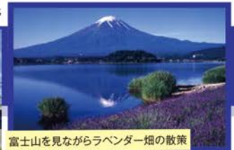
富士山を見ながらラベンダー畑の散策

旅のPoint ● 風景美術館と称される「日本平ホテル」や河口湖と富士山が一望できる高台にある「ラピスタ富士河口湖」の富士山ビューの2つのホテルにご宿泊!ご旅行中ずっと富士山を観賞できます。