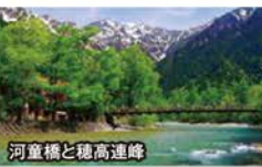
河童橋と穂高連峰

旅行期間 2019年7月13日(土)~15日(月・祝) 旅行代金 お一人様 148,000円 (2名様1室) ※両ホテルともお部屋アップグレードの場合はお一人様15,000円追加(ホテル翔峰は「展望風呂付和室」、上高地帝国ホテルは「ベランダ付ツイン」へのアップグレードとなります) 募集人数 12名(最少催行人数10名) 添乗員 同行いたします 交通機関 JR新幹線・特急【グリーン席・禁煙車】 現地貸切バス(運行バス会社: 山岳観光バス) 宿泊施設 美ヶ原温泉 / ホテル翔峰(和室) 上高地 / 上高地帝国ホテル(洋室)