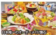
日本唯一のオーダーメイド懐石

～オーダーメイド懐石と九頭竜川の天然鮎に舌鼓～ 昨年大好評!越前の“神秘の苔庭”と山中温泉5つ星の宿「花紫」2日間