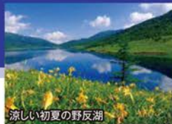
涼しい初夏の野反湖

旅行期間 2019年7月13日(土)~15日(月・祝) 旅行代金 お一人様 159,000円 (2名様1室) 募集人数 14名(最少催行人数8名) 添乗員 同行いたします 交通機関 JR新幹線【グリーン席・禁煙車】※JR特急【普通指定席・禁煙車】 現地貸切バス(運行バス会社:千曲バス) 宿泊施設 長野駅直結 / ホテルメトロポリタン長野(洋室) 草津温泉 / 季の庭(露天風呂付和スーベリアツイン)