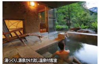
湯つくり、源泉かけ流し温泉付客室

旅行期間 2019年7月14日(日)～15日(月・祝) 旅行代金 お一人様 159,000円 (2名様1室) ※洋室・和洋室ご希望の場合、お一人様9,000円追加 募集人数 12名(最少催行人数8名) 添乗員 同行いたします 交通機関 JR新幹線【グリーン席・禁煙車】※東京以遠【普通指定席・禁煙車】 現地貸切バス(運行バス会社:新和観光バス) 宿泊施設 水上温泉/別邸仙寿庵(露天風呂付和室・和洋室・洋室)