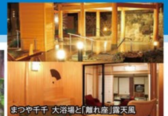
まつや千千 大浴場と「離れ座」露天風呂