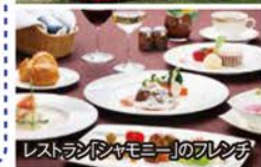
レストラン「シャモニー」のフレンチ