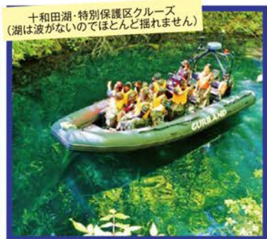
十和田湖・特別保護区クルーズ(湖は波がないのでほとんど揺れません)

●美しい溪流の代名詞・奥入瀬溪流、十和田湖では原生の森と絶壁に囲まれた十和田湖・特別保護区をクルーズ!