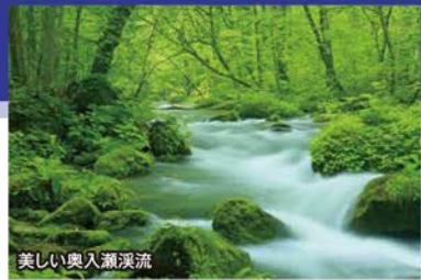
美しい奥入瀬溪流