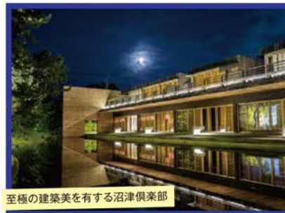
至極の建築美を有する沼津倶楽部

石鉄二代目当主)の別荘「松席園」 として明治末期に建てられた沼津 倶楽部。現在では「歴史」と「モダ ン」が美しく調和した全8室の美し いホテルとして蘇りました。その見 事な建築美と高いホスピタリティ を感じながら、ゆっくりとご滞在 いただけます。