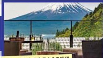
富士山が見える客室からの眺望