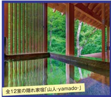
全12室の隠れ家宿「山人-yamado-」

旅のPoint ●前回ドクターズツアーでも大好評の岩手県・湯川温泉「山人」。全12室の洗練された客室は半露天風呂を備え、自然の中でゆったりとお過ごしいただけます。また、食材にこだわった山人でしか味わえない料理も絶品です。 ●仙台～秋田・角館まで涼を求めて、ゆったりと縦断。歴史と神秘的な雰囲気を楽しめる瑞巖寺に毛越寺、東北の耶馬溪とも言われる絶景「抱返り溪谷」に角館の武家屋敷などを巡ります。