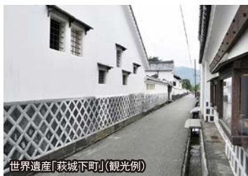
世界遺産「萩城下町」(観光例)

旅のPoint ● 真心のおもてなしで全国からのリピーターが多い極上の宿「 古稀庵 」。広い敷地に客室は僅か16室しかなく、 源泉かけ流しの露天風呂付 となっております。お料理も郷土の美味を数々の味付けでお召し上がりいただけ、身も心も満たされる至福の時間をお過ごしください。