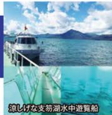
涼しげな支笏湖水中遊覧船