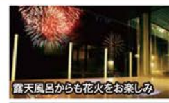
お部屋から鑑賞できる圧巻の「熱海海上花火大会」