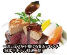
一流シェフが手掛ける贅沢フレンチ(日本平ホテル料理一例)

● 日本観光地百選第1位に選ばれる日本平。眼下に広がる駿河湾の絶景を望む日本平ホテルにご宿泊。まるで美術館に居るような美しい風景と絶好のロケーションでゆったりとお寛ぎください。