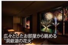
広々としたお部屋から眺める「洞爺湖の花火」

●全室レイクビューで洞爺湖と一体になれる天空露天風呂を館内に備え付けた、「ザレイクビュー TOYA 乃の風リゾート」。お部屋は「56㎡のプレミアム滞在」が約束された、乃の風倶楽部の和洋室でご用意。夜には恒例の打上げ花火が露天風呂やお部屋からご覧いただけます(20:45～約5分間)。