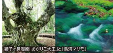
獅子ヶ鼻湿原「あがりこ大王」と「鳥海マリモ」