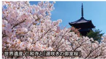
世界遺産(仁和寺と「遅咲きの御室桜」)