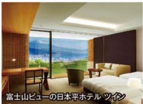
富士山ビューの日本平ホテル ツイン