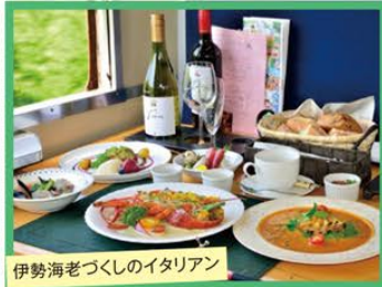
伊勢海老づくしのイタリアン

● お泊りは山と海に囲まれた房総唯一の純和風旅館にて、地元で水揚げされたばかりの旬の地魚懐石をご用意しております。