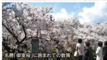
名勝「御室桜」に囲まれての散策