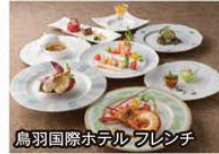
鳥羽国際ホテルフレンチ

旅のPoint ● 通常45名乗りの大型バスを全10席にレイアウトにした最高級バス「サミットVIP」にご乗車。全席に大型モニターを備え、化粧室まで完備した、まるでファーストクラスに乗っているかのような快適な旅をお楽しみいただけます。 ● 天皇后両陛下やエリザベス女王もお泊りになった迎賓館「鳥羽国際ホテル」のオーシャンビュースイートにご宿泊。ご夕食には実際に天皇后両陛下がお召し上がりになったメニュー「非公開の晚餐」をご堪能。 ● 5月の皇太子さまの即位、新元号が適用される前の“平成最後”にお伊勢参りをいたします。