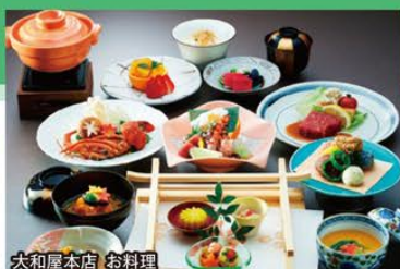
大和屋本店 お料理