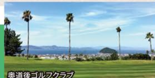
奥道後ゴルフクラブ