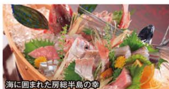
海に囲まれた房総半島の幸

~東京からわずか1時間少して、旬の春を愛でる旅~ 日本最大級のひな祭り 一足早く春を感じる房総半島 2日間