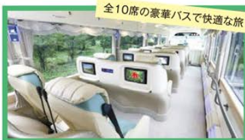
全10席の豪華バスで快適な旅