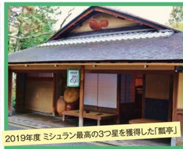
2019年度 ミシュラン最高の3つ星を獲得した「瓢亭」

旅行期間 平成31年3月3日(日) (日帰り) 旅行代金 お一人様 43,800円 募集人数 25名(最少催行人数12名) 添乗員 同行いたします 交通機関 貸切バス(運行バス会社:イワサバス) 昼食場所 京都東山/瓢亭(掘り炬燵席)