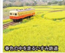
春色の中を走るいすみ鉄道