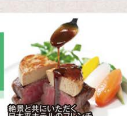
絶景と共にいただく日本平ホテルのフレンチ