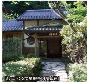
ミシュラン2つ星獲得の「美山荘」