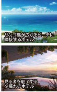
サンゴ礁が広がるビーチに隣接するホテル

宿泊施設 伊良部島/イラフSUIラグジュアリーコレクションホテル沖繩宮古(55m以上のオーシャンビュールーム・連泊)