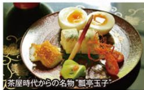
「茶屋時代からの名物「瓢亭玉子」

旅行期間 平成31年3月3日(日) (日帰り) 旅行代金 お一人様 43,800円 募集人数 25名(最少催行人数12名) 添乗員 同行いたします 交通機関 貸切バス(運行バス会社:イワサバス) 昼食場所 京都東山/瓢亭(掘り炬燵席)