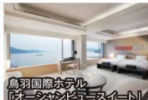
鳥羽国際ホテル「オーシャンビュースイート」