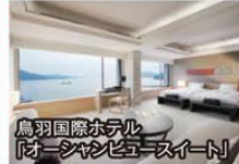
鳥羽国際ホテル「オーシャンビュースイート」