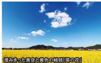
澄みきった青空と黄色の絨毯「菜の花」