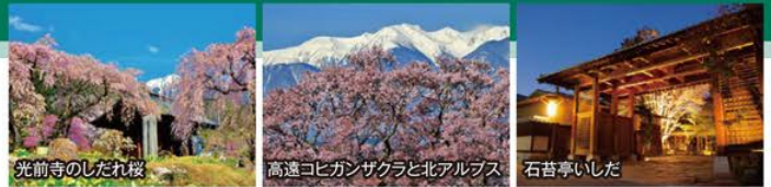
光前寺のしだれ桜