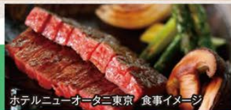
ホテルニューオータニ東京 食事イメージ