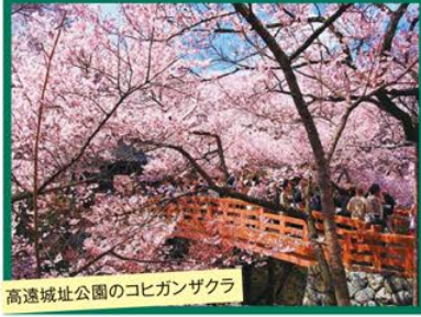
高遠城址公園のコヒガンザクラ