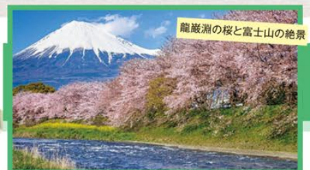
龍巖淵の桜と富士山の絶景