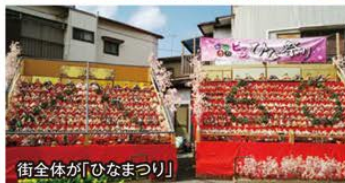
街全体が「ひなまつり」