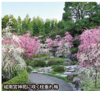
城南宮神苑に咲く枝垂れ梅