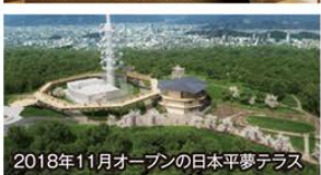
2018年11月オープンの日平夢テラス