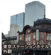
東京ステーションホテル 外観

旅行期間 平成31年3月9日(土)~10日(日) 旅行代金 お一人様 98,000円 (2名様1室:丸ノ内ホテル) ※東京ステーションホテルご希望の場合、お一人様8,000円追加 募集人数 14名(最少催行人数8名) 添乗員 2日目より現地添乗員が同行いたします 交通機関 JR新幹線【グリーン席・禁煙車】 現地貸切バス(運行バス会社:富士急行または同等) 宿泊施設 東京/丸ノ内ホテル(洋室) または 東京ステーションホテル(洋室)