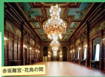
赤坂離宮・花鳥の間