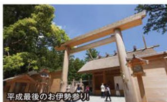
平成最後のお伊勢参り

~10名様限定のラグジュアリーバス特別企画~ 最高級バスで行く“平成最後のお伊勢参り” “非公開の晚餐” 2日間