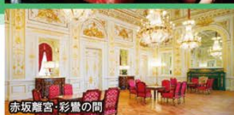
赤坂離宮・彩響の間