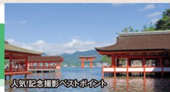
人気記念撮影スポット

旅のPoint ● ホテル 宮島別館は創業百年の「錦水館」が作られた、宮島で一番新しい宿です。夕食は日本の自然派イタリアン料理の匠「アル・ケッチャーノ」奥田政行シェフが初監修。ここでしか味わうことができないイタリアンとフレンチの洋食buffet料理をご用意。オープンキッチンでつくる熱々のグリル料理や、特製アラカルトもお楽しみください。 ● 桜咲き誇る、世界遺産・日本三景の島「宮島」の今と歴史と神秘に触れる旅です。