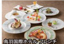
鳥羽国際ホテルフレンチ