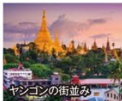
ヤンゴンの街並み

旅行期間 平成31年3月21日(木・祝)~24日(日) 旅行代金 お一人様 198,000円 (2名様1室/エコノミークラス利用) ※シングル利用の場合、20,000円追加 ※空港税、燃油特別付加税等(概算22,000円)別途必要 ※ビジネスクラスご希望の場合は、お一人様148,000円追加 募集人数 14名(最少催行人数10名) 添乗員 同行いたします 利用航空会社 ベトナム航空・ミャンマー航空(国内線) 宿泊施設 ヤンゴン/メリアヤンゴン または同等クラス バガン/ミャンマー・トレジャー・リゾート または同等クラス