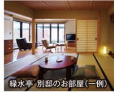
緑水亭 別邸のお部屋(一例)