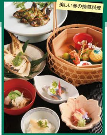
美しい春の摘草料理