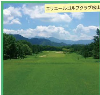
エリエールゴルフクラブ松山

旅のPoint ● 2018年に「大王製紙エリエールレディスオープン」が開催された「エリエールゴルフクラブ松山」。標高480mの高台から瀬戸内海を望むコースです。日本屈指の名門コースとして名高い「奥道後ゴルフクラブ」。日本を代表する文豪が収集した由緒ある大木や、四季折々の花々が各ホールを彩る珍しいコースです。 ● プレーの後は、日本最古の湯といわれる道後温泉へ。「大和屋本店」では、瀬戸内の幸を用いた日本料理と趣向を凝らした大浴場で温泉をご堪能ください。