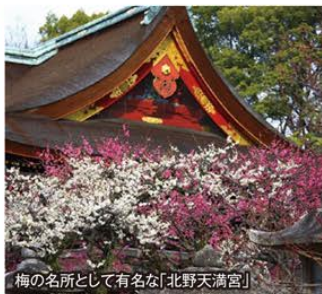
梅の名所として有名な「北野天満宮」

旅のPoint ● 450年程前に腰掛茶屋として暖簾を掲げ、2019年度のミシュラン最高賞となる3つ星を獲得した「瓢亭」。長きに渡って研ぎ澄まされた京懐石をはじめ、代々受け継がれてきた名物の「瓢亭玉子」は伝統の逸品です。 ● 150本の枝垂れ梅と300本の椿が咲き誇る名所「城南宮」と、広い境内に50種1,500本もの紅白の梅が咲き競う京都随一の梅の名所「北野天満宮」へご案内いたします。